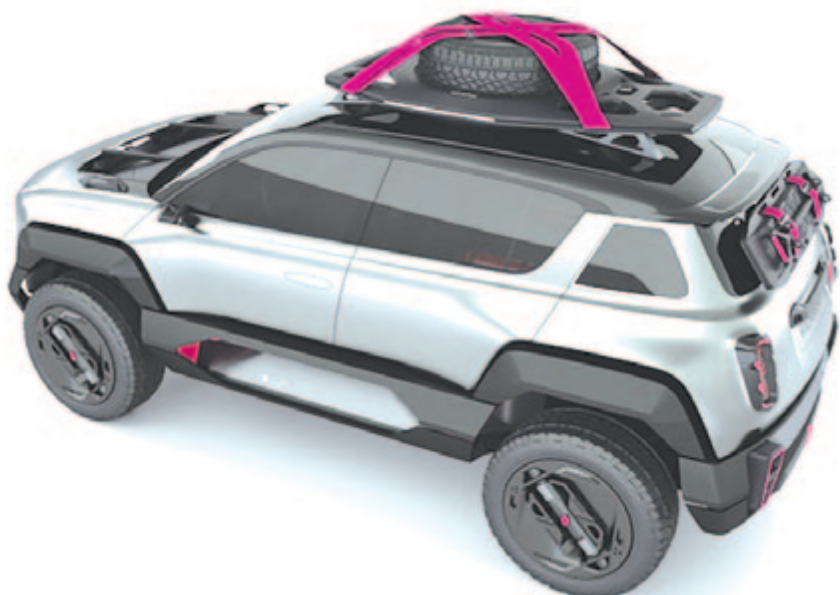
Renault 4EVER, a ralikiegészítővel

szegmensbe érkező SUV lesz, a hossza 4,1, a szélessége 1,95, míg a magassága 1,9 méter lesz, már ha valaha elkezdik a nagyszériás gyártást, amire olyan sok esély nincs. Maga a koncepció melleleg ugyanarra a CMF-BEV platformra épül, mint az R5 mini, a Nissan Micra vagy éppen az Alpine kompakt autója. Ha méretben kellene neki keresni egy megfelelőt, a jelenlegi Renault-kínálatban talán a Captur lehetne mondani.