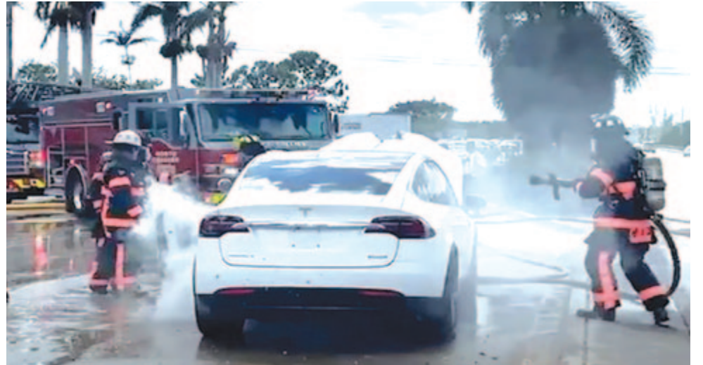
Kigyulladó Tesla Floridában

Természetesen ez egy különleges helyzet, és még így sem lehet kijelenteni azt, hogy a villanyautók tűzveszélyesebbek vagy ilyen szempontból veszélyesebbek, mint a belső égésű motorral szerelt gépjárművek. A statisztikai hivatal adatai szerint 100.000 autóból 1529 belső égésű kigyullad, míg az elektromos autók esetében ez a szám mindössze 25. Tehát nem kell ezért szidni a villanyautókat, illetve azt sem szabad elfelejteni, hogy a víz a hagyományos autók számára sem kedvez, a motorba kerülve végzetes károkat tud okozni.