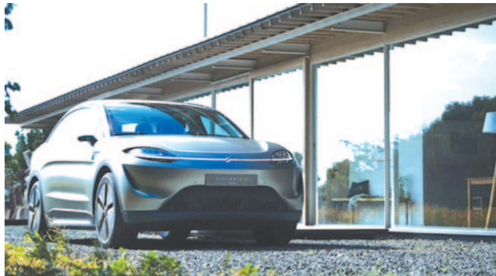
A Sony Honda Mobility első prototípus-autója

Az információk szerint az új típus a Honda valamelyik amerikai üzemében fog készülni, az akkumulátorcsomagok pedig minden bizonnyal a Honda-LG közös, még építés alatt álló akkugyárából érkeznek.