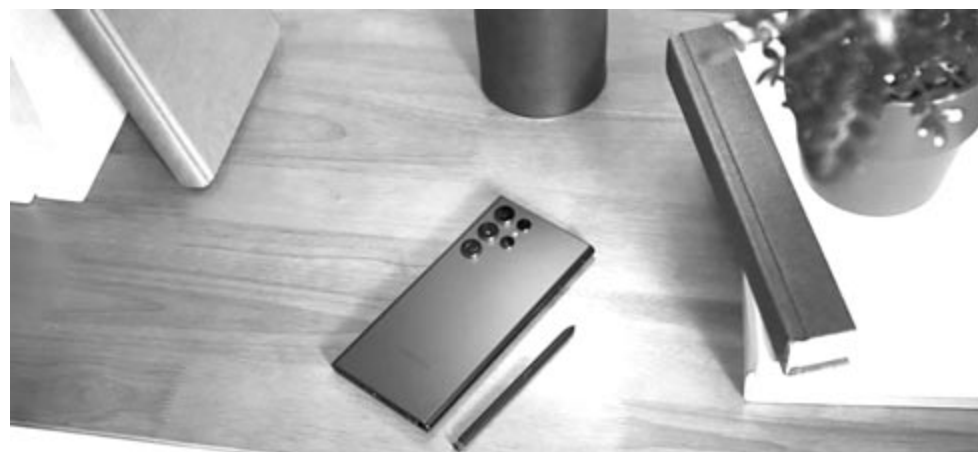
Samsung Galaxy S22 Ultra, illusztráció a Karbantartási módhoz