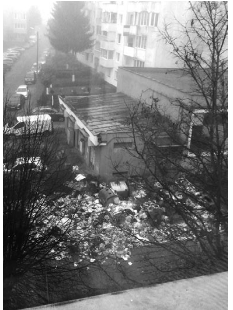
Az olvasónk által beküldött fotón hétfőn reggel a Gyümölcskertész (Pomicultorilor) utcában összegyűlt szemét látható

Soós Zoltán polgármester megerősítette, súlyos a helyzet, a Helyi Rendőrség, a közterületfenntartó igazgatóság munkatársai folyamatosan monitorozzák a városban tapasztalható rendellenességeket, bírságnak. Minden szemeteskosci útvonalán és minden településen, ahol ott maradt a szemét, a bírság 2500 lej.