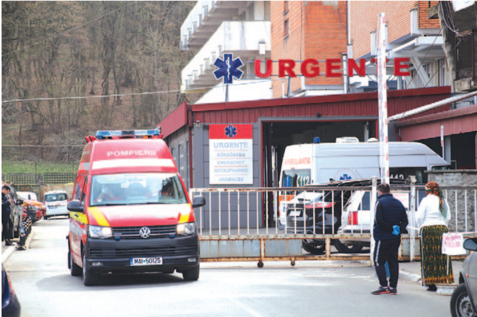
Felvételünk illusztráció.

Az orvosi műhibák rendezésének hiányosságairól indított több nagyvárosban vitasorozatot a Romániai Orvosi Kamara (romániai szóhasználat szerint kollégium) az orvosok és a páciensek szervezetei, az egészségügyben működő szakszervezetek, jogászok és a sajtó képviselőinek részvételével.