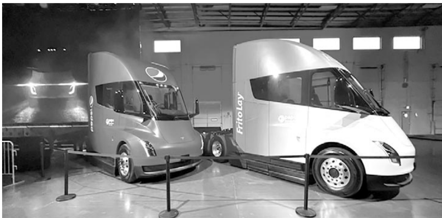
A Pepsinek leszállított első két Tesla Semi

Ennek egy másik oka, hogy a Tesla Semit olcsónak semmiképpen nem lehet nevezni. A belépőmodellért 150 ezer dollárt kérnek el, míg a nagyobb akkumulátorral szerelt csúcsváltozat több mint 180 ezer dollárt kóstál. Ezek pedig a jelenlegi árak, vagyis azok, amelyekkel elő lehetett rendelni a kamiont. Ha most valaki rákeres a Tesla honlapjára, azt fogja látni, hogy nincsenek árak feltüntetve a Semi mellett, azaz lehet arra készülni, hogy a közeljövőben még többet fognak elkérni egy-egy példányért. Pedig a csúcsváltozat jelenlegi árából is két nagyon jó dízel teherautót lehet venni. Ha ezt is figyelembe vesszük, nincs túl sok esélye a Tesla Seminek, még annak ellenére sem, hogy Európában is vannak komoly támogatások az elektromos használgépjárművekre, és az Egyesült Államokban a Biden-kormányzat is 40 ezer dolláros adójóváírást kínál azon vállalatoknak, amelyek elektromos kamionra váltanak. Azonban még így sem valószínű, hogy a Tesla Semi egy sikertörténet lesz. A gyártó azzal számol, hogy éves szinten képes lesz 100 ezer darabot legyártani és értékesíteni is, viszont az árakat ismerve ez finoman szólva is optimista becslés.