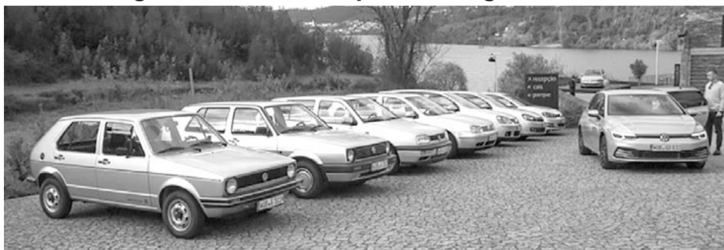
Volkswagen Golf – a legelsőtől a legújabbig

Októberben a legnagyobb példányszámban értékesített autó a Volkswagen Golf volt, amiből 17.155 darabot adtak el az öreg kontinensen. Ez a többi között azért is érdekes, mert a nyár elején sokan elkezdtek temetni a Golfot, és bár a Volkswagen vezérigazgatója cáfolta a híreket, melyek szerint hamarosan búcsúznia kellene a népszerű modellnek, számos vásárló érezte úgy, hogy már nem sokáig tud vásárolni a méltán népszerű típusból.