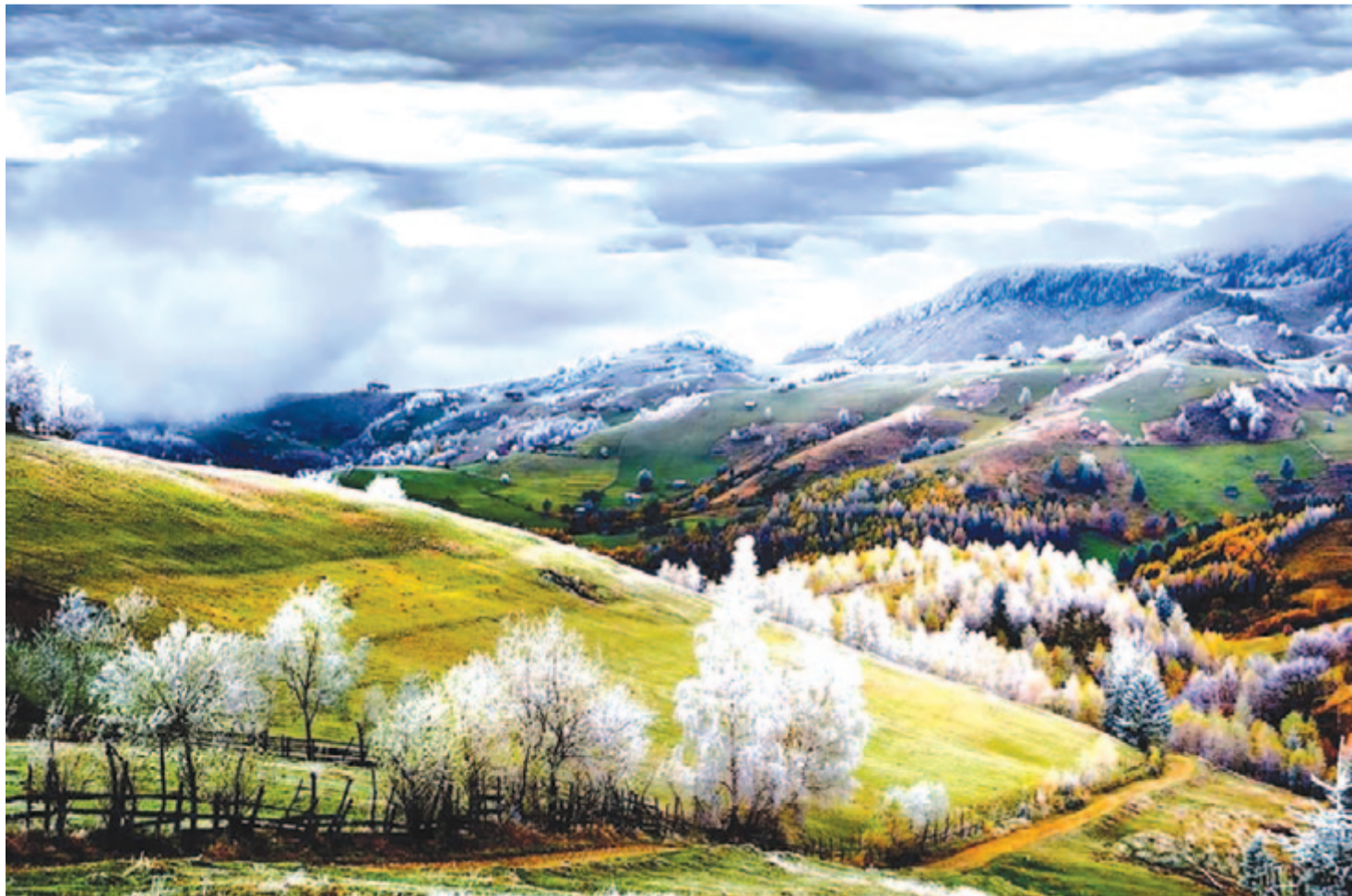
Minden oly csendes, hallgatag – Mely nyelv merne versenyezni véled