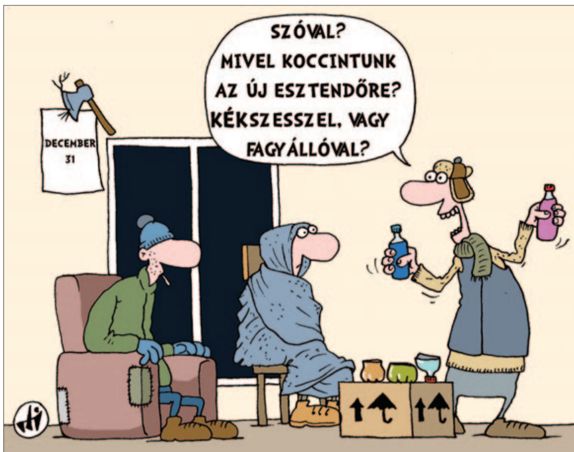
Horváth Szekeres István rajza

Hogyha még egy konzult látok, meggyónok és konzultálok! Oldozz fel!