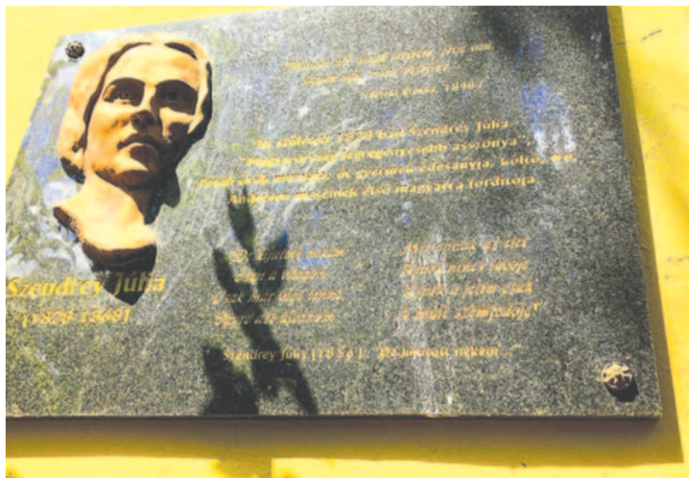
Szendrey Júlia-emléktábla a romos ház falán

Melytől kórókká válnak át A még virágzó ágak, S mint omló könnyek, hullanak Levelei a fáknak.