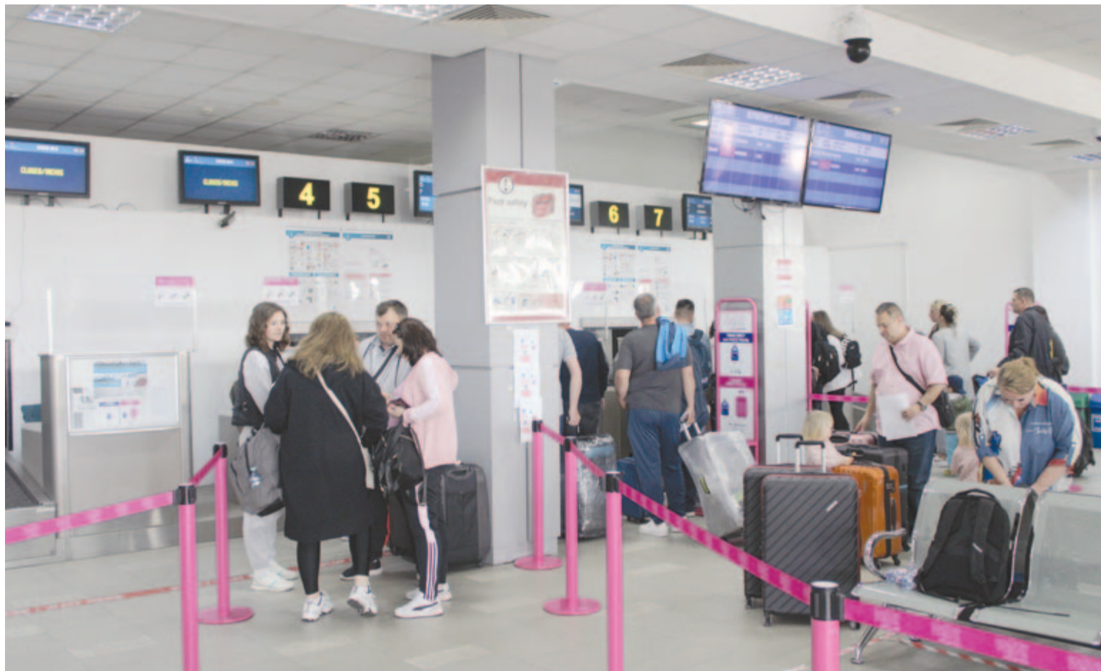
Tavasszal kezdhetik az új utasfogadó építését