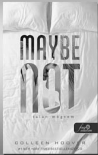
Colleen Hoover Talán mégsem