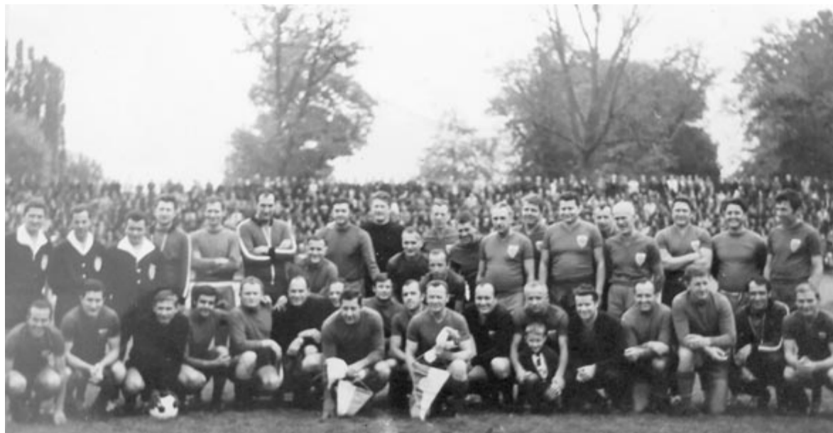
Együtt a két csapat az 1971-es öregfiú-mérkőzésen