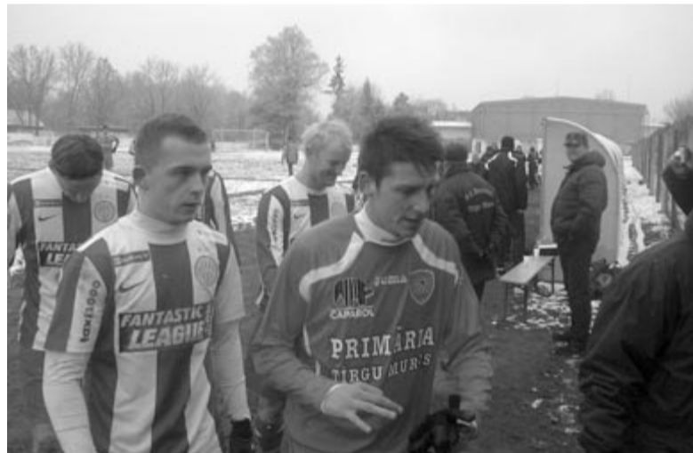
Öltözőbe vonul az FTC és az FCM a 2011-es szászrégeni mérkőzés félidejében