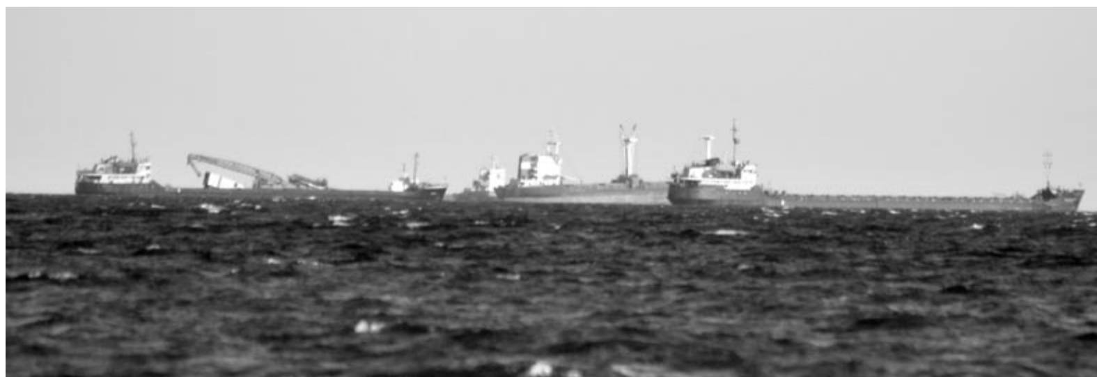
Áruszállító hajók Sulina partjainál

Február 2-án, csütörtökön Petre Daea mezőgazdasági és vidékfejlesztési miniszter kijelentette, hogy az Európai Bizottság támogatni fogja az Ukrajnából olcsóbban behozott gabona és napraforgó miatt érintett hazai gazdákat. A szaktárca vezetője elmondta, hogy a mezőgazdasági miniszterek január 30-ai brüsszeli tárgyalásán Lengyelország, Bulgária, Magyarország, Csehország és Szlovákia és Románia alaposan tájékoztatta az Európai Bizottságot. Ezek az országok arra kérték a biztosokat, hogy hozzák meg a kellő intézkedéseket, támogassák az érintett gazdálkodókat. A valós helyzet az, hogy a háború miatt nem tudták eladni terményeiket a hazai gazdák, ezenfelül még 3 millió tonna olcsó gabona is érkezett az országba. A szolidaritási folyosók miatt nagy mennyiségű búzát szállítottak Ukrajnából Románián keresztül, ugyanakkor az ára miatt már nálunk is megvásároltak jelentős mennyiségű búzát és napraforgót, emiatt borult fel a piaci egyensúly. Janusz Wojciechowski mezőgazdasági biztos felszólalásában belátta, hogy fel kell karolni az említett országok gazdálkodóit, várjuk a konkrétumokat – tette hozzá nyilatkozatában Petre Daea .