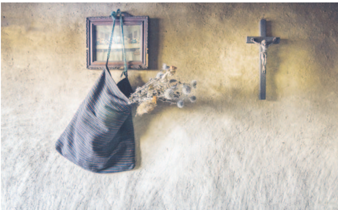
A kor falára... Ádám Gyula fotója

Mindezeket látványosan egészítik ki a jubileumi anyagba beválogatott textíliák, kerámiák, fotók. Tóth Norbert kurátort bizonyára a Kárpát-haza Galéria kiállításai is vezérelték a mostani kollekciónak összeállításakor, ami még hangsúlyosabbá teszi a vándortárlat stilisztikai sokszínűségét. És ha netán az eklektika fogalma is felsejlik bennünk, azt se feledjük, hogy a Bernády Ház földszinti és emeleti galériájában kirajzoló Petőfi-mozaik a vizuális művészetek más-más ágazatai és különböző alkotó nemzedékek, öntörvényű művészek sajátos víziói révén áll össze. Viszont a mindezeket szervesítő matéria, az eszmei, érzelmi kapocs, ami a kiállított műtárgyakat egyben tartja, az a közös tematika és az abból kidoborodó kategorikus imperatívusz, amit Petőfi is vallott: a haza, a nemzet, a nép mindenekelőtt. Az azonos ihletforrás nyilván nem feltételez monoton egyhangúságot, ahogy bennünk, laikusokban is kialakult egy féltve őrzött Petőfi-kép, amihez konokul ragaszkodunk, legyen az romantikus, historizáló, népies vagy realista, esetleg valamelyik izmusra épülő, a művészek is kitartanak saját alkotói nézeteik mellett, saját útjukat járva, a jelenkor vizuális nyelvét használva, annak újdonságait magukba ötvözve éltetik a költő örökségét, idézik föl példázatát. Ne csodálkozzunk tehát, ha a tárlaton egymás szomszédságába