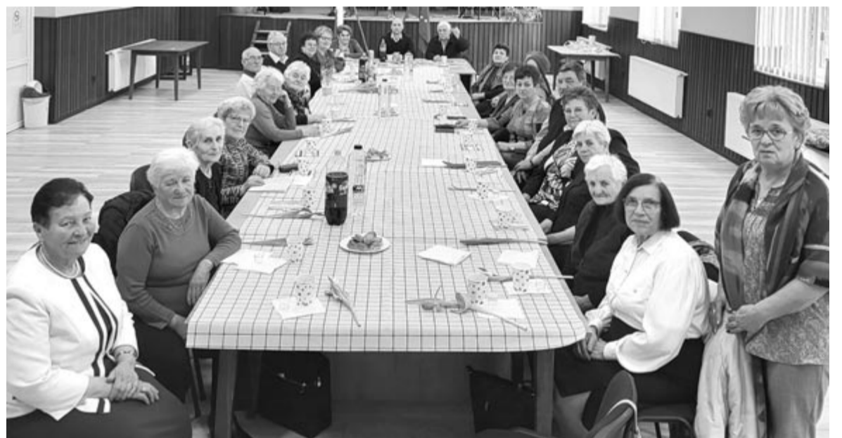
A polgármester is virággal köszöntötte szerdán a nyugdíjasklub hölgytagjait