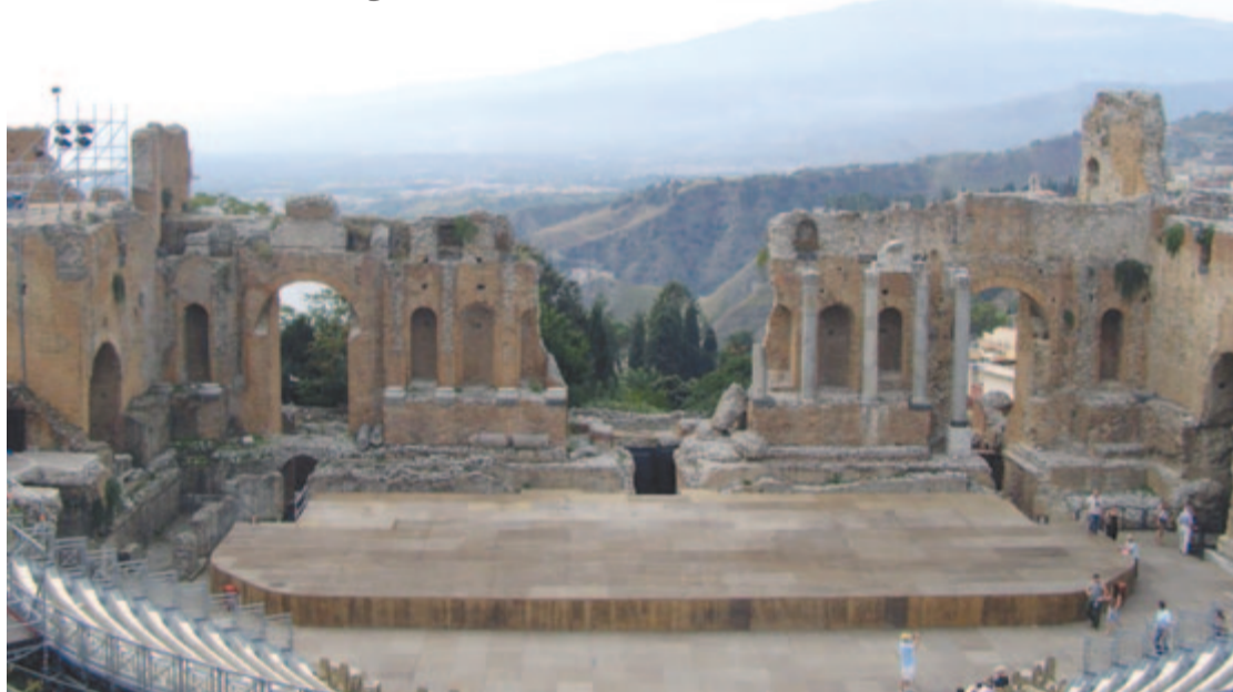
Csontváry-émlék... A taorminai görög színház és az Etna