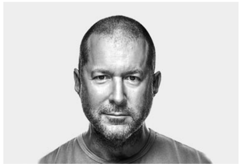
Sir Jony Ive

Vagy talán eljött az az idő, amikor az Apple is beáll a többiek mellé, és már nem akar az egyéni személyiségre vagy a másként gondolkodásra összpontosítani? A márka használójaként leírni is fáj ezt a mondatot, viszont ha őszinték akarunk lenni, minden jel erre