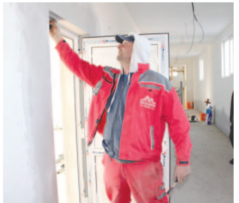
Felgyorsultak a munkálatok a felújítás alatt levő iskolában