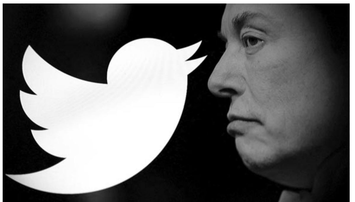
Elon Musk alatt hanyatlásnak indult a Twitter, illusztráció

Minden bizonnyal ezzel a döntéssel vissza akarja csábítani a felhasználókat a fő alkalmazásba. Továbbá az sem kizárt, hogy ennek a lépésnek lesz jelentősége a Meta-univerzum elindulásában is.