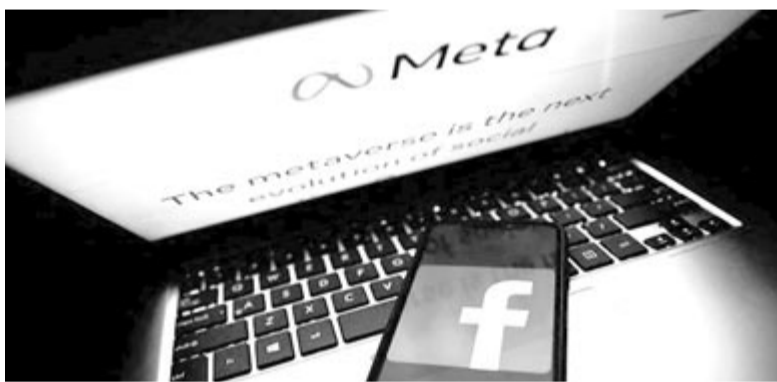
Új Meta közösségi médiás felület, illusztráció