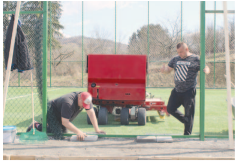
Gondozzák az új műfüves pályát

Nagyon be kéne fejezzük a körtvélyfáji és magyarpéterlaci kultúrotthonok évek óta tartó felújítását. Még mindig építés alatt állnak, továbbra is nagy baj van a kivitelezőkkel. Valamilyen megoldást kell találnunk, hogy az idén befejezzük őket, hiszen már két éve folyamatban van az építés. A körtvélyfáji iskola felújításán már más kivitelező dolgozik, ott jól haladnak a munkálatokkal. A környezetvédelmi alap programján keresztül a gernyeszegi orvosi rendelőt energetikai téren javítjuk fel, a körtvélyfáji rendelőt pedig LEADER-alapokból tesszük