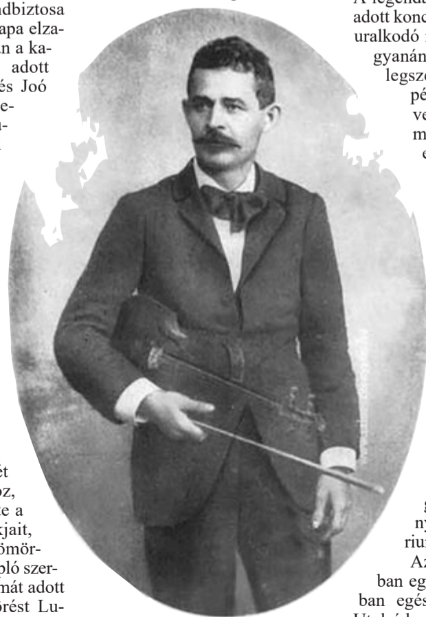
Dankó Pista 1890 körül

Dankó Pista az 1880-as évek közepétől többször körbeutazta az országot, 1895-ben Pósa Lajos baltoni nótáinak megzenésítésével