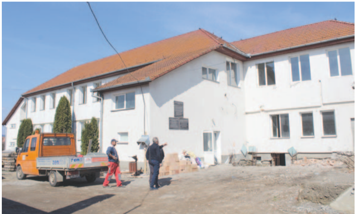
A felújítás alatt álló körtvélyfáji iskola

Szerencsére a saját embereinkkel sok problémát meg tudunk oldani, nagyon jó a csapat. Marosteleken például hamarosan befejeződik a halottasház építése, amelyet a mi embereink építettek fel. Nemsokára pedig nekifogunk a magyarpéterlaci és a marosjári halottasházaknak is. Ezeket a munkálatokat helyi költségvetésből álljuk. A jelenleg is zajló pályázati időszakban nagyon sok projektre lehet pályázni, és ez nagy előny. Igyekszünk minél többet megnyerni. Nincs megállás, folyamatosan három-négy, uniós pénzből vagy saját költségvetésből megvalósított, illetve megvalósítandó projekten dolgozunk – például parkokat, járdákat, biciklitutakat létesítettünk és létesítünk továbbra is.