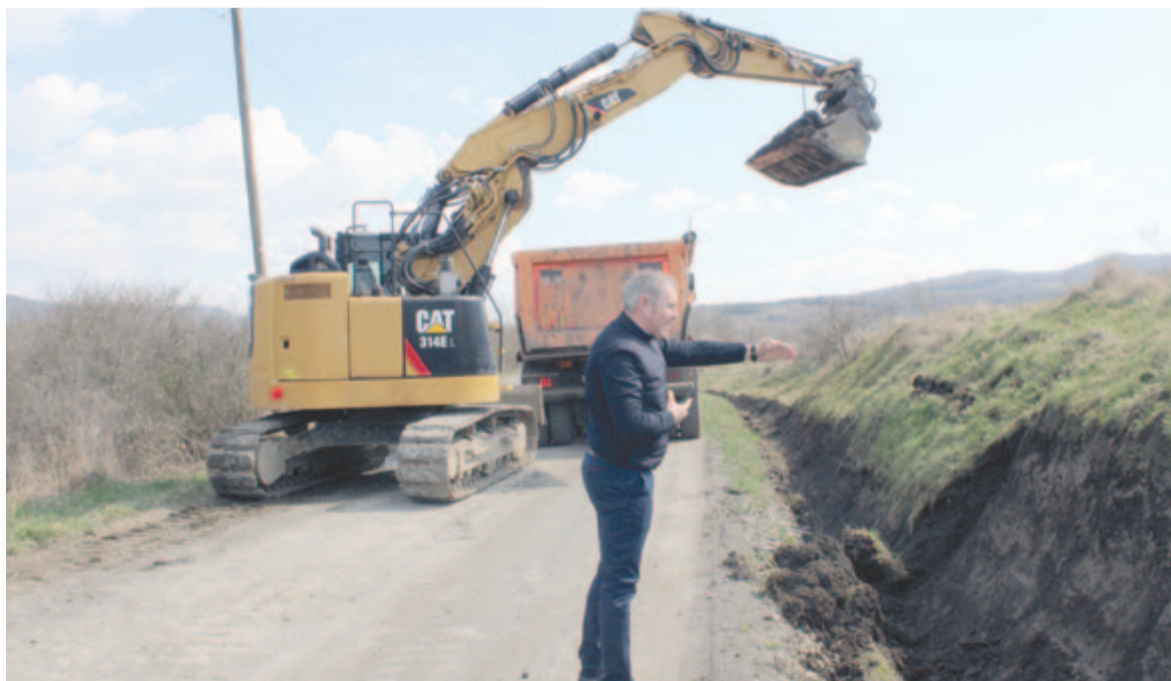
Aszfaltozzák a községi utat