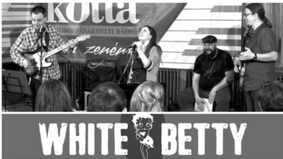
A White Betty zenekar a Marosvásárhelyi Rádió Kotta című műsorában