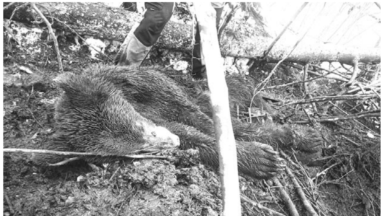
A hurokból kiszabadított elaltatott medve