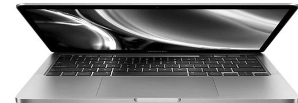
Az Apple számítógépeken új vírus terjed, illusztráció, MacBook

Az utóbbi időben egyre több ehhez hasonló kártékony programról lehet hallani mindegyik operációs rendszer esetében, talán ezek fogják arra sarkallni a felhasználókat, hogy ne használjanak kalózprogramokat, hanem vásárolják meg vagy fizessenek elő a hivatalos licencre.