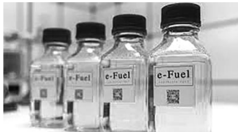
Szintetikus üzemanyag, illusztráció

Unióban. A szabály értelmében a következő évtized közepétől csak olyan autót lehetett volna újonnan eladni, amelyekben nincs belső