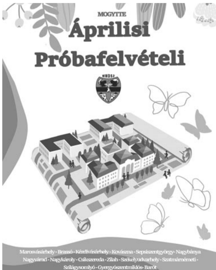
Az áprilisi próbafevételi plakátja

A szervezők ragaszkodnak ahhoz, hogy a diákok a helyszínen tegyék próbára a tudásukat, ezért nincs lehetőség online bejelentkezni. Azok a tanulók, akik nem az említett településeken élnek, elutazhatnak egy vizsgaközpontba, ahol kitölthetik a tesztet. A szervezők létrehozta egy Facebook-csoportot, ahol folyamatosan tartják a kapcsolatot az érdeklődőkkel, ennek a neve: MOGYTTE Felvételi 2023. Itt megtalálhatók a kapcsolattartó diákok elérhetőségei, akiket meg lehet keresni üzenettel vagy telefonhívással, ők pedig elmondják, hogy hol és mikor lesz a próbafevételi. A kapcsolattartó diákoknak a próbafevételihez vonatkozó kérdések mellett fel lehet tenni olyanokat is, amelyek a rendes felvételnél vagy az egyetemi élettel kapcsolatosak.