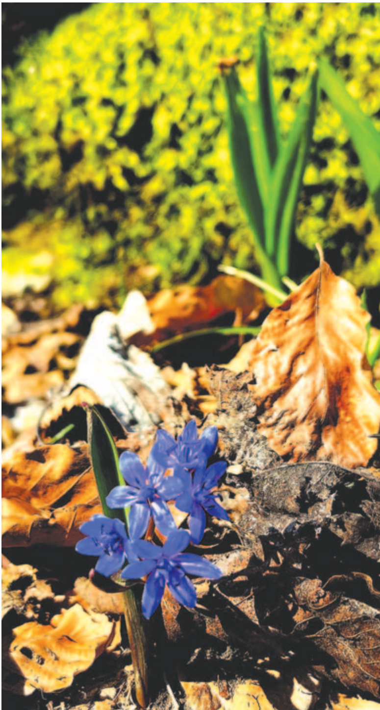
Csillagvirág – mint az égbolt nyáron, amikor tele van napsugárral

Kelt 2023-ban, amikor a Nap a Bika jegyébe lépett