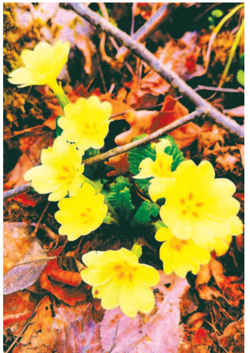
Kankalinok – a múlt nyáron meghalt virágok lelkei