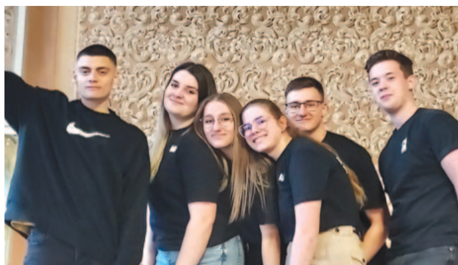
A Vármegyeház Órei