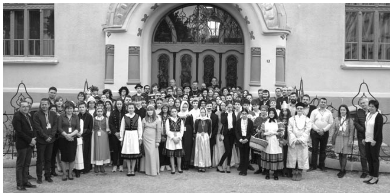
Az V. országos kisebbségtörténelem és hagyományai tantárgyverseny résztvevői és a szervező tanárok