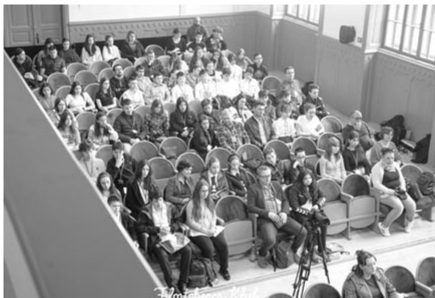
V. országos kisebbségtörténelem és hagyományai tantárgyverseny, megnyitóján csütörtökön

tőkön volt, ezt követte péntek délelőtt az írásbeli, majd délután a kis jelenetek bemutatása. Ez egy ritka országos tantárgyverseny, amely egyrészt két szakaszból áll, másrészt csapatverseny, vagyis két diák versenyez egy osztályból. A kis jeleneteknél a megadott történelmi időszakból ki kellett válasszanak egy tematikát, és a jelenetet négy perc alatt be kellett mutassák, magyarázta a Bolyai igazgatója. A jelenetek esetében sokat nyomott a latban, hogy milyen előadói képességei vannak az illető diákoknak, hiszen nem egyszerű kiállni a színpadra versenyzőtársak, szülők és tanárok elé, így inkább ezen, mintsem a konkrét történelmi tudáson volt a hangsúly a jeleneteknél. Ezután a központi bi-