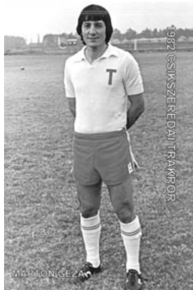
A Csikszeredai Traktor játékosa

„Amikor feljutottunk a B osztályba, az akkor mintegy 20 ezres város lakói egy hétig örömmámorban ünnepelték a sikert – idézi fel a korszakalkotó sportcélkitűzés megvalósítását. – Gyergyóból 1978-ban az akkori B osztályos Relonul Sävinești akart leigazolni, ahol a néhai Ráksi Gábor volt edző, azonban nem sikerült, mivel nem volt karácsonkői személyazonosságim.”