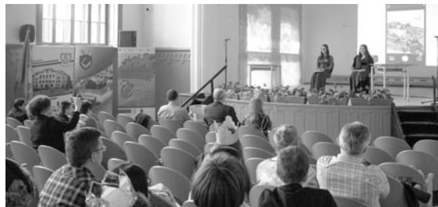
Kis jelenetek bemutatása a versenyen

A verseny megnyitóján csütörtökön volt, ezt követte péntek délelőtt az írásbeli, majd délután a kis jelenetek bemutatása.