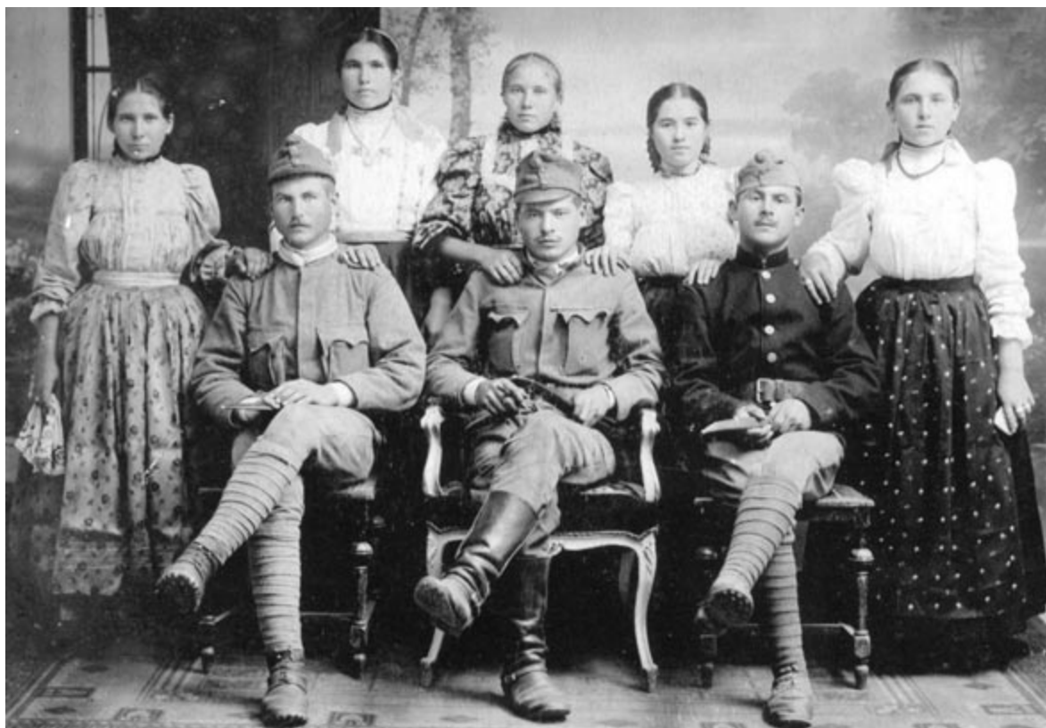
Délvidéki kutatás – Bukovinai család

Más alkalommal egy úgynevezett derek bundát ismerhettünk meg. E ruhadarabot korábban bőrből készítették, napjainkban pedig bársonyra hímkik; méreteit és motívumait is gondosan lejegyeztük.”