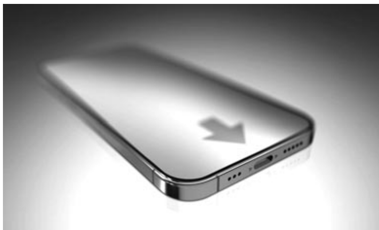
USB C csatlakozóval szerelt iPhone, koncepció