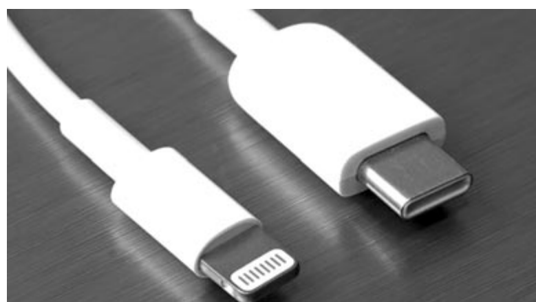
Lightning vs. USB C, illusztráció

Összegezve: a tavaly ősszel elfogadott jogszabály előírja, hogy vezeték nélküli töltéssel rendelkező készülékek esetében kötelező lesz az USB C port használata. A törvény 2024 végén lép életbe, viszont a hírek szerint az Apple már az idén debütáló iPhone 15 szériát ezzel a csatlakozóval szereli fel. Igaz, azzal kapcsolatban is voltak hírek, hogy csak korlátozásokkal fogja támogatni az új szabványt, és éppen ezt akarja megelőzni az Európai Bizott-