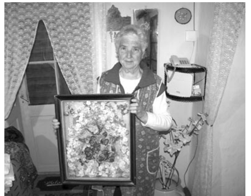
Délvidéki kutatás – Hertelendyfalva, menyasszonyi koszorú