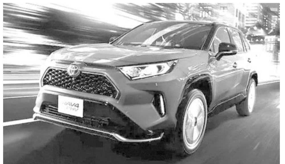
Toyota RAV4 plug.in (konnektoros) hibrid

A rekordkísérletben 55 sofőr vett részt, fel-