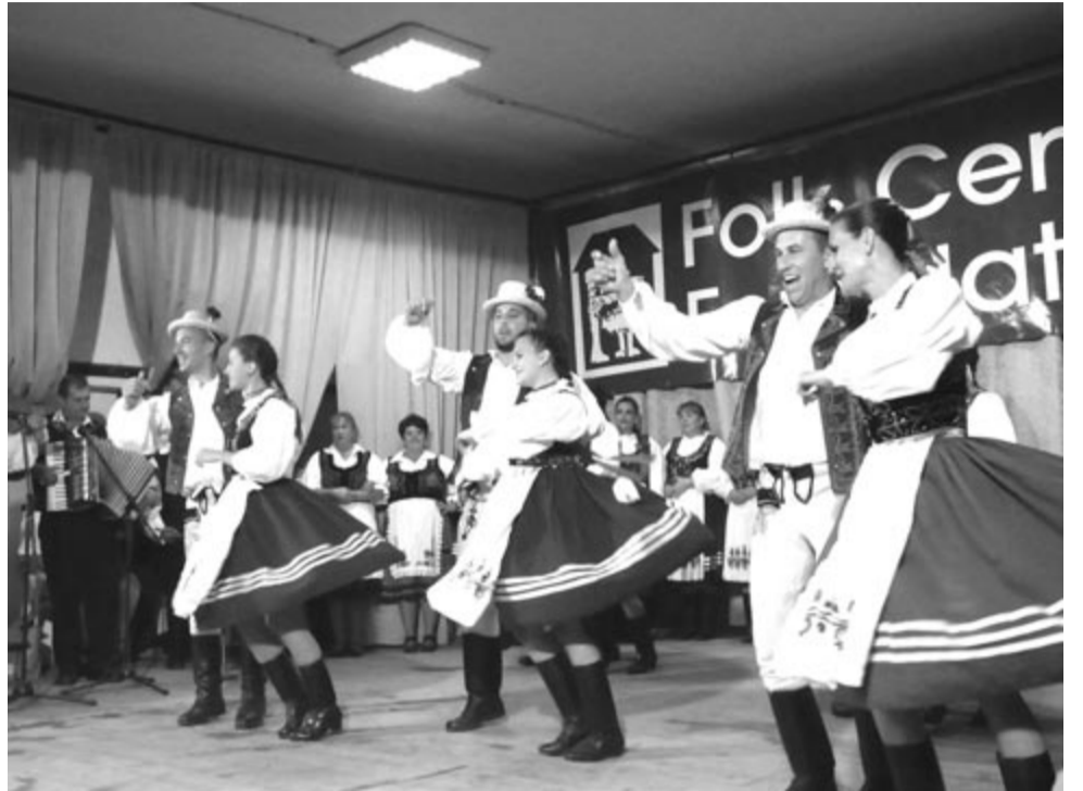
Immár huszonötödik éve szól a népzene, ropják a néptáncot egy héten át Jobbágytelkén

A tábor egyszerű lehetőség arra, hogy fesztői, békés környezetben a vendég megismerje és elsajátítsa a páratlan szépségű, gazdag maroszei ének-, zene-, tánc-, kézműves- és szokásvilágot, amely szerves része a világörökségnek és ezen belül a magyar kultúrának. Gazdag programok, színvonalas szolgáltatások, neves oktatók, zenészek, előadók, meghívottak gondoskodnak az ide látogató