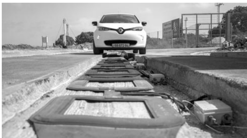
Úttestbe épített töltőrendszer

amely képes gyorsabban, nagyobb mennyiségben felvenni az áramot vezeték nélküli módon az úttestbe épített rendszerből. Na meg persze az is, hogy az utóbb említett rendszer is képes legyen a gyorsabb és erősebb átadásra. Azonban ez minden bizonnyal csak idő kérdése. A telefonoknál vagy az elektromos fogkeféknél is létezik a vezeték nélküli töltés, ami az elmúlt években sebességét tekintve rengeteget fejlődött. Ez is mutatja, hogy potenciál van a technológiában, csak még idő kell ahhoz, hogy teljesen kiforadjon. Nem mellesleg lépések már vannak ebbe az irányba, ezt mutatja az is, hogy március folyamán az Electreon, a Toyota és a DENSO együttműködési szerződést kötött. Továbbá az izraeli cég svéd, francia és belga vállalatokkal kísérleti programok indításán is dolgozik, valamint tavaly decemberben Németországban kötöttek egy 3,2 millió euró értékű megállapodást elektromos autóbuszok üzemeltetésére.