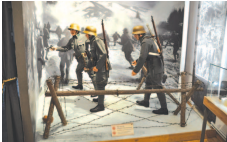
Székely Határőr Emlékközpont Szépvízen

használni. Elég lenne mondjuk öt turizmustípust, amelyek közül korábban néhányat említettem, és ezek mögé beállnának a szállásadók és a különböző civil szereplők is. Együttműködés nélkül csak helyben állunk. Ha felismerjük, hogy egymásra vagyunk utalva, és csak egymást segítve léphetünk előre, akkor jobban fel lehetne lendíteni Székelyföldön a turizmust. Gondoljuk csak el: hiába van egy fantasztikus szálláshely, ha jön a vendég, és nem tud mást csinálni, mint azt, hogy bámulja az ablakból a szemközti hegycsúcsot, nincs, aki odáig és vissza biztonságosan elvezesse, vagy alternatív szabadidő-eltöltési lehetőséget kínáljon egy adott üdülőtelenen.