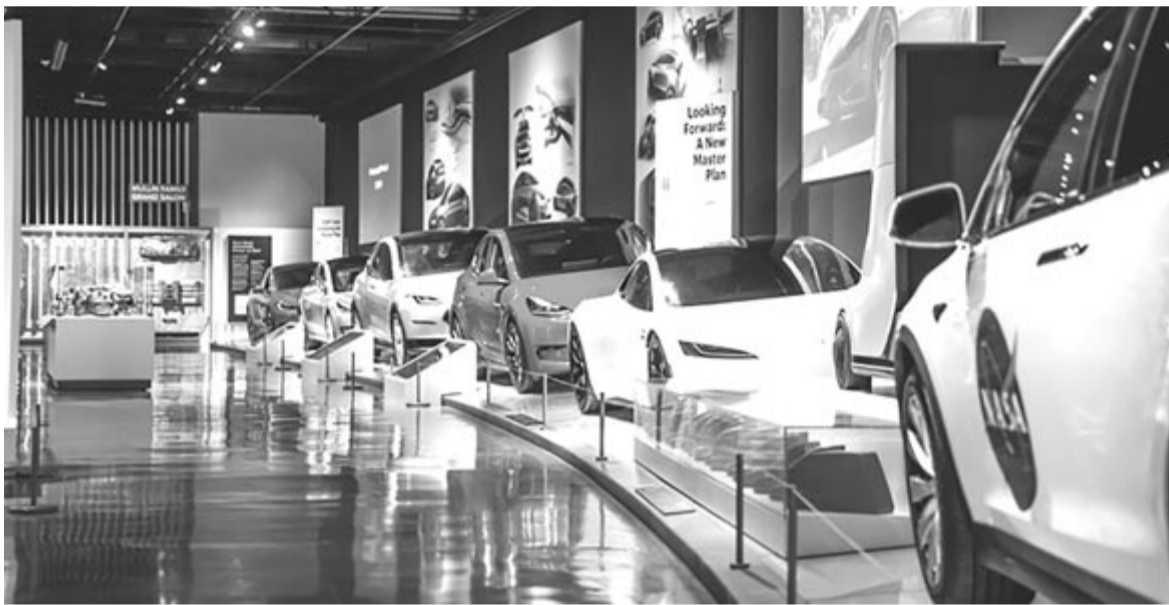
Tesla – illusztráció

tak, illetve olyan belső információk, mint 100.000 alkalmazott fizetése vagy éppen Elon Musk társadalombiztosítási száma. A Handelsblatt szerint az adatokat mindenféle biztonsági intézkedés nélkül, a GDPR adatvédelmi szabályozás megsértésével tárolták.