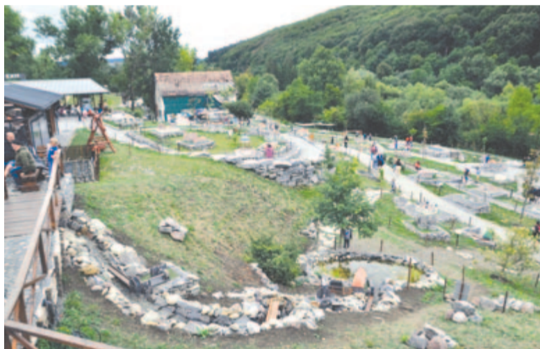
A székelyudvarhelyi Mini Erdély Park

– Nagyon sok pozitív visszajelzést kaptunk a rendezvényről, de csak akkor folytatjuk, ha látjuk, hogy az ennek a találkozóknak konkrét eredményei lesznek. Az lenne a legjobb, ha sikerülne összehozni a stratégiaíró műhelycsoportot, de ez nem csak tőlünk, az akadémiai szféra képviselőitől függ.