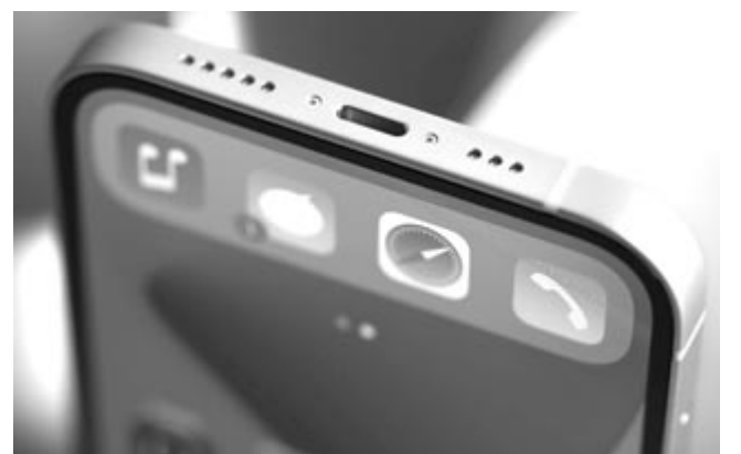
iPhone USB-C porttal szerelve, koncepció

Erre viszont még kell várni pár évet. Addig is marad az USB-C, aminek egészen biztosan sok felhasználó fog örvendeni, hiszen sokkal nagyobb szabadságot tesz lehetővé.