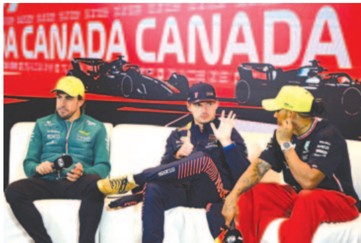
Hamilton (j1): Hányat nyertél az idén, Max? Verstappen (k): (mutatja).

* csapatok: 1. Red Bull 321 pont, 2. Mercedes 167, 3. Aston Martin 154, 4. Ferrari 122, 5. Alpine 44, 6. McLaren 17, 7. Alfa Romeo 9, 8. Haas 8, 9. Williams 7, 10. Alpha Tauri 2