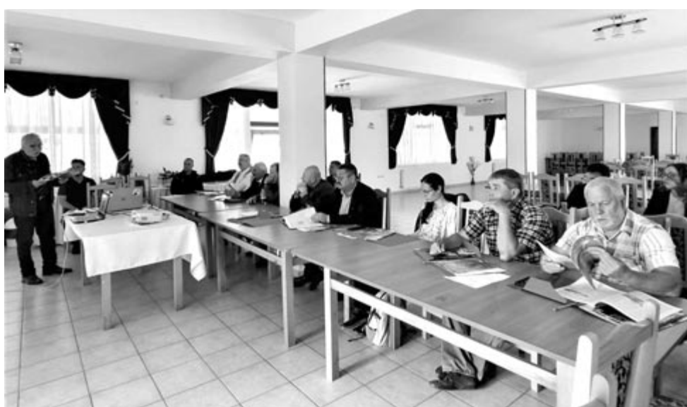
A találkozó célja a külföldi jó példák és a nyárádmenti kezdeményezések bemutatása, a fenntartható csapadékvíz-gazdálkodás népszerűsítése volt