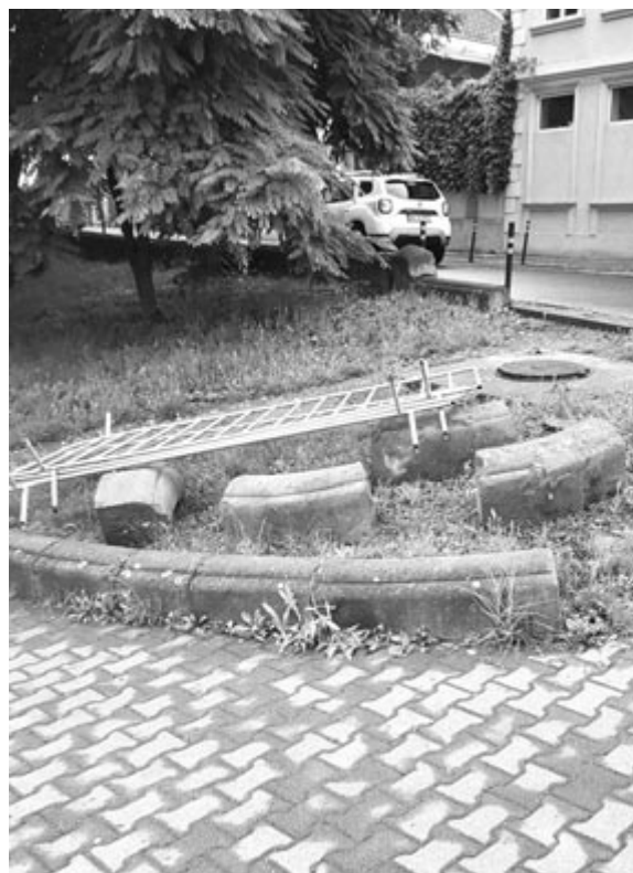
Fotó: Marosvásárhelyi Állatkert (v.g.)

ték. Előfordulhat, hogy még több szegletkővet találnak majd. A polgármesteri hivatal szándéka, hogy a jelenleg zajló terefelújítások során a történelmi központban korábbi helyükre tegyék vissza a több mint 100 éves térköveket.