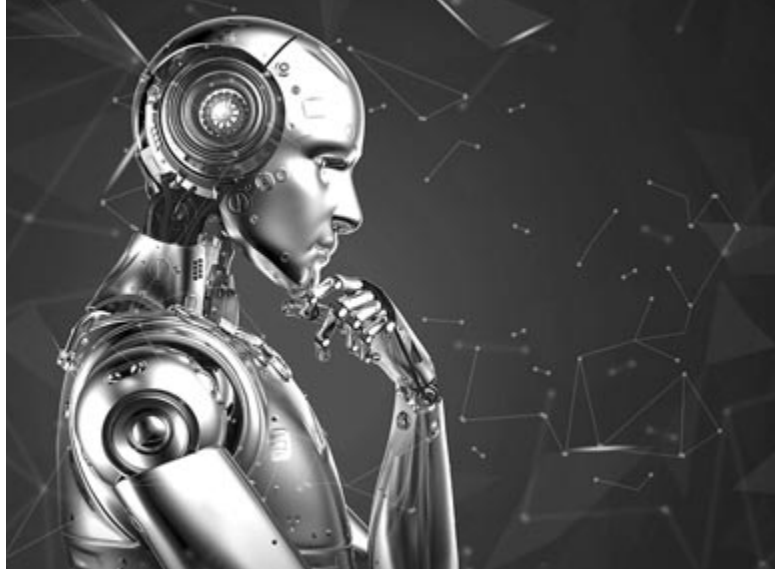
Gondolkodó robot, illusztráció

Visszatérve a globális történelemre, Sam Altman megjegyzéseit megelőzte az a lépés, hogy a kutatók és a technológiai vezetők egy csoportja – köztük Elon Musk és Steve Wozniak – a GPT-4-nél nagyobb teljesítményű MI-rendszerek szüneteltetésére tett felszólítást, mondván, hogy a megfelelő biztonsági korlátozások nélkül fennáll az elszabadulás kockázata. Nem ad okot a bizakodásra az sem, hogy Geoffrey Hinton, akit a mesterséges intelligencia keresztapjaként is számontartanak, május folyamán felmondott a Google-nél. Elmondása szerint azért, hogy szabadon megoszthassa aggodalmait azzal a technológiával kapcsolatban, amelynek megalkotásában ő maga is részt vett, és amely – véleménye szerint – komoly károkat okozhat a világnak.