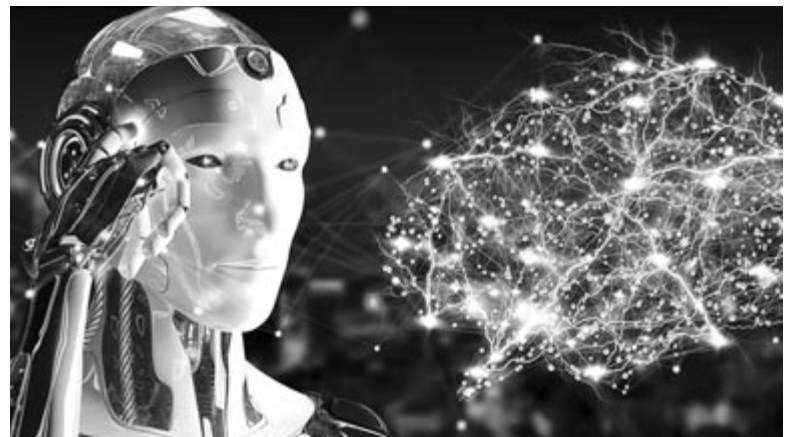
Mesterséges intelligencia, illusztráció

Viszont nem lehet elmenni azon tény mellett, hogy bár eddig bejött az Apple kivárási stratégiája, a jelenlegi gyorsan fejlődő MI-technológiából való kimaradással azt kockáztatja, hogy messze lemarad a konkurencia mögött, ugyanúgy, ahogy lemaradt az okoshangszóró kategóriában, hiszen a HomePod csak évekkkel az Amazon Echo és a Google Home után jelent meg, ennek eredményeképpen már nem tudott olyan mértékben betörni a pi-