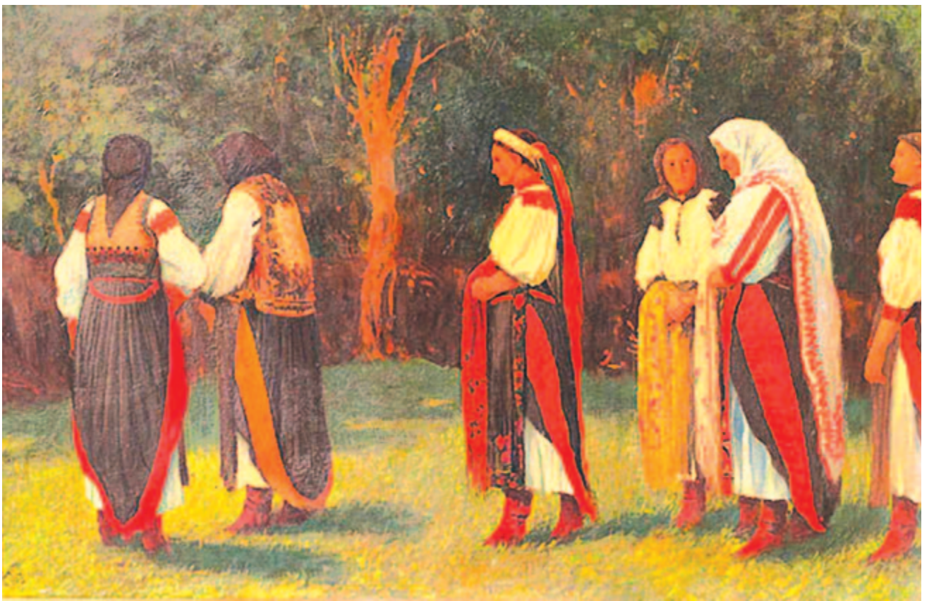
Körösfői-Kriesch Aladár – Kalotaszegi templomba menők – Betöltsem kis világom jószándékkal és fénnel

Ezeknek az ábrázolási módoknak a felnőttvilágban valóban nagy hagyománya van. Már az óegyiptomiak ábrázoltak virágot hintő napot; a szibériai népek és az amerikai eszkimók körében a „madárzó” nap képe közhelyszámba megy. Úgy tűnik tehát, hogy e képalkotási készség belülről jön. Az antropomorfizációval a gyerek – mítoszteremtő őseinkhez hasonlóan – mindent, ami mozog, hat, élőlénynek, főleg embernek képzel, így természetesen a napot is.