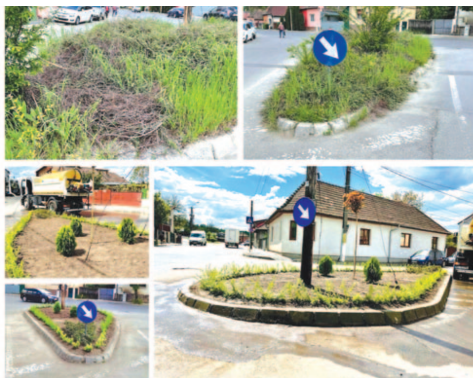
A fotókon a felújítás előtti és utáni állapot látható