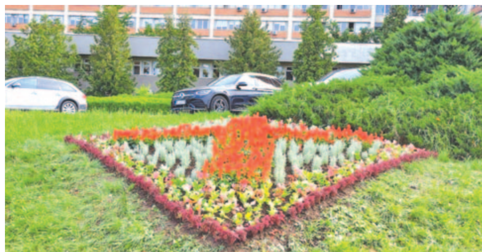
A Megyei Sürgősségi Kórház előtti park