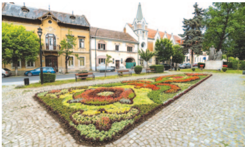
A Bolyai téri park