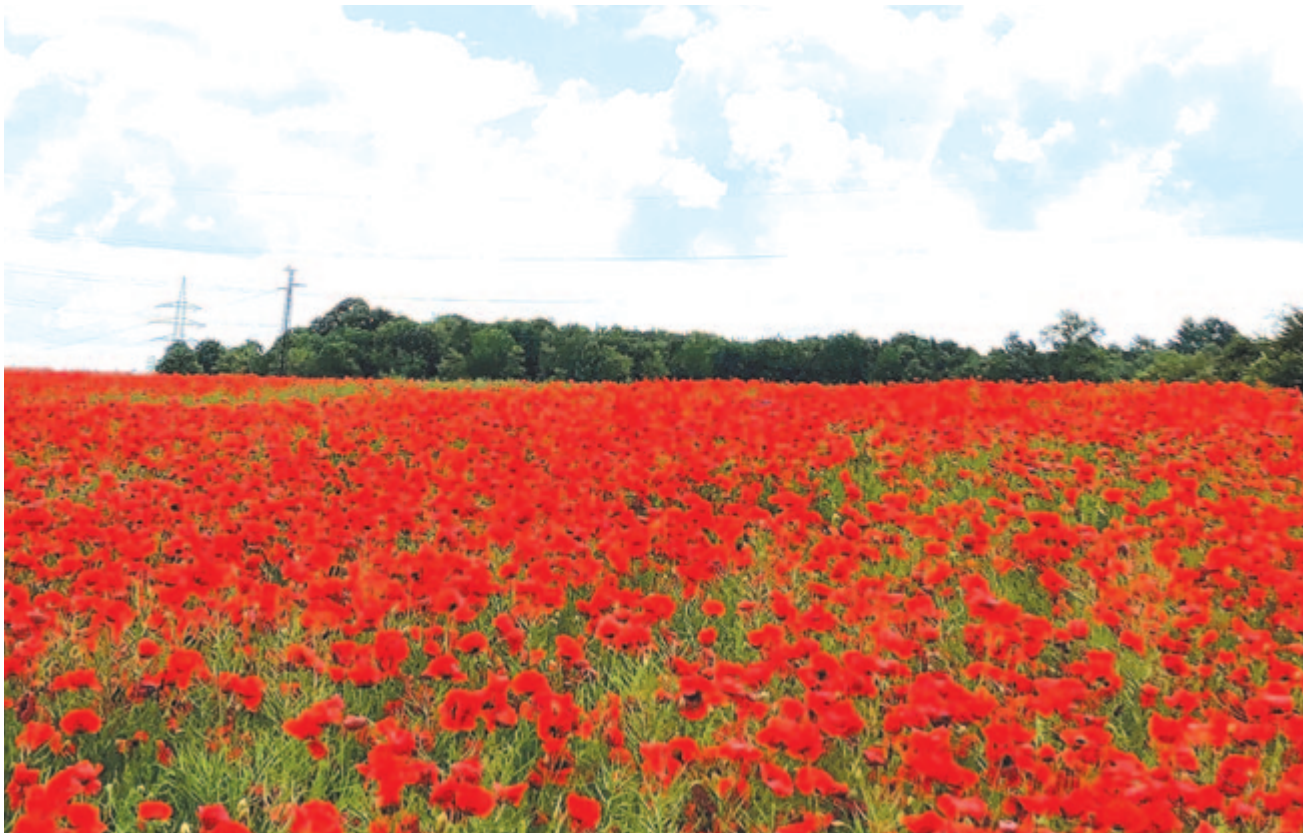
Pipacsmező – muzsika – felhők húznak el felettem

Kelt 2023-ban, június 23-án, Zoltán napján