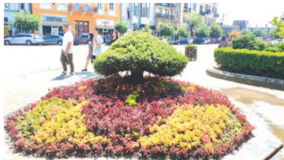
A Megyei Tanács előtti tér