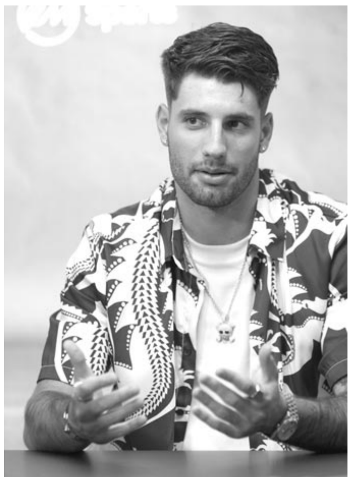
Szoboszlai Dominik labdarúgó az EM Sports menedzserirodájában tartott sajtótájékoztatóján 2023. július 4-én. A magyar labdarúgó-válogatott csapatkapitánya az RB Lipcsétől a Liverpool FC-hez igazolt.

„Akkor csak a pályára mentem ki, most viszont a csapat tagjaként az egész komplexumot meg tudtam nézni, a várost is. Más érzés volt, de jól éreztem magam. Az akadémián nagyszerű körülmények között dolgozhatunk majd, a stadiont pedig senkinek nem kell bemutatni, mindenki ismeri” – nyilatkozta Szoboszlai Dominik, aki vasárnap írta alá öt évre szóló szerződését a nagy múltú angol klubbal.