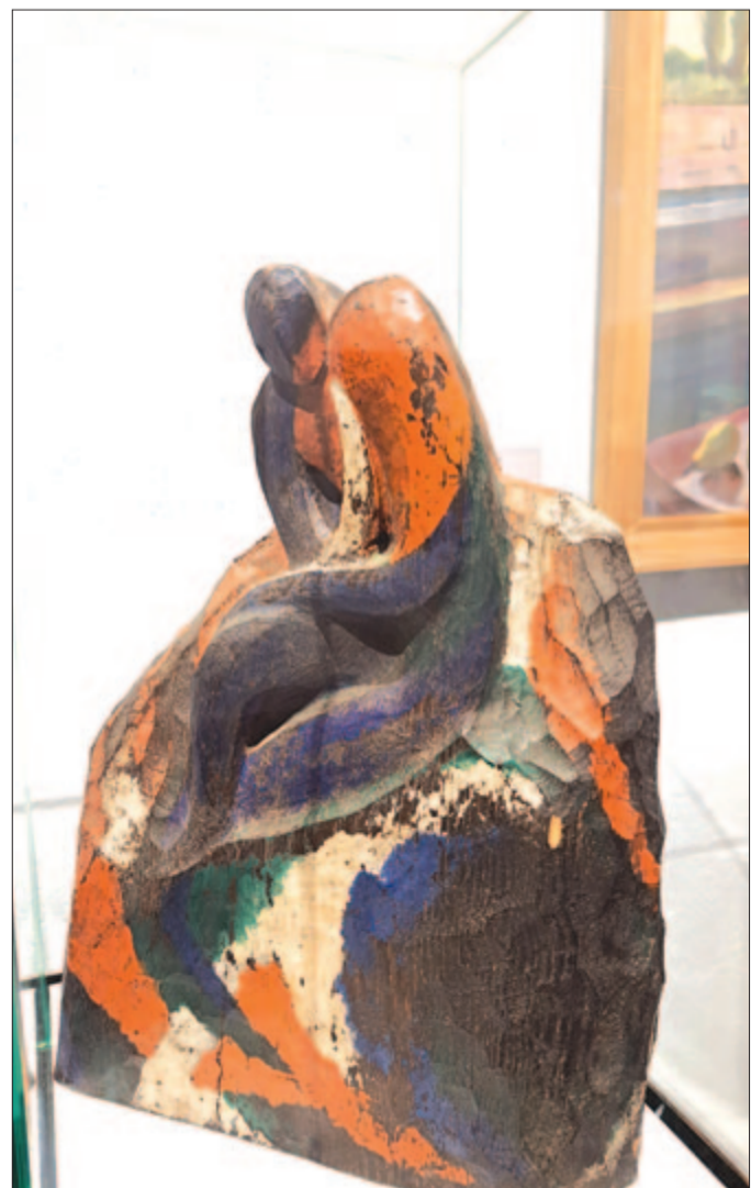
Mattis Teutsch János szobra