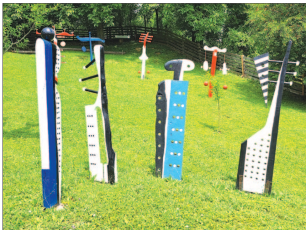
A szarvasokká vált fiúk

tennivalók is egész embert kívánnak, a galériának pedig állandóan látogatásra készen kell állniuk. Az egy évtizede avatott Kakasülő nyolc nagy, csoportos kiállítást látott vendégül, és persze a saját válogatásait is. A világvjárvány idején két beütemezett tárlat elmaradt. Becslésük szerint több mint ötezen voltak kíváncsiak a galéria kínálatára. Hatvanhét festő, szobrász, díszítőművész állított ki náluk, a bemutatott anyagot a megnyitókön nyolc művészettörténész méltatta. Igényes katalógusok is készültek az eseményekre. A Művészek Atyhai Társasága különleges figyelmet fordít arra, hogy mindaz, amit közönség elé visznek, a lehető legjobb minőséget képviselje. A kiállítók számára ajánlott tematikát is nagy körültekintéssel választják ki. Helyi és egyetemes kérdésköröket igyekeznek visszatükrözni. Az eddigiiek a Csörgő, a Kereszt, az Élet/Tér, a Vonzások, az Arány, a Jel és aktuálisan a már említett Fény hívószóval szólították meg a résztvevőket. A kortárs művészet legjobbjai kaptak lehetőséget a bemutatkozásra, idősebbek és fiatalok, hagyományörzők és újító szelle-