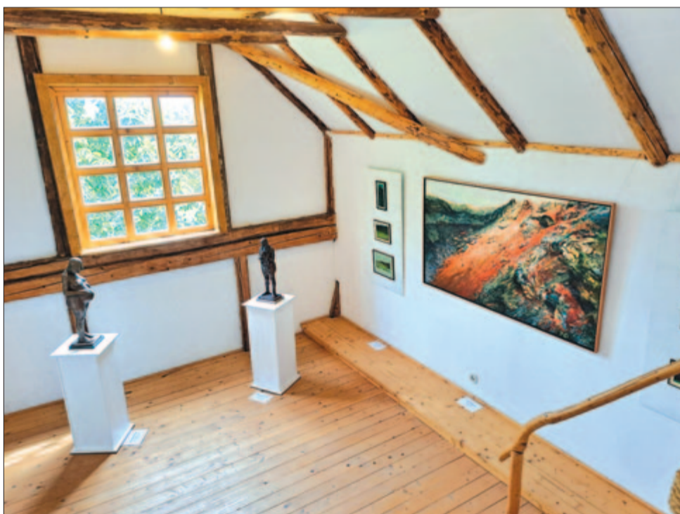
Részlet a Kakasülő Galériából... A nagy festmény Kuti Botond Saltus című alkotása, a két szobor Bocskay Vince plasztikája