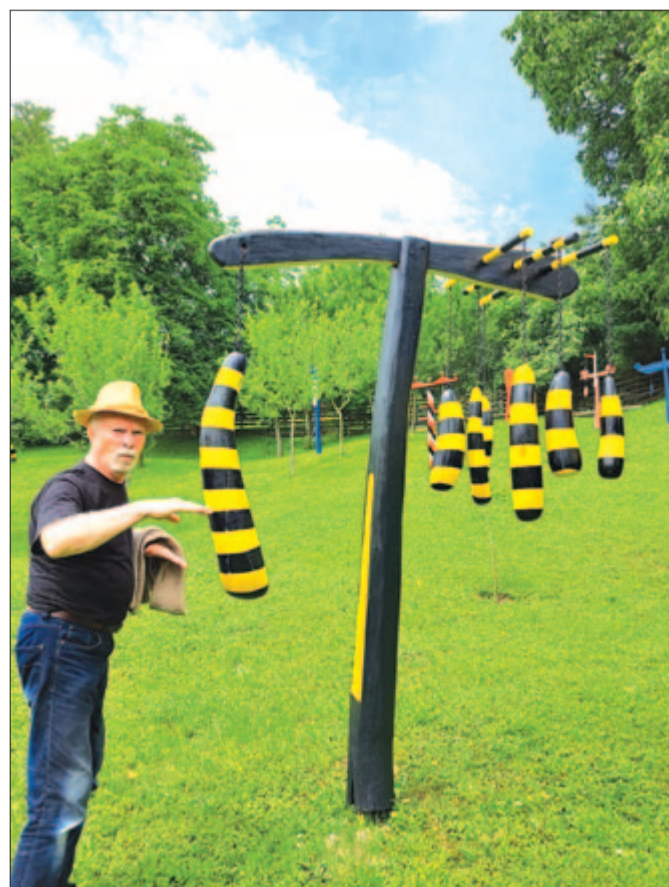
Egyensúlyban... A szobrász és installációja