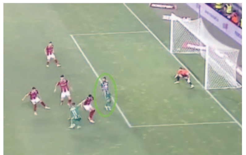
A lövés pillanata a televíziós közvetítésből kimerevített felvételen