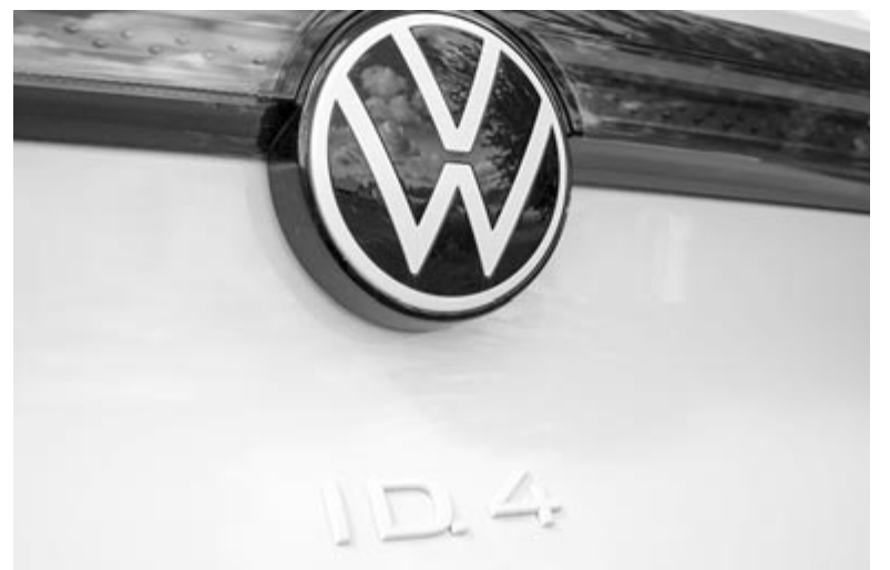
Volkswagen ID.4 – illusztráció

A Volkswagen szóvivője szerint azért torpant meg a kereslet, mert számos országban csökkentették vagy teljesen kivették az elektromos autókra járó állami támogatást, ami eddig meghatározó szerepet játszott abban, hogy a vásárlók áttértek a tisztán villanymeghajtásra. Csak az idén például Németország, Svédország és Franciaország teljesen megszüntette a támogatást. A három országban – a fejlettségi és gazdasági szinten túl – közös, hogy komolyan vették az átállást, és hatalmas felvevőpiacai voltak a villanymotornak. Ezzel magyarázza az autópia óriás, hogy csökkennek az eladásai, és a magyarázat elfogadható is lehetne, csak hogy más gyár-