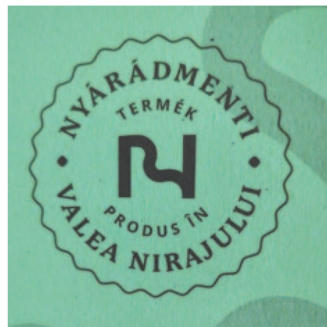
Hamarosan használható lesz a márkanév, de szigorú feltételekkel