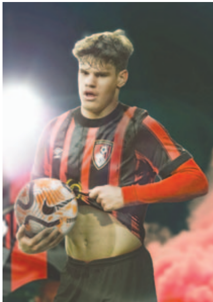
Ezzel a felvétellel illusztrálta Fabrizio Romano transzferguru a közösségi oldalán Kerkez átigazolását híre

ség hosszú távú Kerkez és a Bournemouth között, a klub pedig összesen 15,5 millió fontért szerzi meg a szélső hátvédet.