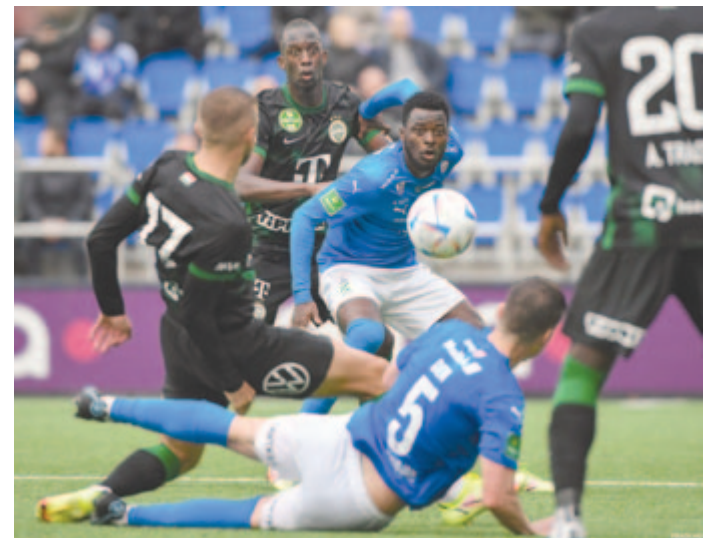
Csata a labdáért a 0-0-ra zárult első mérkőzésen