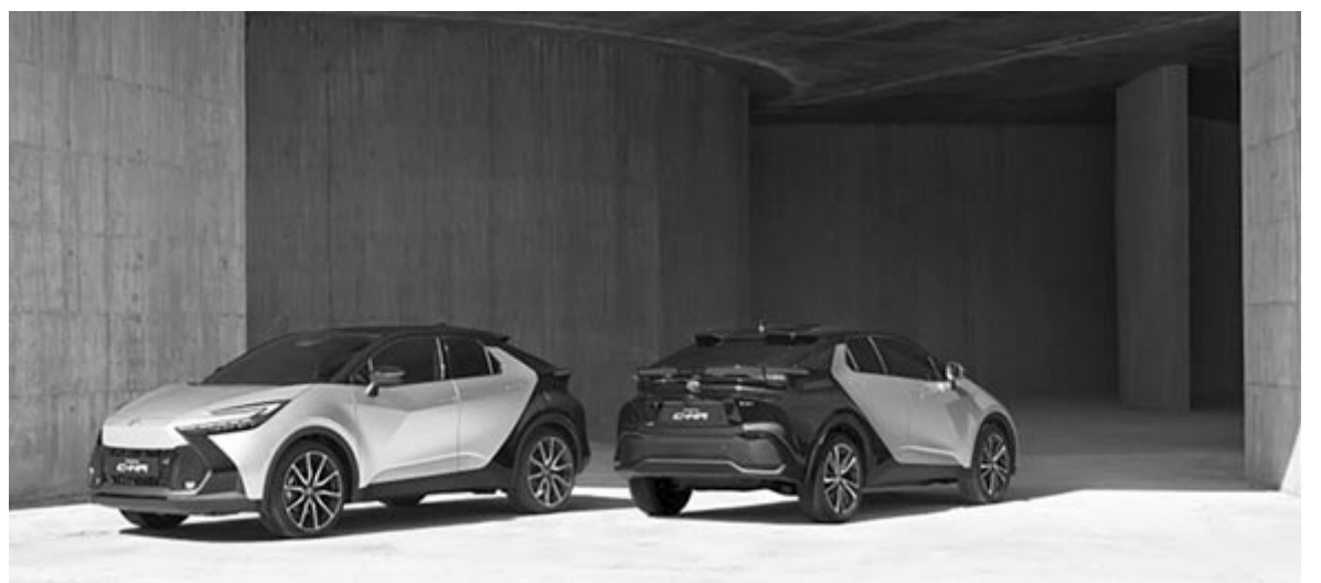
Második generációs Toyota C-HR, a megvalósult konceptióautó