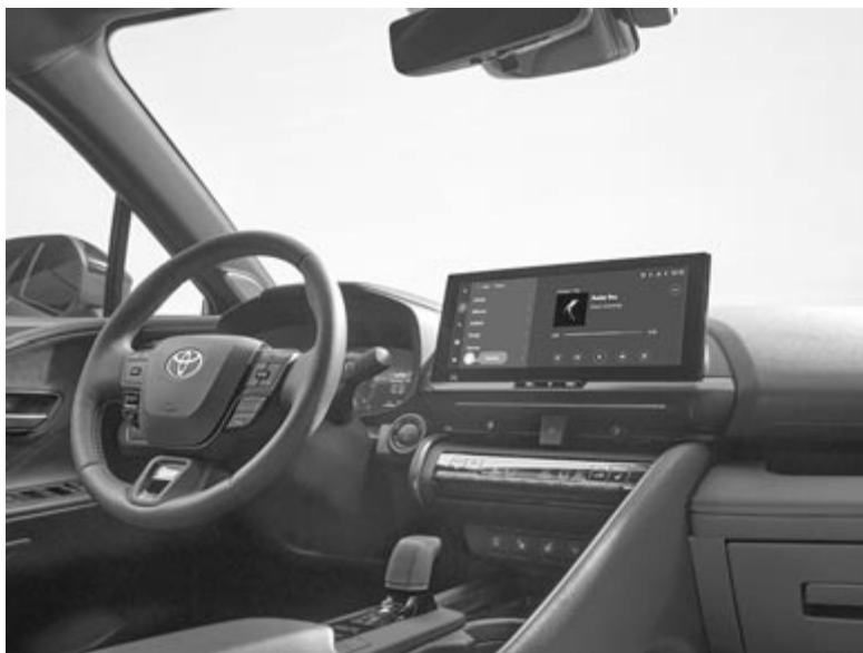
A második generációs C-HR belseje

A japán autóóriásnak ez a második modellje, amely az úgynevezett Hammerhead, vagyis pörölycápa formatervet kapta meg, mellette az újnak számító, ötödik generációs Prius kapott hasonló designjegyeket. Amennyiben valaki egymás mellé állítja a két autót, nem kell keresse a hasonlóságokat, szemmel láthatók az egyforma részletek, különösen a hűtőmaszk és az első lámpák környékén. Azonban van az új C-HR-nek egy újdonsága is, amit eddig Toyotákon nem láthattunk: hátul besimuló kilincseket kapott. Ez a megoldás a Teslánál nagy divat, és egyre inkább használják a német márkák is. Az amerikai villanymotorgyártónál az első generációs kilincsekkel számos probléma volt, nem nyíltak ki, télen sokszor