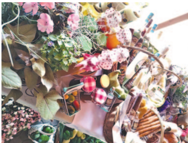
A nyáradmenti termékek piaca jutását segíti az új védjegy

A nyáradmenti gazdákat, kistermelőket fogja tömöríteni a Nyáradmenti Termék márkanév és a hozzá társított grafikai elem. Ez a vidék a megye éléskamrája, a lakosság fele mezőgazdasággal foglalkozik, a vidék alsó és középső része élelmiszer-alapanyagairól ismert, a nyers vagy már feldolgozott termékek jelen vannak a piacokon, de már az üzletekben is. Ezeket a termelőket és termékeiket szeretné összefogva bejuttatni a marosvásárhelyi, és egyáltalán a hazai piacra a kistérségi társulás, amely európai fejlesztési alapokból hívott le pályázati támogatást az országos vidékfejlesztési program (PNDR) révén. A 100 ezer eurós projektből tíz százalékat a szervezet biztosított –