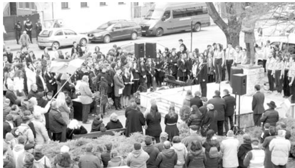
Megemlékezés a Petőfi-szobornál 2023 márciusában