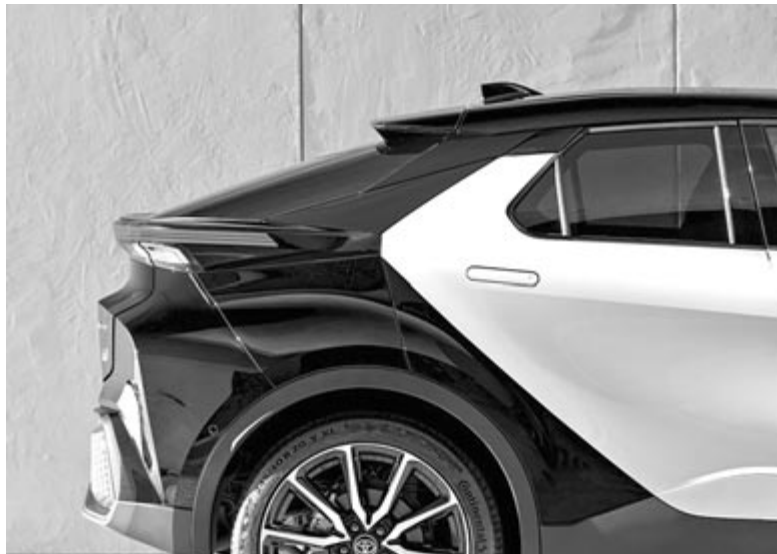
Az új C-HR besimuló hátsó kilincsei

A Toyota ígérete szerint még ebben a hónapban megrendelhető lesz az Európában fejlesztett és az európai igényeket kielégítő C-szegmensbe tartozó SUV. Árat egyelőre nem közöltek, és lapzártánkig csupán a régi változat volt elérhető a honlapjukon. A második generációs C-HR indulóáráról még nem tudni semmit, de az első generáció Romániában 31.019 euróról indul, biztosan lehetünk abban, hogy az új ennél csak drágább lehet.