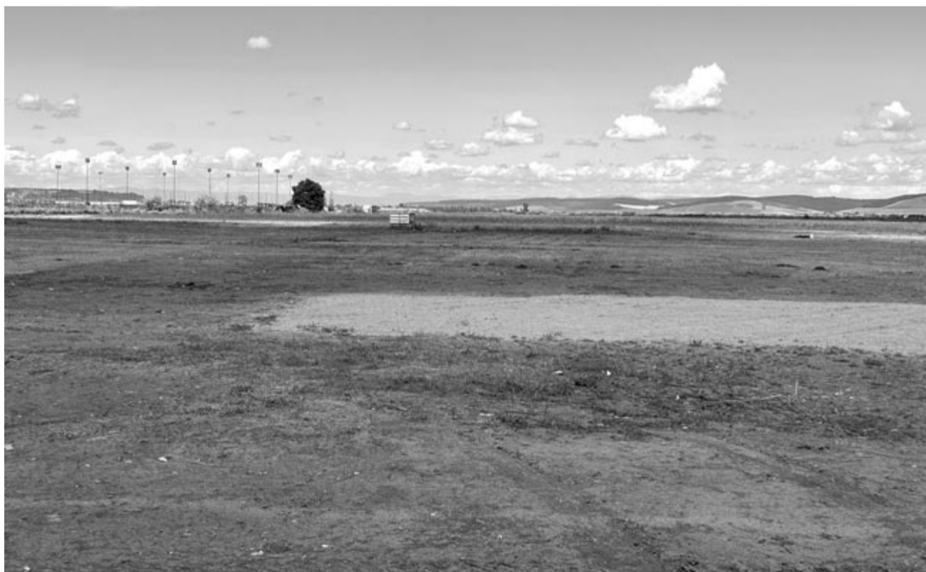
A bontási munkálatokat is elvégezték

Jövőben pedig ismét lesz Vibe, július 4–7. között, a Maros-parton. Azt még nem tudni, hogy mi lesz a sorsa, miután megkezdí a működését a közelben levő onkológiai kórház, viszont a szervezők, saját bevallásuk szerint, már gondolkodnak a stratégiákon, mert a Maros-partról, az eredeti helyszínről semmiképpen nem akarnak lemondani.