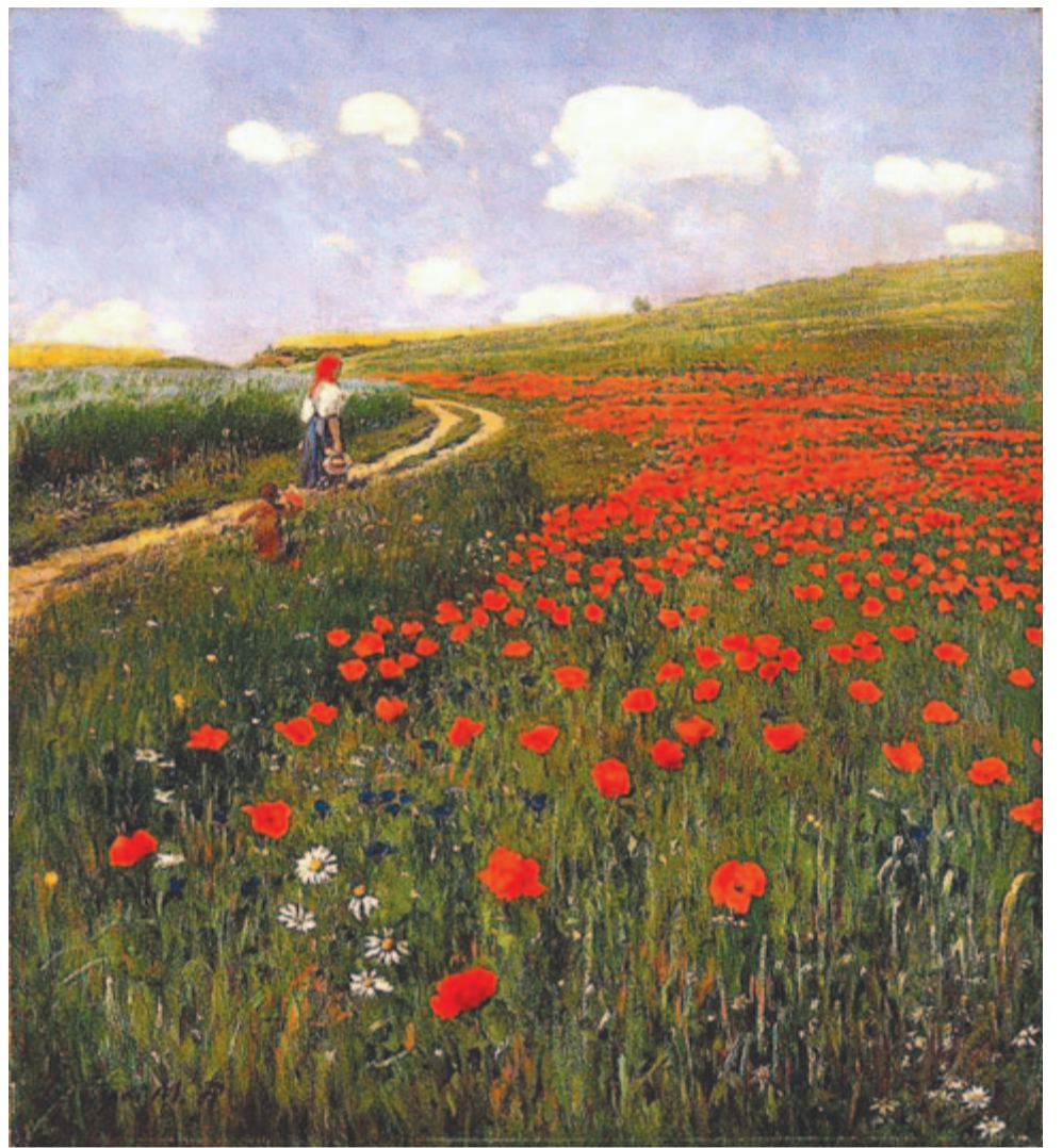
Szinyei Merse Pál: Pipacsos táj – Piros pipacsok és kék virágok

1848 júniusában, Pesten, amikor Az apostolt megírta, vetette papírra Petőfi Sándor