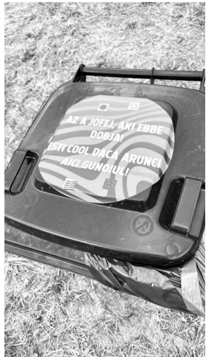
Kétnyelvűség és barátságos feliratok a Vibe Fesztivál ötödik kiadásán