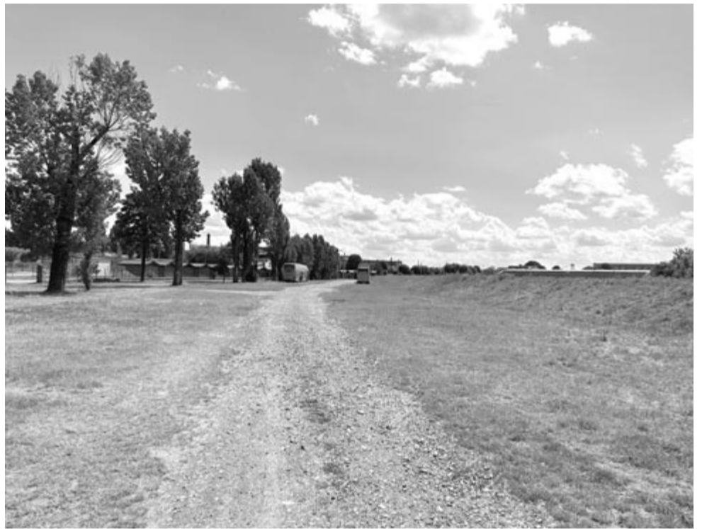
Egy héttel a fesztivál kezdete után teljesen tiszta a Maros-part

Az az állítás sem igaz, hogy a Vibe-on csak erősen ittas – hogy szépen fogalmazzunk – személyek tántorogtak a rosszabbnál rosszabb zenékre. Elsősorban a szervezők ide is figyelmet fordítottak a fesztivál tudásbázisára, a Vibe Kolira, amely a Vikendtelepen kapott helyet, ide bárki ingyenesen ellátogathatott és részt vehetett az előadásokon, workshopokon. Többek között az oktatásról, a digitális megoldásokról, a politikai és gazdasági helyzetről, a sportról, a pszichológiáról is hallgathattak előadásokat az érdeklődők, valamint hennakészítési és slam poetry workshopon is részt vehettek. A Koli teljes kínálatát szinte lehetetlen lenne felsorolni, hiszen három sátorban zajlottak egyszerre a beszélgetések és workshopok, de emellett a Babeş–Bolyai Tudományegyetemnek és a Sapientia Erdélyi Magyar Tudományegyetemnek is volt kiállított sátra. Annak ellenére, hogy az események délelőtt kezdődtek, ami egy átbulizott éjszaka után egyenesen hajnali időpontnak számít, voltak, akiket sem a meleg, sem a bulihelyszíntől való több mint 500 méteres távolság nem riasztott el attól, hogy a szórakozás mellett az ismereteiket is bővítsék. Másrészt pedig, ami a zenét illeti, mindenkinek engedték meg, hogy azt tartsa jó zenének, ami neki tetszik.