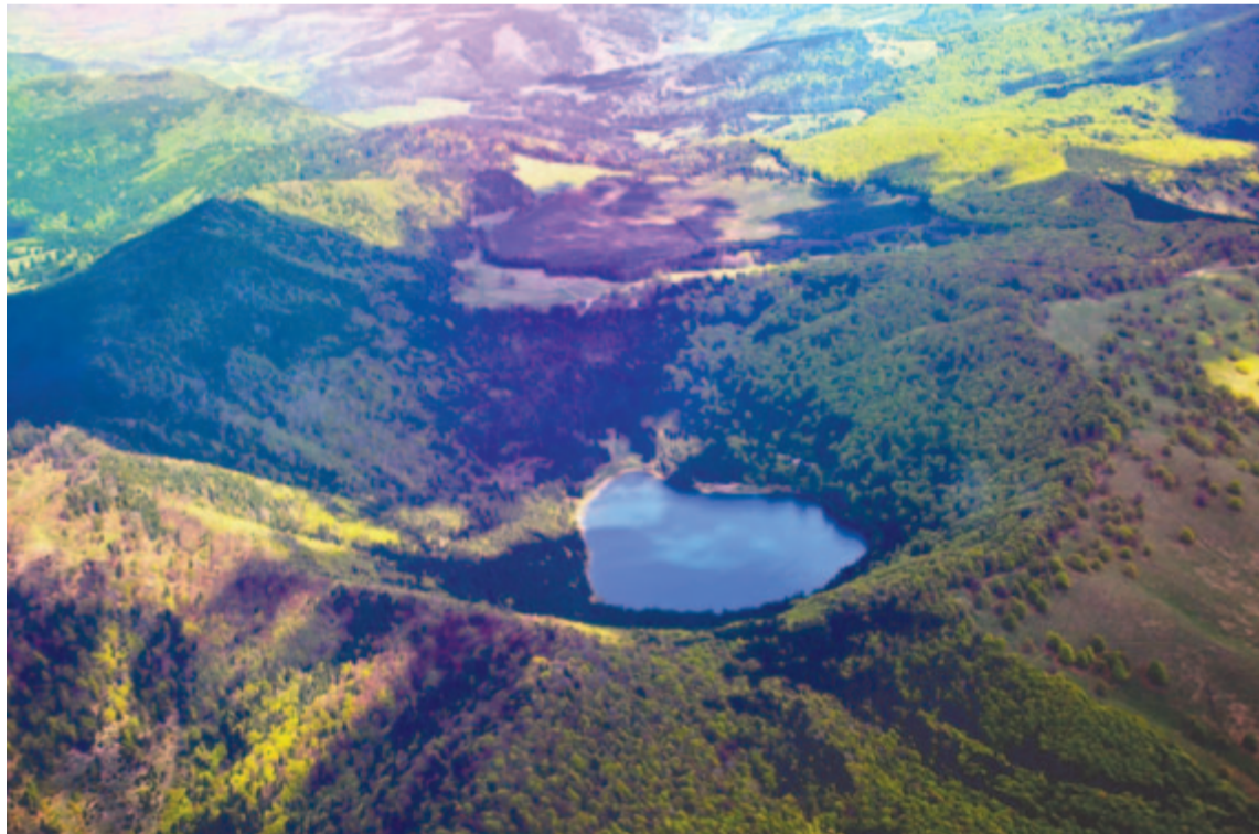
Szent Anna-tó – Sötét rámában ércvilágú vízláp

Maradok kiváló tisztelettel. Kelt 2023-ban, 567 évvel azután, hogy a keresztény világban délben megszólalnak a harangok