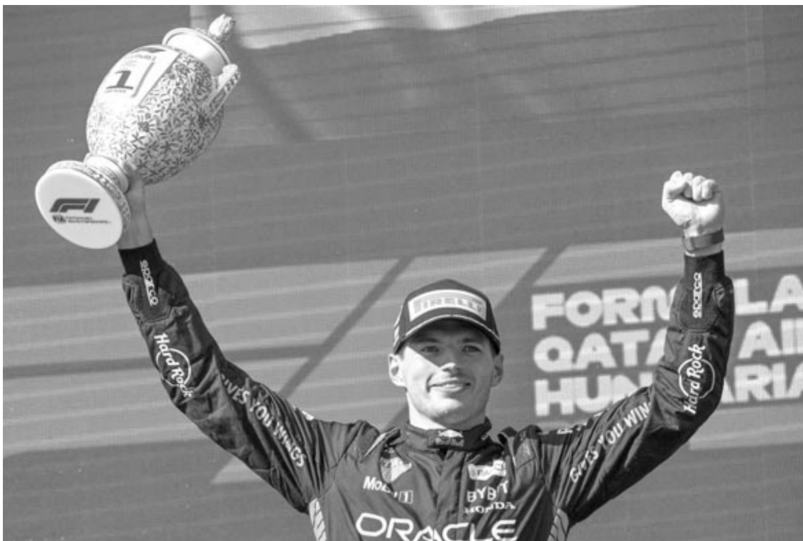
A Red Bull holland versenyzője, Max Verstappen a Forma-1-es Magyar Nagydíj győztesének járó serleggel a mogyoródi Hungaroringen 2023. július 23-án

„Nem ez a legnagyobb pálya, de imádok itt vezetni, kicsit olyan, mintha gokartokkal versenyez-