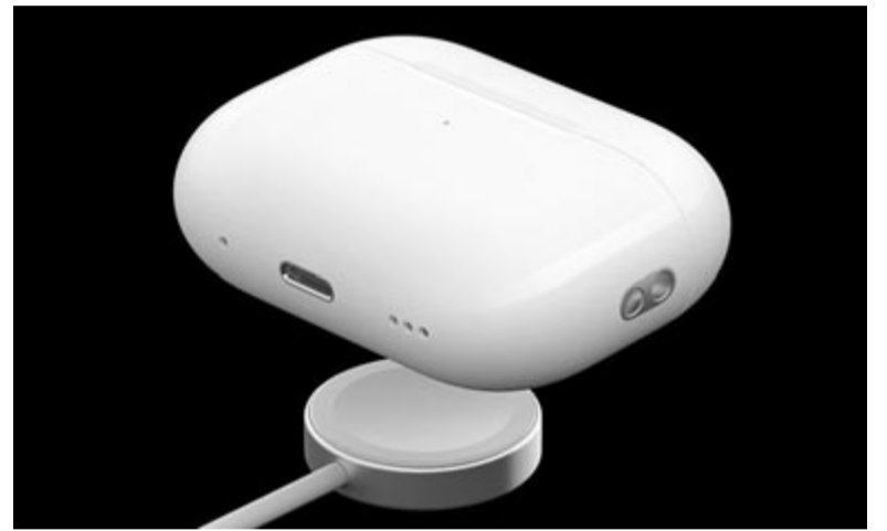
AirPods Pro 2, vezeték nélküli töltés, illusztráció

Arról, hogy az AirPods Pro második generációját is felfrissítik, és megkapja az USB-C csatlakozót, az első pletykák tavasszal röppentek fel, akkoriban még nem lehetett tudni, hogy a vezeték nélküli fülhallgató kap-e valamilyen más, hardveres változ-