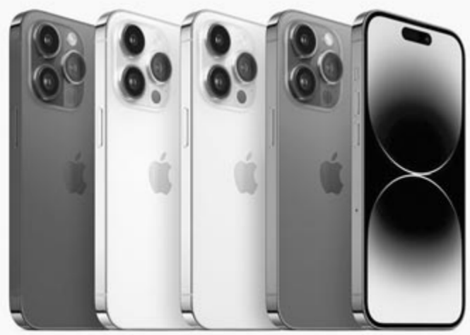
iPhone 14 Pro

rázni, hogy esetlegesen miért fog megnőni az iPhone-ok alaptárhelye, az igazság az, hogy az Apple egyszerűen csak még több pénzt akar kivenni a vásárlói zsebéből. Ez a trend mindig is megvolt a vállalatnál, így korántsem lenne meglepő, ha a kínai források hírei összességében bizonyosságot nyernének.