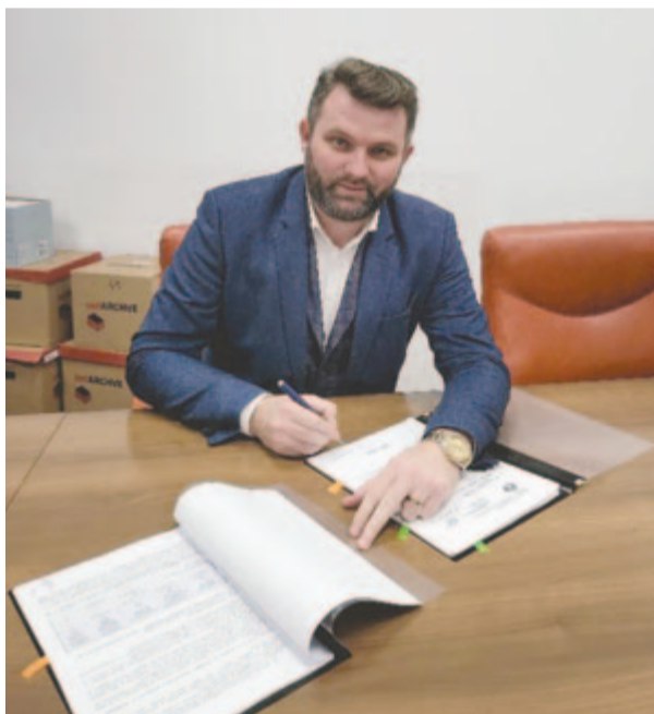
Ciprian Alin Belean polgármester