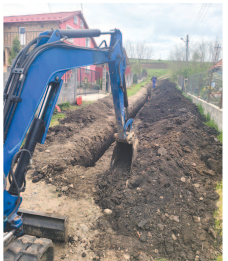
Mezőszentmártonban is folytatják a víz- és szennyvízhálózat bővítését

A 3.400 lelket számláló község lakosságának legnagyobb gondja a megélhetés, a munkanélküliség, a fiatalok elvándorlása. A helyiek gondjait szívén viselő polgármester mindent megtett annak érdekében, hogy befektetőket vonzzanak a környékre. Ipari parkot alakítottak ki, két beruházóval már aláírták a szerződést, a harmadikkal is tárgyalásokat folytatnak. Ha minden a tervek szerint halad, jövőben megkezdhetik a tevékenységet, és a helyi fiataloknak a külföldi munka helyett lehetőségük nyílik szülőfalujuk közelében elhelyezkedni.