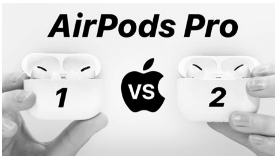
AirPods Pro 1 és Pro 2, mint két tojás

Mark Gurman szerint a későbbiekben nagy esély van arra, hogy az AirPodsokra egészségügyi szenzorok kerüljenek. Persze, csak a modellváltást követően, amire nem tudni, hogy mikor kerül sor. Az egészségügyi funkciók között az elemző szerint olyanok is lehetnek, amelyek képesek lesznek mérni a felhasználók testhőmérsékletét. Ebben az állításban valóban lehet ráció, hiszen a fülben sokkal pontosabban meghatározható a testhőmérséklet, mint például a csuklón, ahol az okosórát hordjuk, és aminek kapcsán már régi téma, hogy vajon mikor érkezik meg a testhőmérséklet mérésére alkalmas funkció. Ha ezt az Apple valóban a vezeték nélküli fülhallgatójába tervezi tenni, akkor nagy valószínűséggel soha, hiszen ez egy olyan feature lehet, amivel számos embert tud arra ösztönözni, hogy vásárolja meg az olcsónak egyáltalán nem nevezhető fülhallgatót.