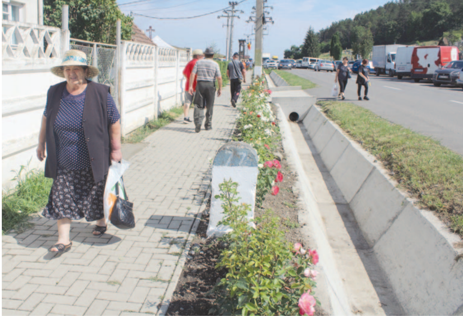
Mezőrűcsi Népszámlálás a 6. oldalon