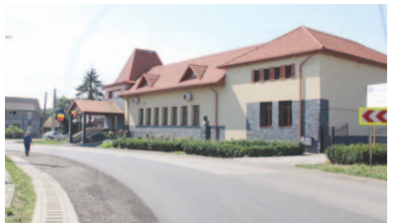
Felújították a mezőrűcsi művelődési otthont, az udvarra a községben született Gheorghe Șincai emlékére emlékszobát terveznek

nul, az ingázókat két elektromos kisbusz szállítja a települések között, a járműveket is uniós forrásokból szerezték be. A község járóbeteg-rendelője mellett az egészségügyi ellátás javítását is fontosnak tartotta, ezért szakorvosokat győzött meg arról, hogy helyben rendelkezzen, hogy a mezőségi emberek könnyebben hozzáférjenek az orvosi vizsgálatokhoz. 2021 óta egy magánklinika létesítésével a községközpontban ultrahangos kivizsgálásra és laborvizsgálatokra is lehetőség nyílt. Ez óriási előnyt jelent az idősek, kisgyermekesek számára, mivel így nem szükséges a megyeszékhelyre utazniuk, hanem helyben is elvégezhetnek bizonyos vizsgálatokat.