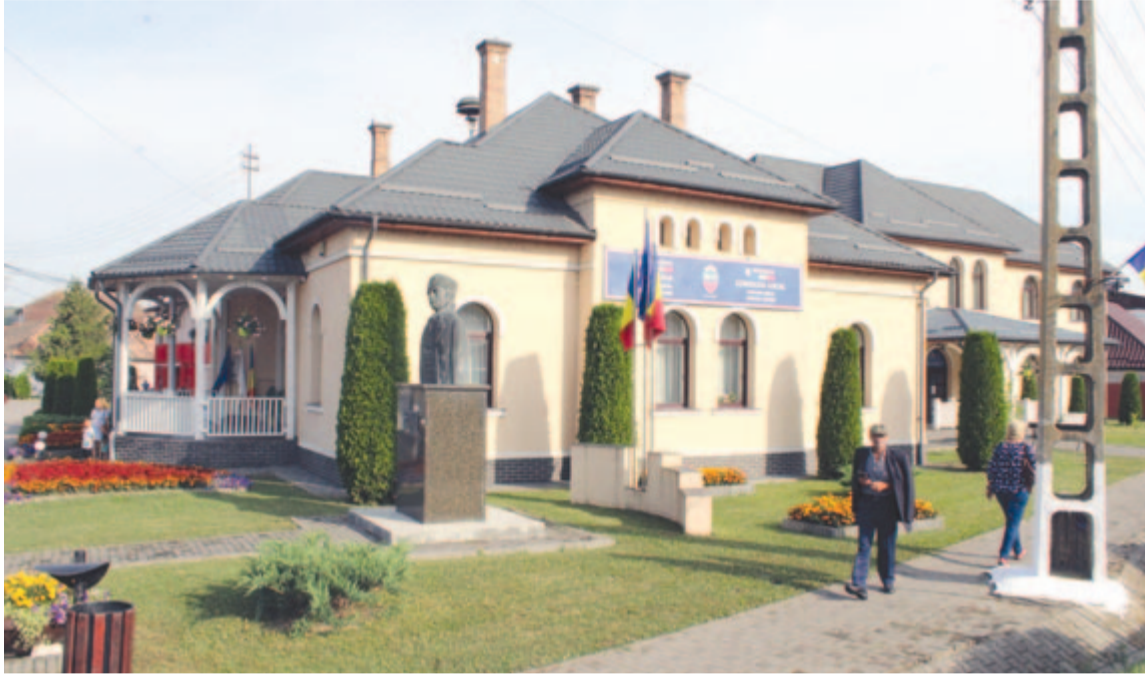
Mezőrűcs polgármesteri hivatala