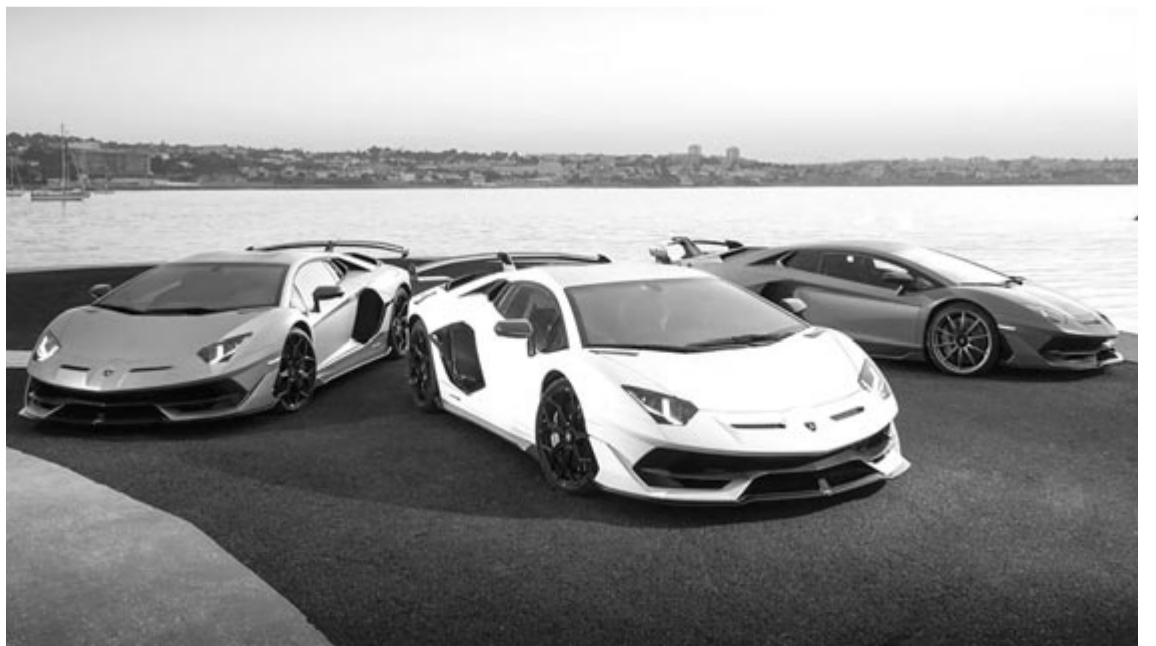
Szupersport Lamborghini autók, illusztráció

Ezek szerint komolyan gondolják, bár a tisztán elektromos modelljükről még semmi hír nincs, kósza pletyka sem. Abban viszont bízhatunk, hogy bár csendesnek csendes lesz, sőt egyenesen hangtalan, szinte biztos, hogy nem lesz lassú.