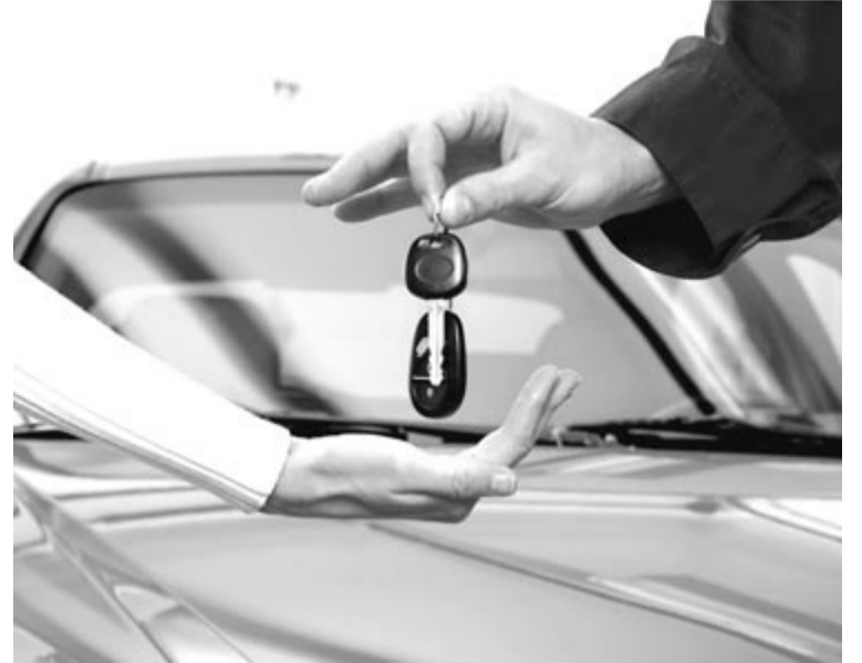
Egyre drágábbak az autók, illusztráció