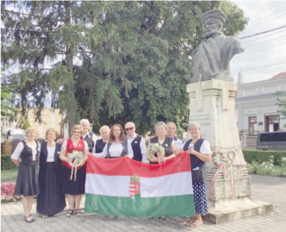
Anyaországból érkezett irodalmi műsorral kezdődött a fesztivál nulladik napja

A nyári zivatarok nem szegték a filmszeretők kedvét, este sok kisgyermekes család ült be a sátrak alá,