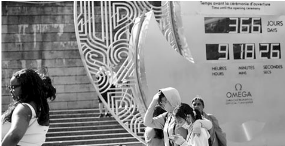
Óra az Eiffel-torony lábánál

Kedden Párizsban bemutatták az olimpiai fáklyát, amellyel a váltófutás résztvevői futnak majd, mielőtt meggyújtják vele az olimpiai lángot. A párizsi olimpia 2024. július 26-án kezdődik, és augusztus 11-éig tart. (Euronews)