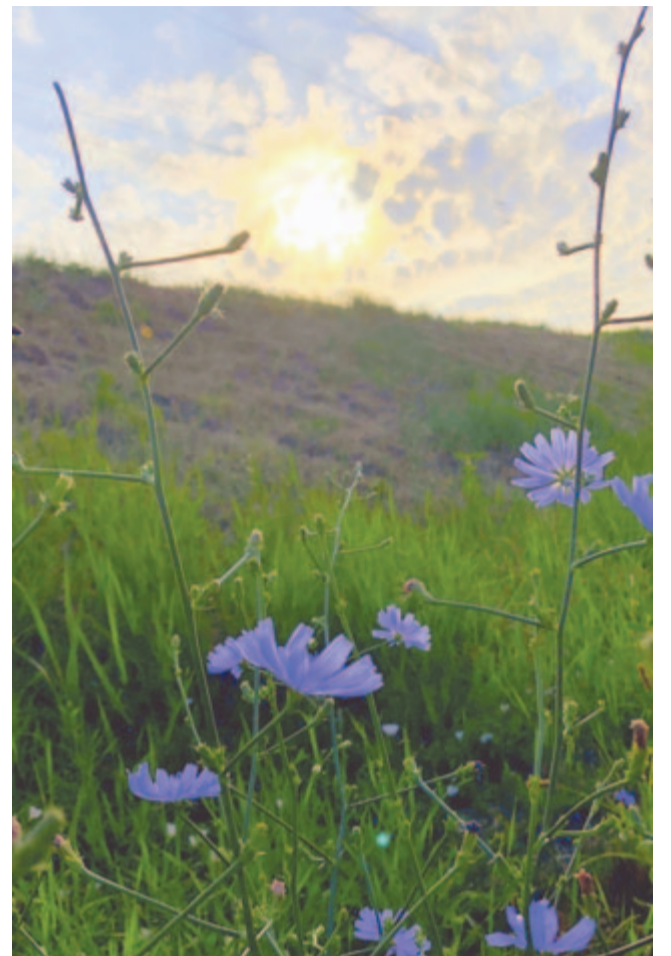
Augusztusi szél zendít katángokat

Lézeng a nyár, álmodozik, s a patak vize megszökik, fehér lángba fagy az akác, meg nem rezdül napokig. Zsong a kékség, felhő gyűlne,