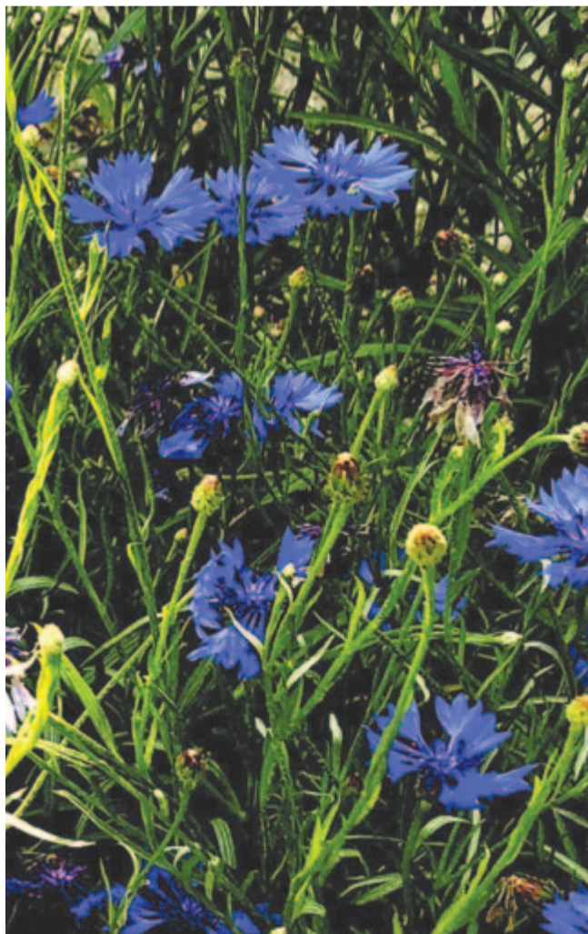
Sóhajtom a búzavirágok kék szerelmét

A 98 évvel ezelőtt, 1925. július 28-án született Klein György sejtbiológus, onkológus, a stockholmi Karolinska Intézet daganatbiológiai tanszékének egykori vezetője gondolatával térek vissza a mitológia világából az élő természet világába: