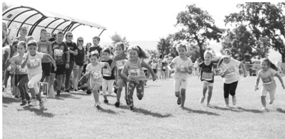
Sok gyermek nevezett be a futóversenyre

A szervezők szerint jó látni azt, hogy egyre nagyobb az igény a mozgással kapcsolatos tevékenységek szervezésére a gyerekek körében is, legalábbis a folyamatosan növekvő részvételi számok egyértelműen ezt igazolják.