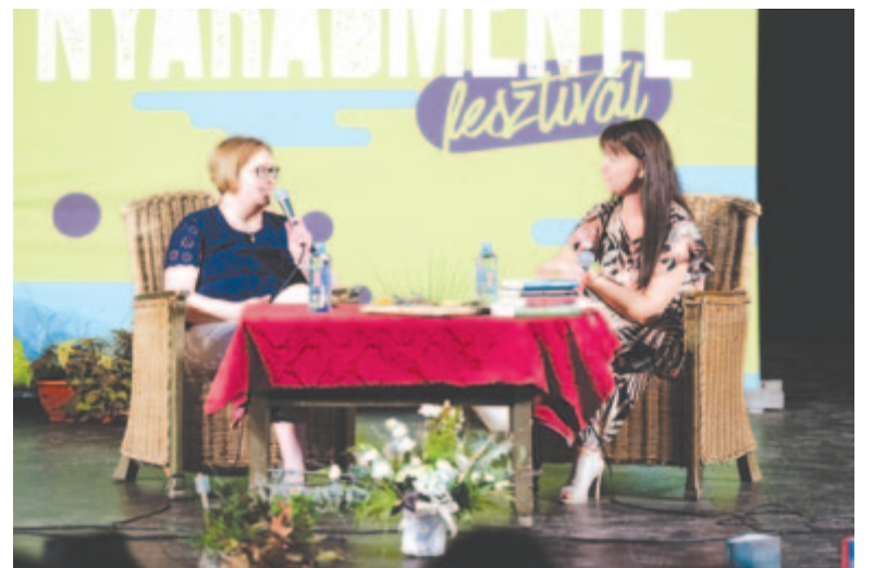
A szórakozás, forgatag mellett helyet kapott a kultúra, az olvasás is

A fesztivál kezdetét Szereda augusztus 1-jei országos nagyvására, a „vásár napja” jelentette, amit az utóbbi évtizedben különböző programokkal kezdtek színesíteni, majd ebből városnapok nőttek ki, aztán ez szélesedett lassan kistérségi rendezvényé. Idén már ötödször rendezték meg a Nyárárdmente Fesztivált, és arra figyelnek, hogy hagyományainkat, értékeinket felmutató programokat is kínáljanak. Idén is három nap állt a vidék kézművesei, kistermelői rendelkezésére, hogy megmutassák alkotásaikat, termékeiket legjavát: ékszerek, bőrdíszmű, varrottások, szöttek, népviseleti darabok, horgolt állatkák és lakásdíszek, teafüvek, szépségápolási szerek, csodálatos faragott