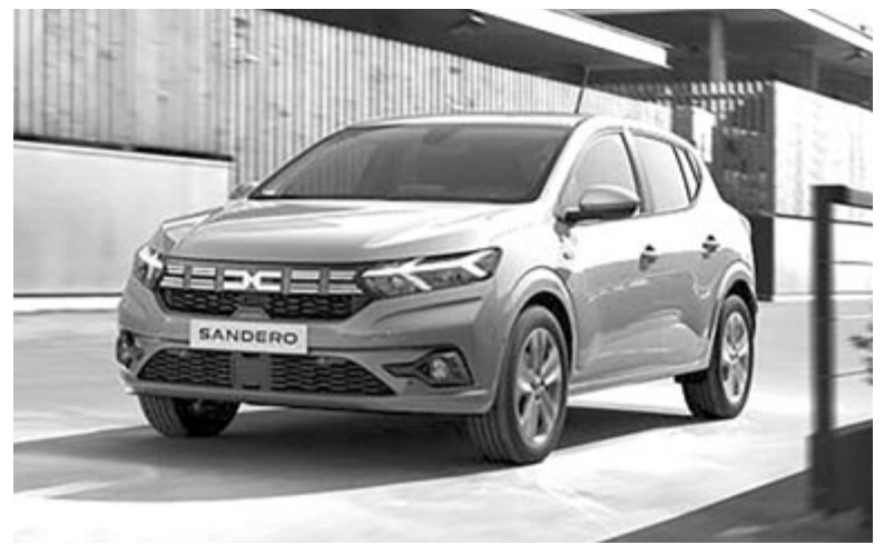
Dacia Sandero, a jelenlegi modell, még belső égésű motorral

Egész pontosan még tavasszal megszelleztették, hogy a román gyártó elkészítené a Sandero elektromos változatát is. Ez mostanra bizonyosságot nyert, sőt a márkavezetői részleteket is megosztottak a típusal kapcsolatban. Elmondásuk szerint az elektromos Dacia Sandero 2027-ben vagy 2028-ban fog a kereskedésekbe kerülni, illetve mind a tervezés, mind a kivitelezés esetében szem előtt tartották a költséghatékonyságot, az árak alacsonyan tartását. Ebben nincs is semmi új, a Dacia ugyanis mindig törekedett arra, hogy olcsó sze-