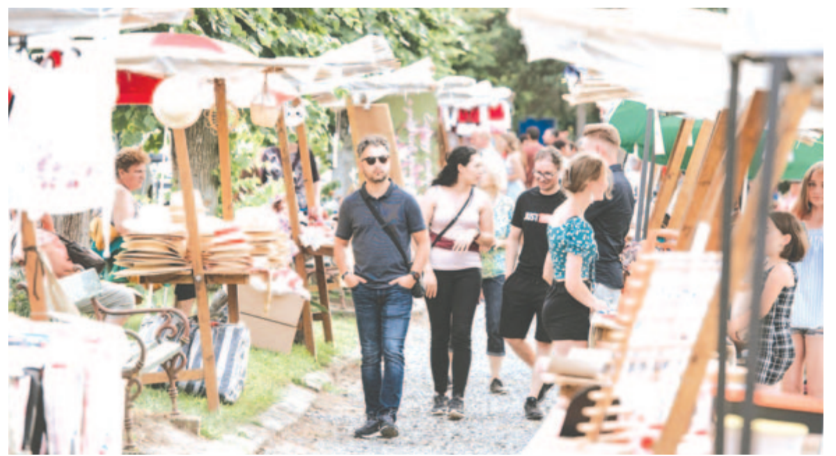
A bővíti örömdetes háttérbe szorult, immár helyi termelők, kézművesek portékáit kínálják a vásárrban

No, meg három szerencsés résztvevő is fölöttébb örülhetett az itt töltött időnek. Ugyanis idén is volt tombola értékes nyereményekkel: egy rigmányi hölgy két személyre szóló tunéziai nyaralást nyert, egy pár egy parajdi, egy másik egy szováti luxusszállodában tölthet el