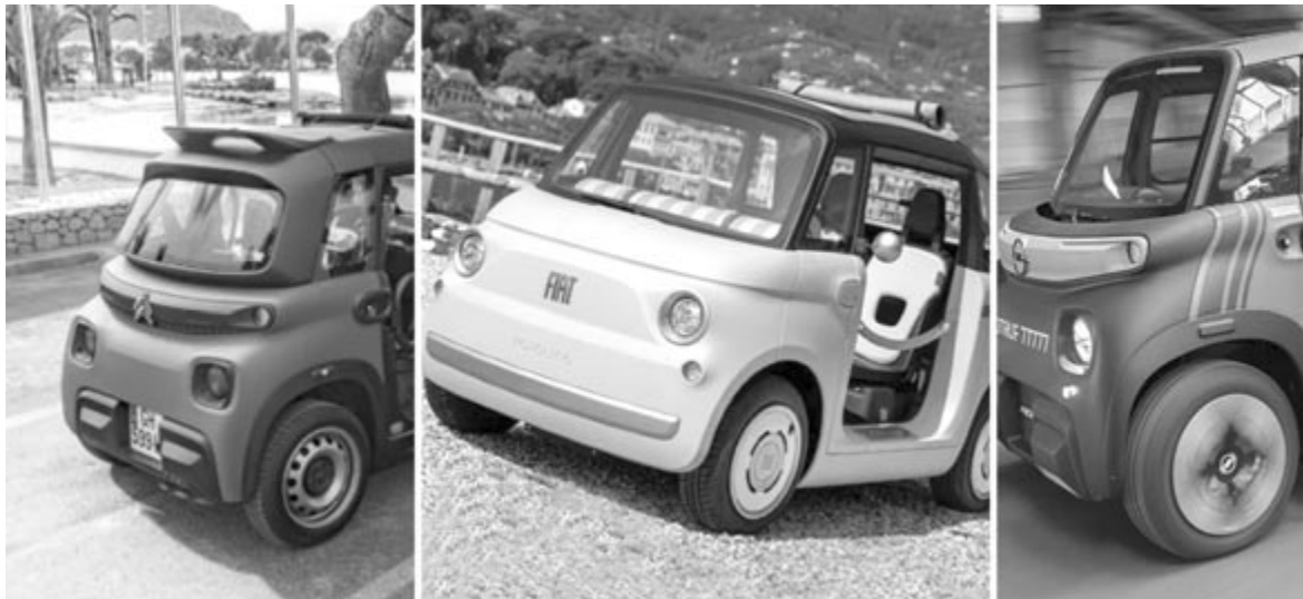
Fiat Toppolino, Opel Rocks, Citroën Ami, a városi elektromos mopedautók

Műszaki adatokat egyelőre nem közöltek, ahogy abban sem lehetünk biztosak, hogy miként is fog kinézni maga az autó. Egyesek szerint jelentősen különbözni fog a jelenleg forgalomban levő típustól, míg mások azt állítják, hogy hasonlítani fog, de nagyobb hangsúlyt fognak fektetni a természetközeli szemléletre, ezáltal jobb terepképességekkel fog bírni az autó. Mivel még legalább négy év van hátra az autó bemutatásáig, korai lenne találgatni, viszont abban biztosak lehetünk, hogy minél inkább közeledik a hivatalos leleplezés, egyre több információt fogunk megtudni a típusról.