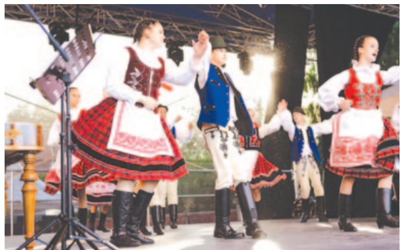
Van még igény a néptáncra, és nem is akármilyen

Ha számokról is akarunk beszélni, tizenöt helyszínen több mint