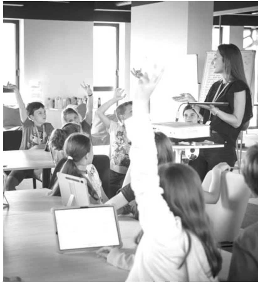
A júliusi román nyelvtábor

– Természetesen. 15 évestől az időkig minden korosztályból voltak és vannak érdeklődők, akiknek román, illetve angol nyelvű