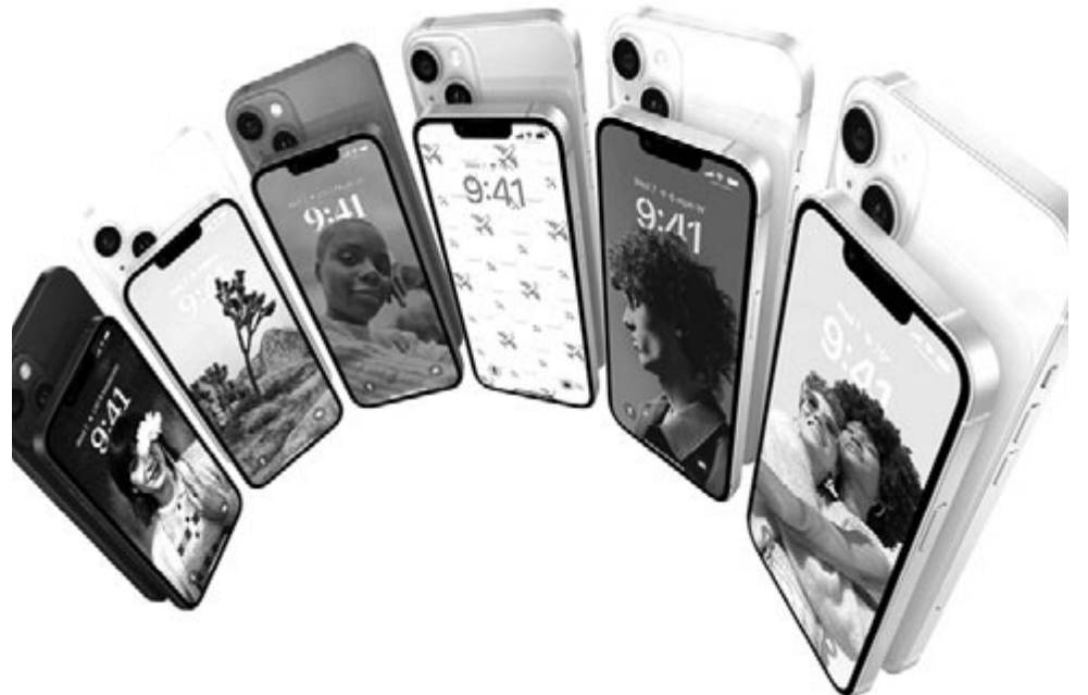
iPhone 14 és 14 Plus, illusztráció

Különösen annak fényében áll instabil lábakon ez az elmélet, hogy az Apple az iPhone 15 modellesalád tagjaiból az idén mintegy 85 milliót szeretne értékesíteni, és arra törekszik, hogy ezek zöme a Pro szériából kerüljön ki. Azonban, ha éppen ennek emeli fel az árat, de közben nem nyúl az alapváltozatokéhoz, akkor kétséges, hogy bejön a számítása. Tény az is, hogy a legtöbb gyártó emelt árat, az Apple nem, de ezzel együtt sem kell félni, így is szép summát vág zsebre a készülékek eladási árából. Elég csak annyit mondani, hogy a bevétele tetemes része az iPhone-okból származik, és jelenleg – már nagyon sok éve – az Apple a Föld legértékesebb vállalata.