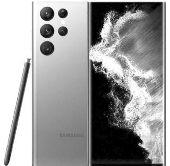
A Samsung értékesítette 2023 második negyedévében a legtöbb okostelefont, a zászlóshajójukból, az S23 Ultrából is szépen fogyott

A képzeletbeli dobogó második fokára az Apple került fel, amely 43 millió iPhone-t értékesített, amivel megkaparintotta a piac 17%-át, ugyanakkor neki is 13%-os csökkenést kellett elkönyvelnie. Ebben nagy szerepe lehet annak is, hogy a négy modellje közül a 14 Plus nem váltotta be a hozzá fűzött reményeket, a tavaly év végén a gyártósorokat át kellett állítani, mert nem tudtak annyit készüléket eladni, mint amennyit legyártottak, persze nem kell elhallgatni azt sem, hogy más készülékeknél, a 14 Pronál és 14 Pro Maxnál alig bírták teljesíteni a megrendeléseket.