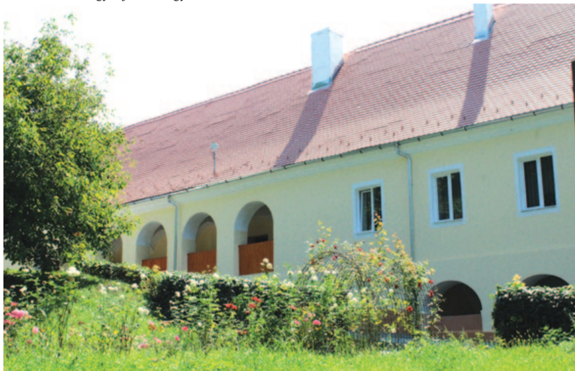
A felújított Kemény-kúria

– Arra gondoltunk, hogy öreggöngyöltsünk vagy panziót alakítunk ki. Nem tudjuk pontosan, hogy mi lesz az épület rendeltetése, de lépni fogunk – mondta a polgármester.