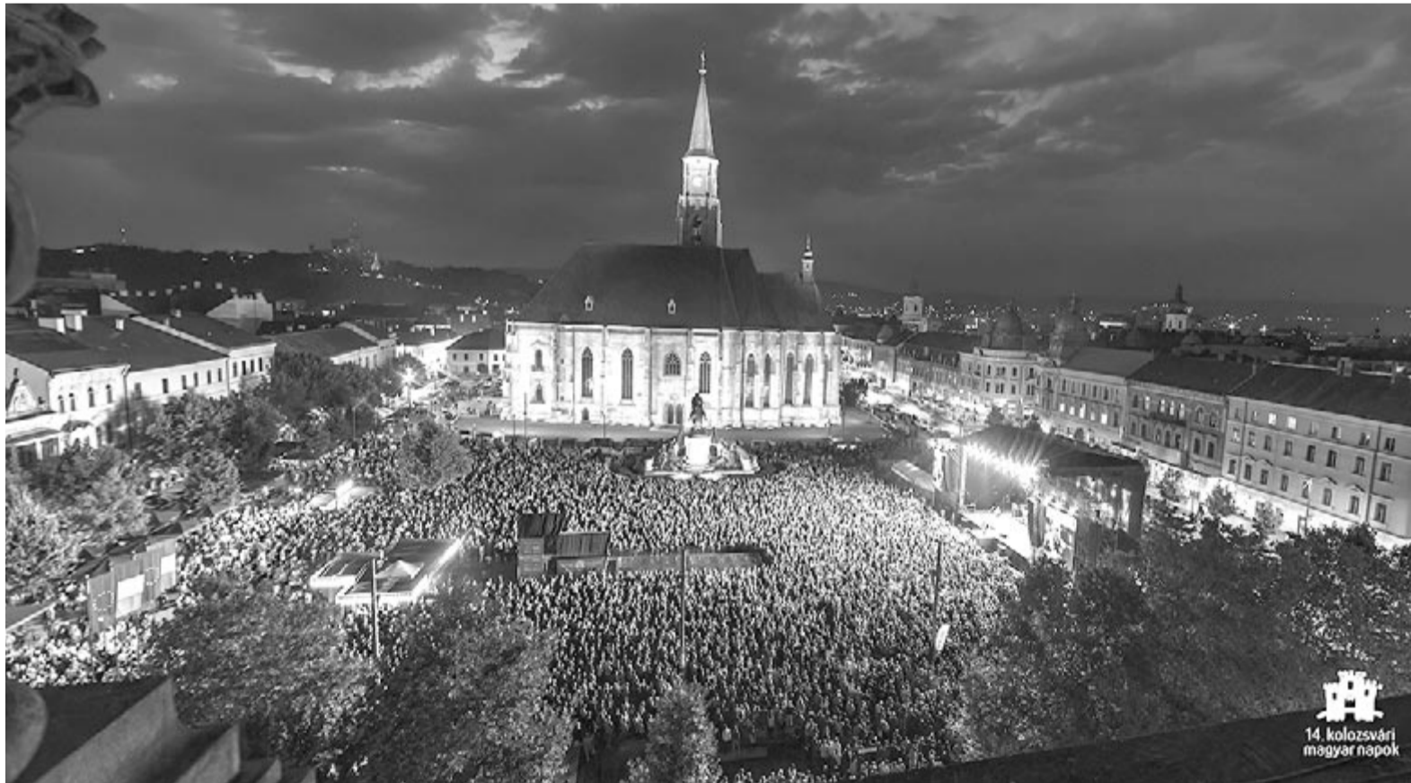
14. kolozsvári magyar napok

(A Kincses Kolozsvár Egyesület sajtóirodája)