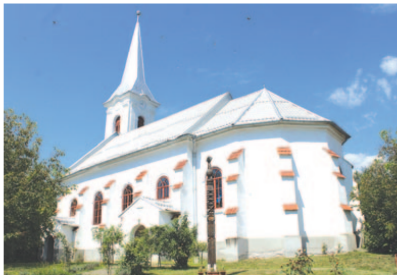
A magyarórdi templom

látom, Ózdon van remény, amennyiben a fiatalok a ma dívó gondolkodásmódtól eltérően családot alapítanak, és gyerekeket vállalnak. Van életerő a gyülekezetben, s rajtunk múlik a jövő. Sok stratégiát dolgoztak ki a politikusok és az