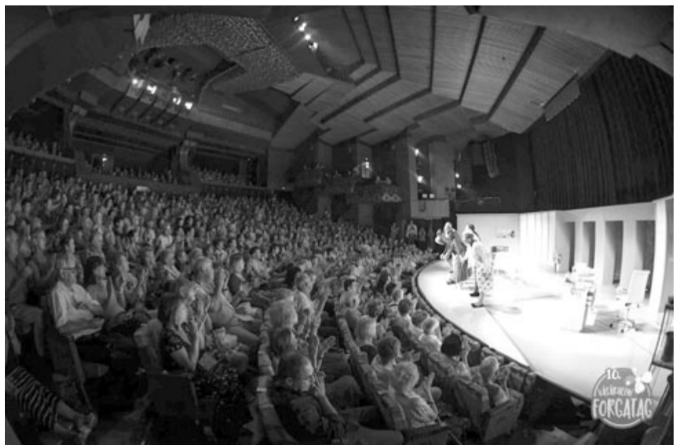
Márai Sándor Kalandja telt ház előtt a Marosvásárhelyi Nemzeti Színházban. A Budapesti József Attila Színház előadása