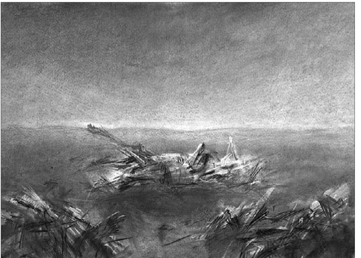
Pusztá... Miholcsa Dávid Lehel grafikája az Art Nouveau Galériában a Szilágyi Imolával közös kiállításon

*1991. augusztus 23-án hunyt el a költő (sz. 1922. január 3-án Budapesten)