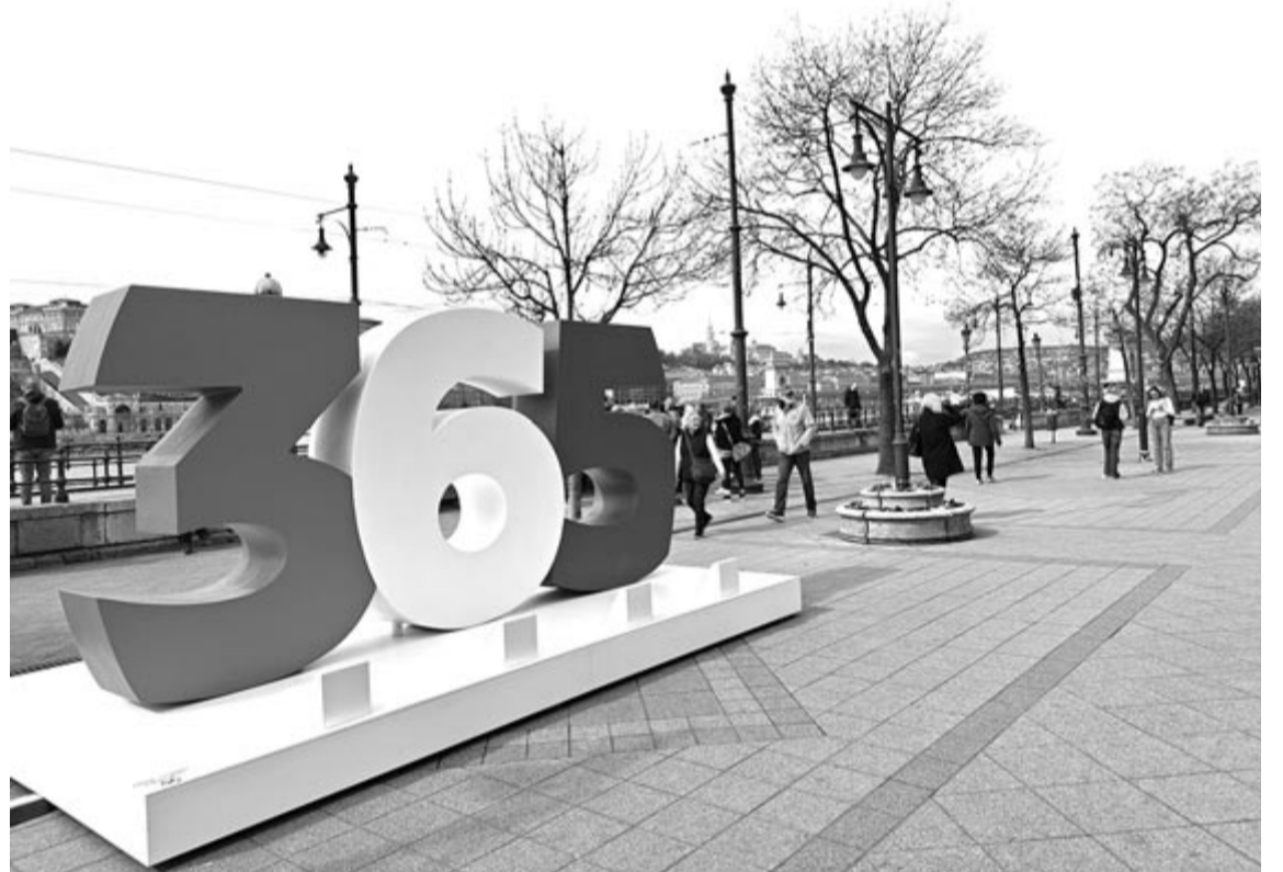
A tavalyi pályázat nyitóhelyszíne a budapesti Duna-parton 2023 márciusában