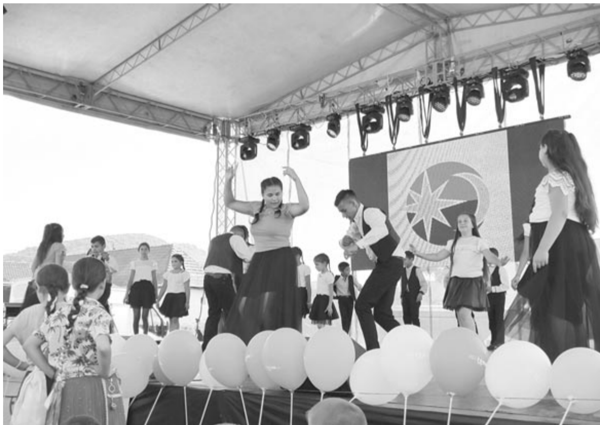
Magyar, cigány és román táncokat láthatott a közönség