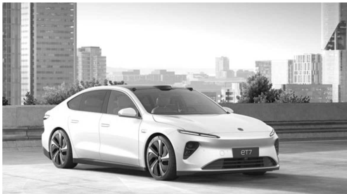
Nio ET7, illusztráció