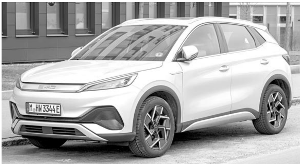
BYD Atto 3, illusztráció

A Great Wall Motorral vagy nélküle, a BYD-nek sikerült összetrombitálnia a kínai autógyártók többségét. Amennyiben sikerül megállapodásra jutniuk, rövid időn belül „megindulhatnak” Európa és az Egyesült Államok felé. Ez egyrészt jó, hiszen a verseny élesebb lesz, aminek következtében a vásárlók olcsóbban juthatnak autókhoz, viszont nem biztos, hogy a gazdaságnak ez jót tesz. Persze még számos kérdés felmerül, mint például, hogy a kínai gyártók hol és hogyan képzelik el a gyártást, az Európai Unió és az Egyesült Államok egyáltalán beengedik őket, illetve ott lebeg az a kérdés is a levegőben, hogy mennyi idő kell ahhoz, hogy a vásárlók lecseréljék a megszokott és kedvelt márkáikat egy ismeretlenre. Abban biztosak lehetünk, hogy ez nem fog egyik napról a másikra megtörténni. De nem dőlhetnek hátra a „régi legendás” gyártók, fel kell vegyék a kesztyűt, és rövid időn belül valami nagyot kell villantsanak, hogy képesek legyenek megvédeni magukat, ha nem akarnak a kínai nyomás áldozatává válni.