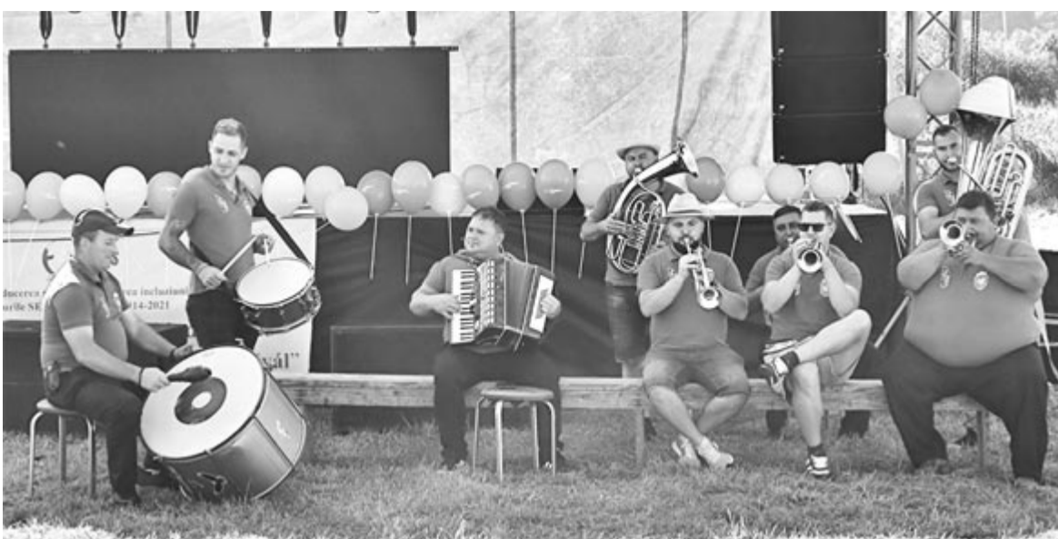
A jó hangulatról a zoltáni fúvószenekar gondoskodott

A fesztivál a SMART Makfalva – integrált társadalmi tevékenységek az inkluzív fejlesztésért című kétéves projekt egyik mozzanata volt, amelynek fő partnere a közösségi önkormányzat, mellette pedig