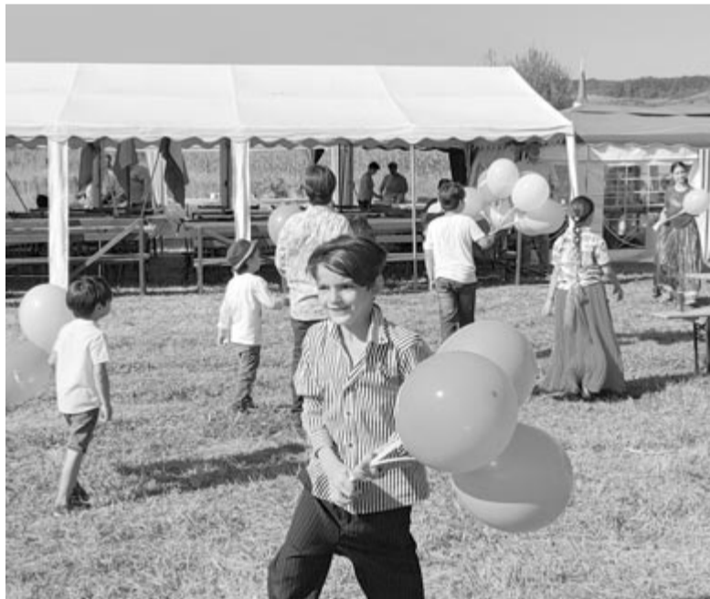
A gyerekek is szórakoztak