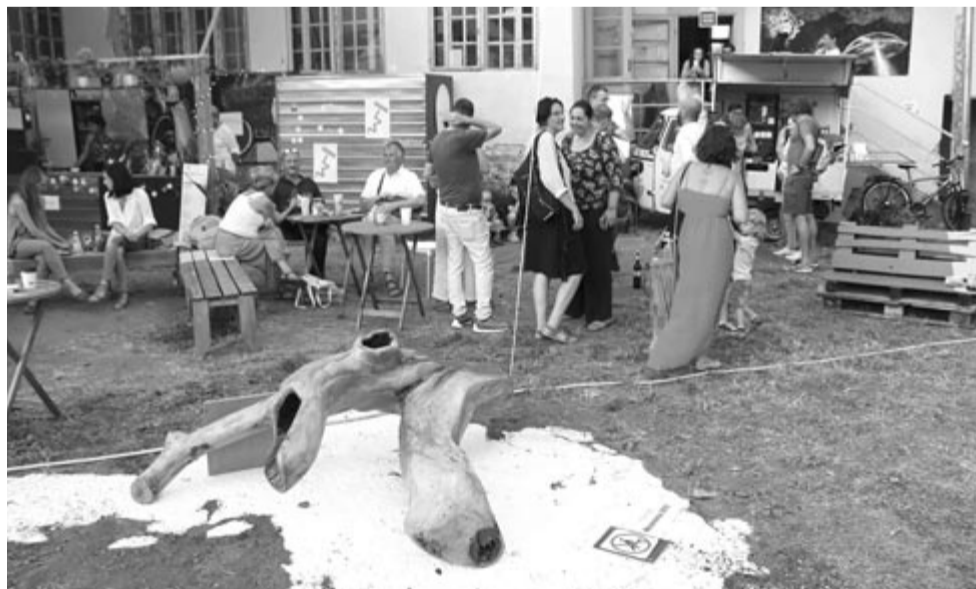
Pillanatkép a tavalyi fesztiválról

zett magának, és ez nem véletlen: azok látogatják (szinte minden évben ugyanazok), akik szeretik a kortárs művészeteket, a magas kultúrát, a nivós szórakozást, a változatosságot és a sokszínűséget, kicsit kilógnak a sorból, nem nyárspolgárok és nem panelprolik, sok esetben fiatalok még és családosok – a Szféra zavartalan szórakozási, találkozási lehetőséget biztosít kicsiknek és nagyoknak