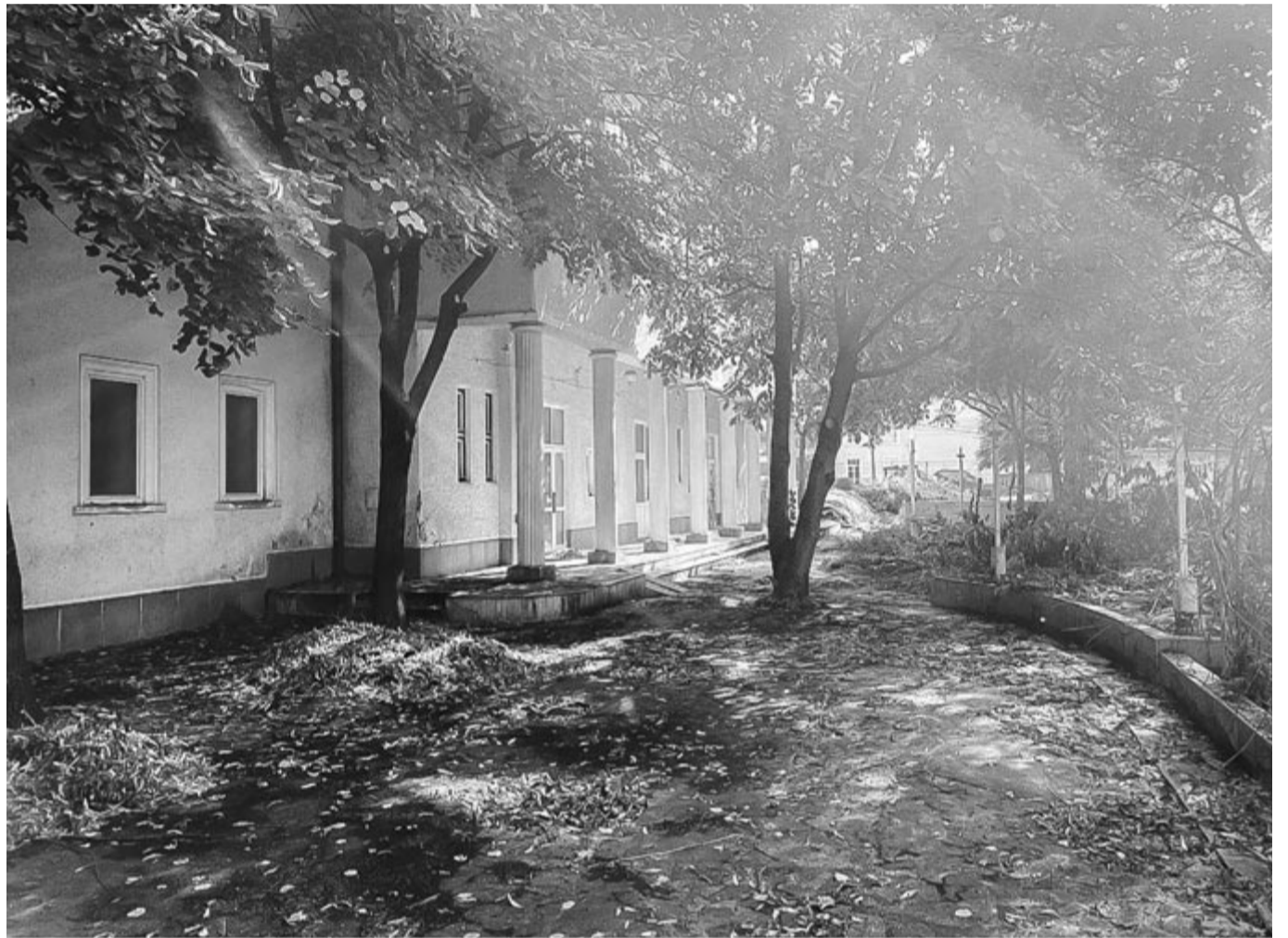
Szféra – az idei fesztivál helyszíne

1957. szeptember 3-án, 66 éve hunyt el a Kossuth-díjas író, költő, újságíró, producer, dramaturg. Született 1871. augusztus 11-én Budapesten.