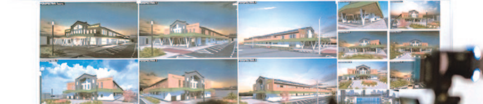
A Hadsereg téri piac látványterve