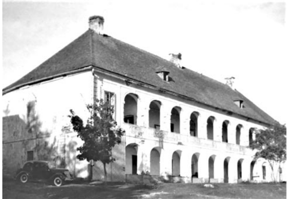
A '60-as években felújított kastély

Az 1721-es leltár szerkesztője az „igen friss” kőépületet járta végig, és leírta a „hosz-