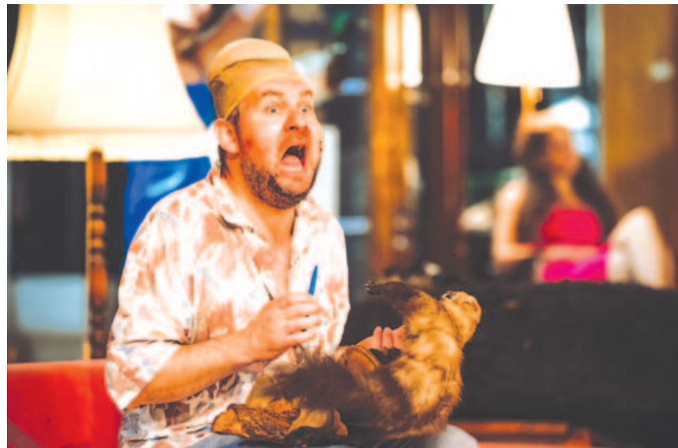
A felvételek a próbán készültek