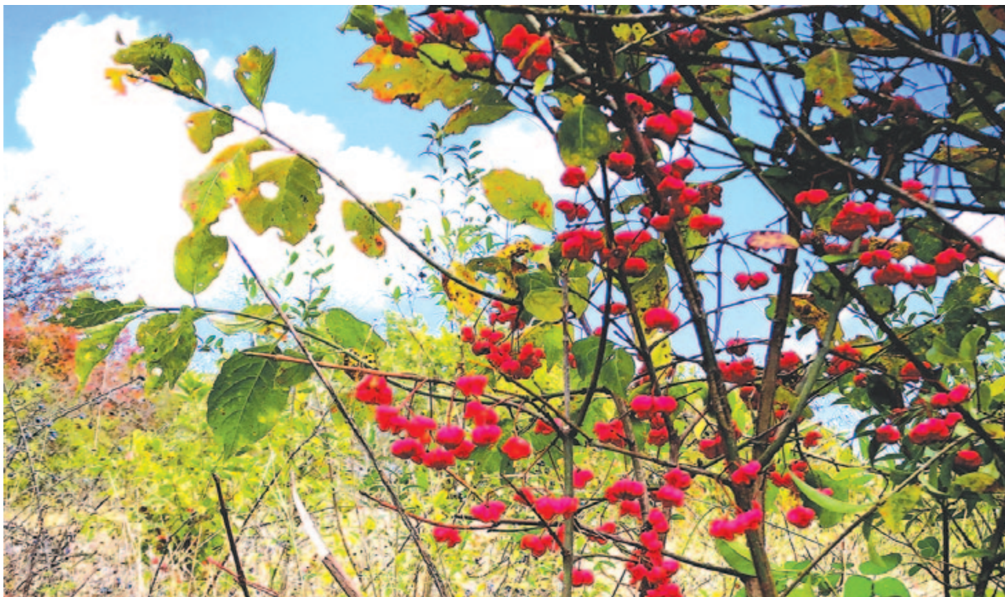
Kecskerágó – tündéri pöttöm püspökök bíbor bíretumban