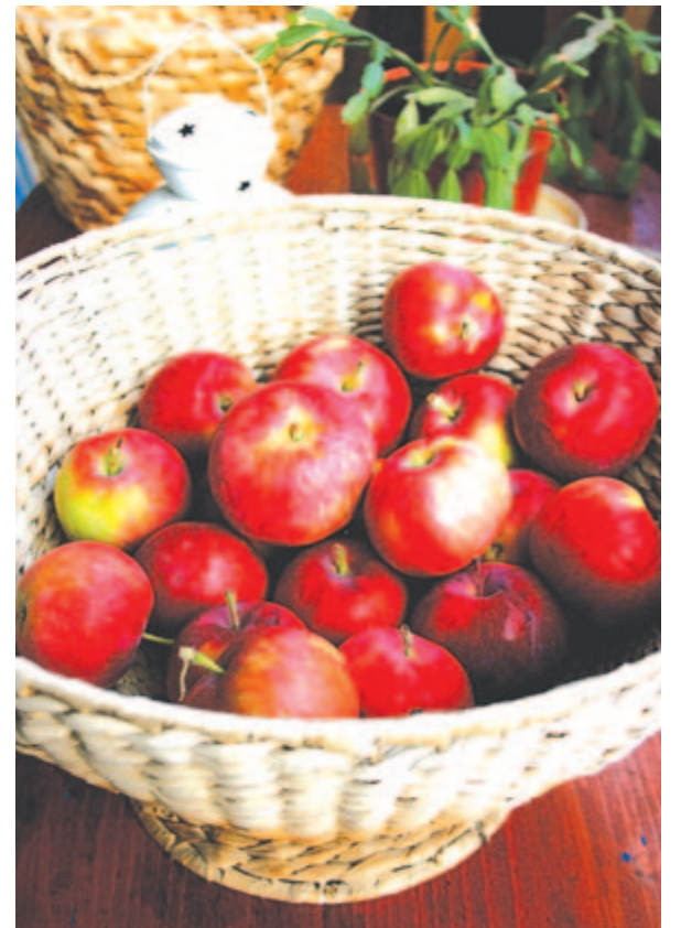
Nyár végi aranylő színek – kosárkányi nyári piros alma

Szeptember 12. Mária nevenapja (festum nominis Beatae Mariae Virginis). Szent Hieronymus szerint Mária a zsidóknál annyit tesz, mint Illuminatrix , megvilágosító. Mária az asszíroknál Dominát , úriasszonyt jelent. Ahogy Krisztus Úrnak nevezetik, úgy Mária legnagyobb méltósága, hogy asszonynak hívatattik.