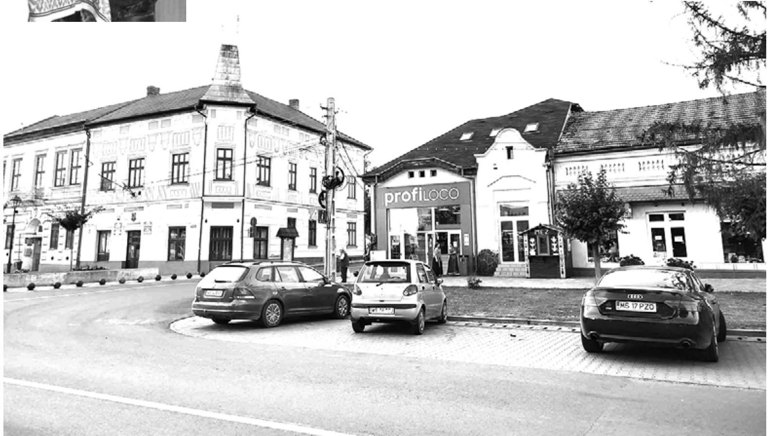
Ma is többen tudják, melyik házakat lakták zsidók Nyáradszeredában