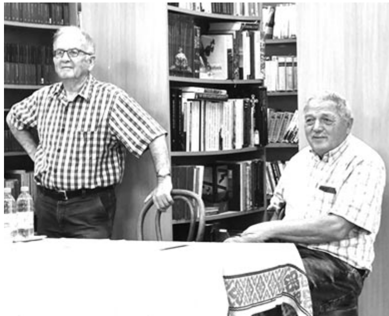
Peleg és Knoll: két szeredai származású zsidó

Első látogatásáról már-már eredménytelenül indult volna haza, amikor betért egy utcába, és valakit megkérdezett, hogy élnek-e itt zsidók. Akkor derült ki, hogy itt még tudják, hogy éppen abban az utcában volt egykor a zsinagóga, és még emlékeznek néhány zsidó családra, sőt sok házról tudják még, hogy azokat zsidók lakták valaha. Így kezdett el kutatni itteni felmenőit, és munkájában nagy segítséget kapott helyi szinten is, de egy marosvásárhelyi levéltárostól is. Aztán sokévi kutatása során megszületett az Alon Bakhut , azaz A siratás tölgyfája című könyve, amely a nyáradszeredai zsidóság történetét dolgozza fel.