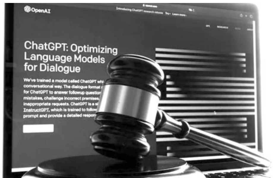
Per az OpenAI ellen, illusztráció

Egyes feltételezések szerint ez a korai perek egyike lesz, és a jövőben még számtalan olyan esetre lehet számítani, amikor egy vállalat bepereli a másikat a mesterséges intelligencia és annak nem szakszerű használata miatt. Most viszont az OpenAI-t az a veszély fenyegeti, hogy a szövetségi bíró elrendeli a ChatGPT teljes adathalmazának a