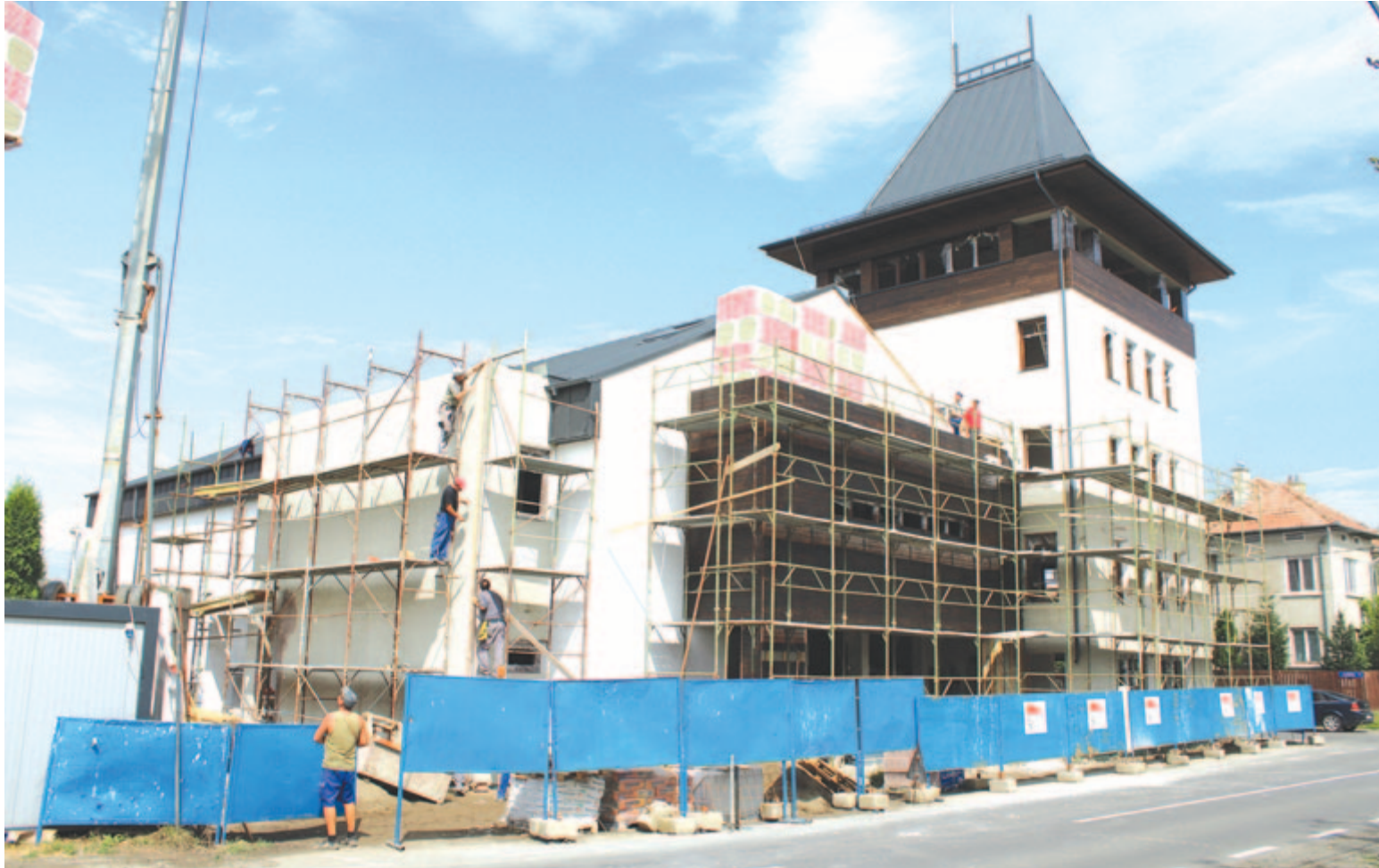
Marosszentgyörgyi összeállításunk a 6. oldalon