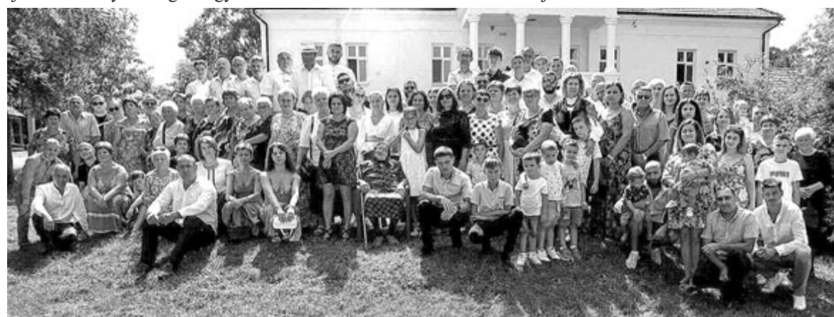
Bara nemzetség 2023 – a kilencágú, egytörzsi fa

működő orgonájának hangjai kíséretében az istentisztelet a 95. genfi zsolttárral kezdődött. A szeretet jegyében, a nemzeti ünnep fényében emlékezett meg a falu lelkesze is a nagyszerű s egyben példát adó Bara-találkozóról.