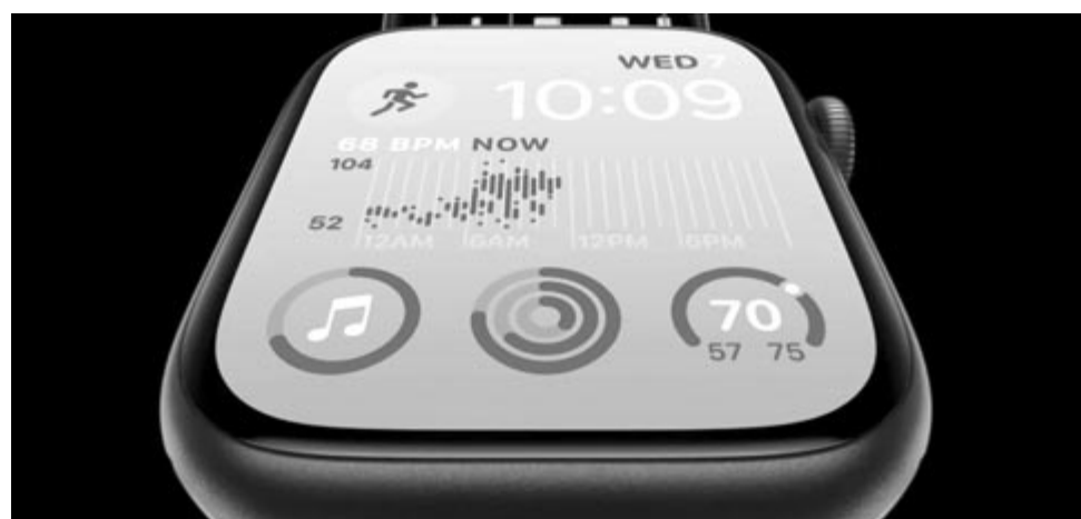
Apple Watch piros színben

Tehát az idén csak a kilencedik generáció fog érkezni órafronton. Azt rebesgetik, újdonság lesz, hogy egy rózsaszín – nem rose gold – színváltozatban is pompázni fog. Emellett pedig arról is szólnak értesülések, hogy az Apple kisebb dobozt tervez az új generációnak, amely révén csökkenteni szeretné a szállítási költségeket.