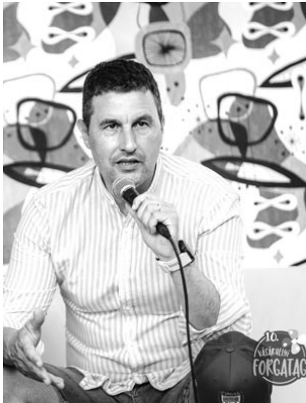
Tánzos Barna szenátor, környezetvédelmi szakpolitikus, Románia volt környezetvédelmi minisztere

Az autók kapcsán elhangzott az, hogy egy gépjármű életében három ciklus van: a gyártás, az üzemeltetés és az újrahasznosítás. Ilyen megközelítésben egy belső égésű autó az életének mindhárom fázisában szennyez, míg egy elektromos autó esetében ez leledukálható egyre, a gyártásra. Természetesen ez az állítás csak akkor állja meg a helyét, ha a töltés során a tulajdonos zöldáramot, megújuló forrásból származó villamos energiát használ. Tán-