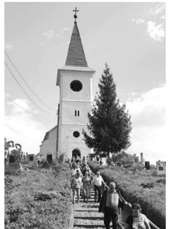
A templom felújítása a gyülekezet megerősítését is hozza magával