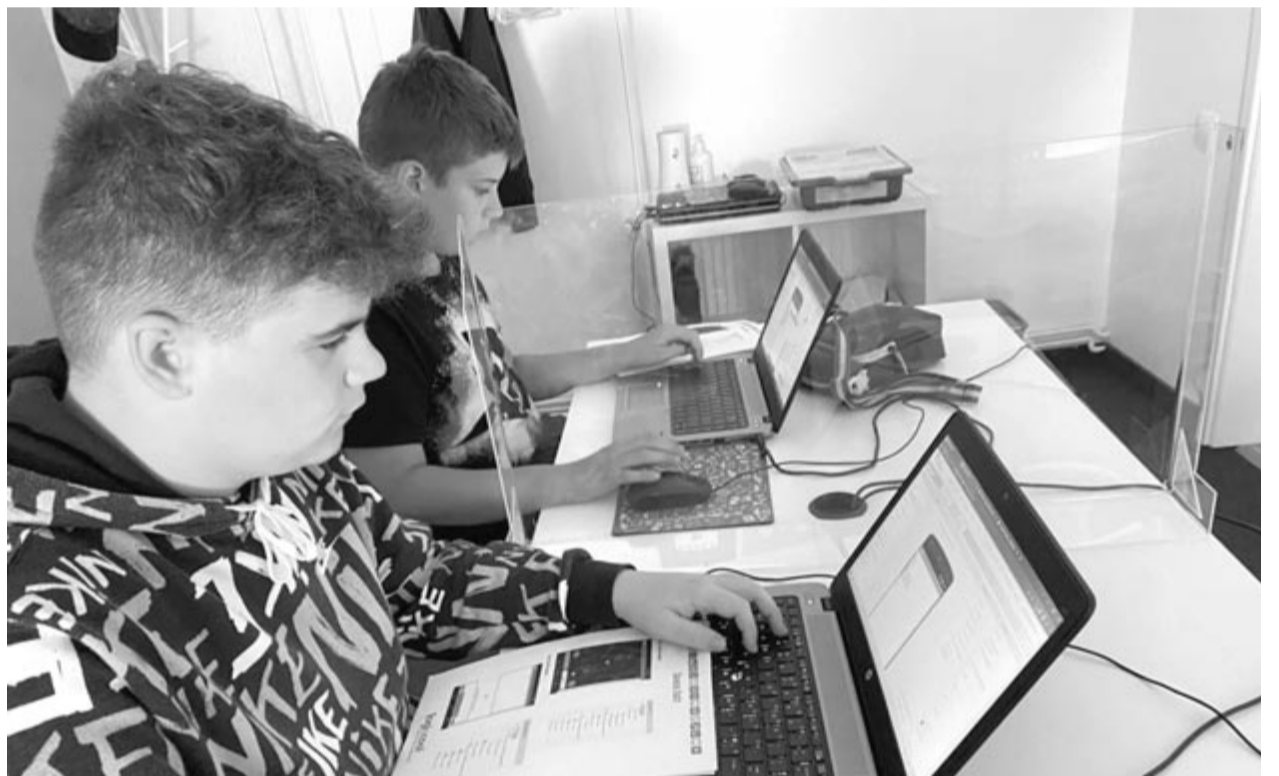
Informatikai újdonságokat tanuló gyermekek a Logischoolban

A Logischool azoknak a fiataloknak szól, akik érdeklődnek az informatika iránt, akik nyitottak a digitális világra. Ebben a nem hétköznapi iskolában megtanulhatják, hogy hogyan lehet hasznosan eltölteni az időt a kijelzők előtt, méghozzá olyan formában, hogy minden egyes alkalommal ők maguk is fejlődjenek!