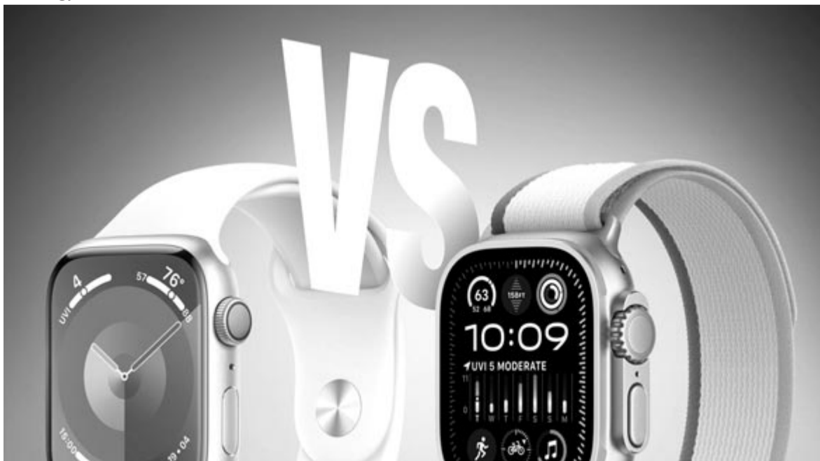
Apple Watch, kilencedik generáció és Apple Watch Ultra, második generáció

Az Ultra esetében a kicsivel fényesebb kijelző és a hosszabb üzemidő jelenti az újítást, ami miatt szintén nem érdemes váltani. A sima Apple Watch esetében a kilencedik generáció szintén nem hozott változást a nyolcshoz vagy a heteshez képest. A hatodik generációhoz képest ugyan beszélhetünk változásról, de ott sem eget rengető a különbség. Az igazság az, hogy az öt évvel ezelőtt bemutatott negyedik generációhoz képest lesz csak igazán észlelhető az újdonság, így, ha valaki látványos ugrást szeretne elérni, akkor ebben az esetben is az öt évvel ezelőtti modellt kell lecserélnie. Különösen annak tekintetében állja meg a helyét ez az állítás, hogy az almás vállalat hosszú ideig támogatja az okosórát is, így azok megkapják a sportolási funkciók nagy részét szoftverfrissítés útján. Igen, a negyedik generációhoz képest például az ötös kapott always-on kijelzőt, és a hatodik generáció már képes mérni a véroxigénszintet. Ezek érdekes funkciók, de a legtöbb felhasználó néhanapján „játszik” ezekkel, utána pedig hosszú időre a létezésüket is elfelejti. Persze, ahogyan az iPhone esetében, úgy az AirPods Pro és az Apple Watchok esetében is ez nem több mint egy ajánlás, a döntés mindenkinek a saját kezében van.