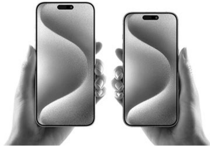
iPhone 15 Pro Max és 15 Pro

A Pro modellek esetében viszont már bonyolultabb a kérdés. Méretben itt is ugyanaz a felhozatal, 6,1 és 6,7 hüvelyk, Dynamic Island, USB-C csatlakozó, ezen készülékekbe már az új Apple A17 Pro processzor került egy U2 névre keresztelt grafikai segítő egységgel, ami főként a játékelményért felel. A Pro és nem Pro modellek közötti különbség, ami a csatlakozót illeti, az, hogy a sima változatokban