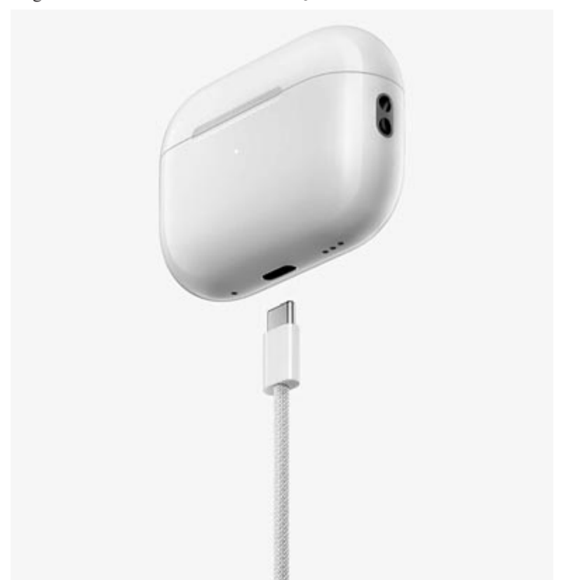
Apple AirPods USB-C csatlakozóval