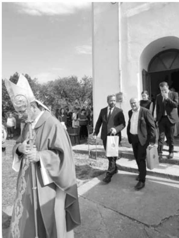
Egyházi és világi előljárók jelenlétében zajlottak az átadások