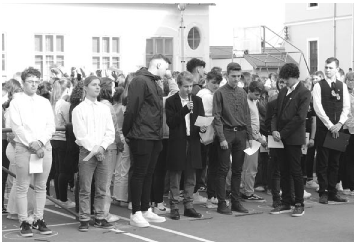
Flashmob 2023. október 6-án az aradi vértanúk emlékére

– Mielőtt sikeres tanévet kívánánk, fejezzük be a beszélgetést azzal az Umberto Eco-idezzel, amely a Vártemplomban tartott tanévnyitón mondott beszédében hangzott el: „A világmindenséget nem csupán a sokféleségben rejlő erő teszi széppé, hanem az egységben rejlő sokféleség is.” Így legyen!