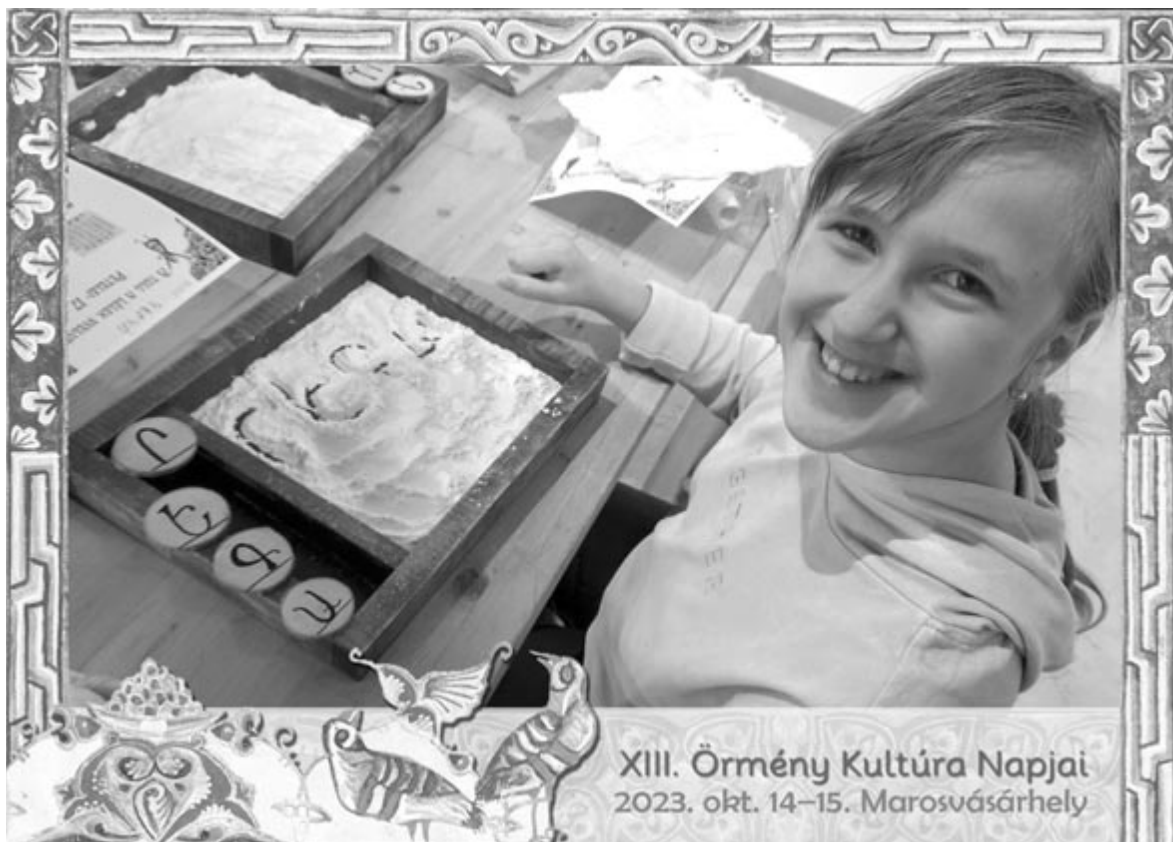
XIII. Örmény Kultúra Napjai 2023. okt. 14–15. Marosvásárhely

– Az örmény szalonban Szongott korabeli öltözetrel várjuk a résztvevőket, akik gasztronómiai hagyományokat ismernek meg, belehallgathatnak az örmény zene csodálatos világába, de az erdélyi valóságban élve monarchiabeli zeneművek is meghallgathatók. És természetesen az érdeklődők megismerik Szongott Kristóf életét és művét, az erdélyi örmény és a korabeli magyar sajtót. Olyan témák ezek, amelyekkel Marosvásárhelyen még nem találkoztunk az egyesület 15 éves fennállása során.