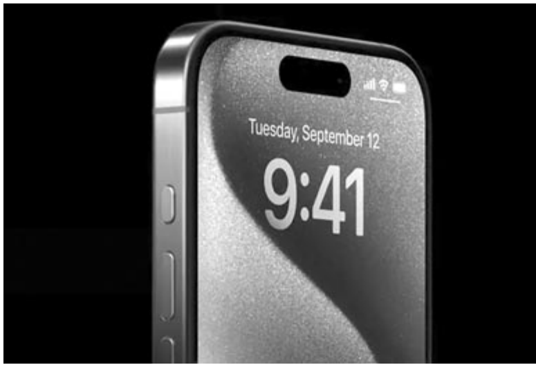
iPhone 15 Pro Max és a Művelet gomb, a hangerőállító fölött

Az első tesztek látva nem meglepő, hogy sokan szkeptikusak az új gombbal kapcsolatban, ami, ha őszinték akarunk lenni, nem is meglepő. Ugyan vonzóak lehetnek a testreszabási lehetőségek, és az Apple ígérete szerint idővel szoftveresen még tovább fognak bővülni a gomb által kínált lehetőségek, de ez is csak egy olyan csoda, ami