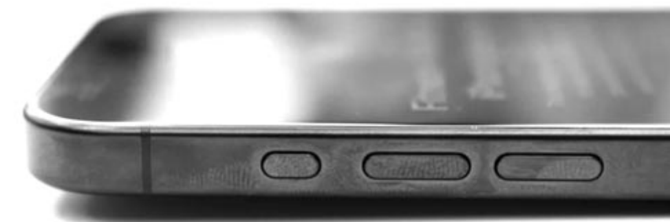
Elszíneződött a titánkeret

A töréstesztet végzők megpróbálták pusztá kézzel meghajlítani a telefont, és bár ez nem sikerült – mint az iPhone 6 esetében –, a nyomástól betört a hátlap. Ez egy olyan eredmény volt, amire még nem volt példa az iPhone-ok esetében, ennek ismeretében pedig valóban szükség van arra a tokra, hiszen nemcsak az elszíneződéstől, hanem ezek szerint az összetöréstől – különös tekintettel a hátlapra – is megvédi az új eszközüket.