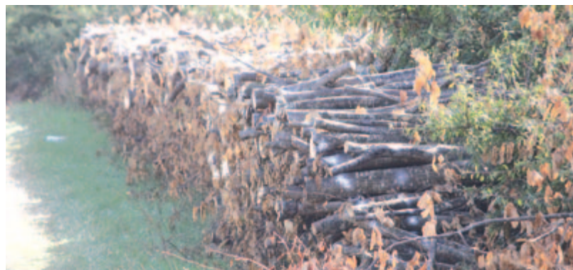
Tűzifa az igénylőknek