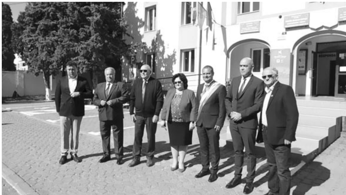
Képviselői irodát is nyitottak a magyar napok alatt