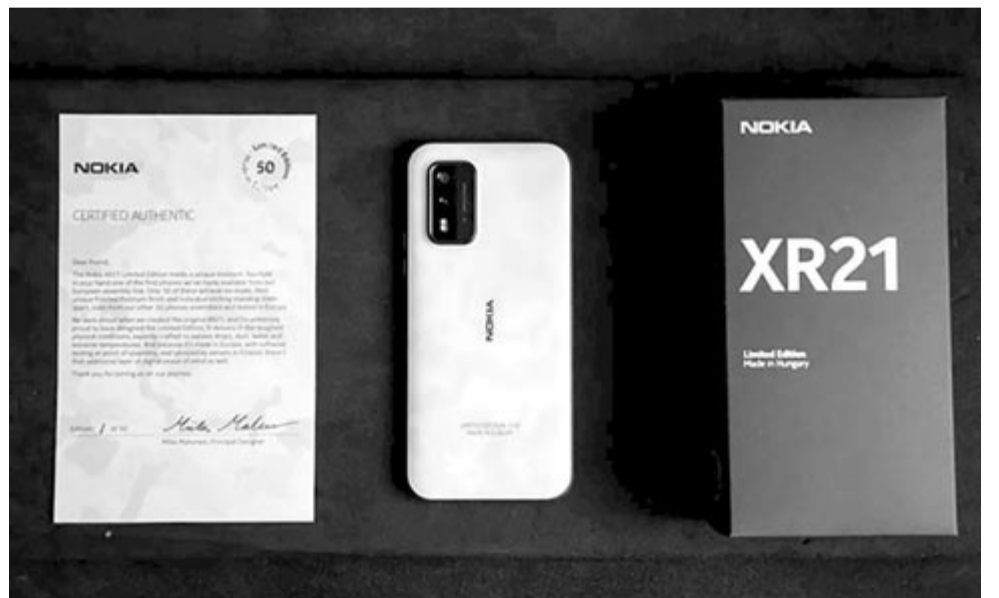
Nokia XR21 5G, jelenleg ilyen eszközök készülnek Magyarországon az üzleti felhasználók számára

A márka vezetői már egy fél évvel ezelőtt jelezték, hogy ismét hoznának gyártási kapacitást Európába, azonban egészen eddig nem lehetett tudni, hogy hol terveznek gyártani.