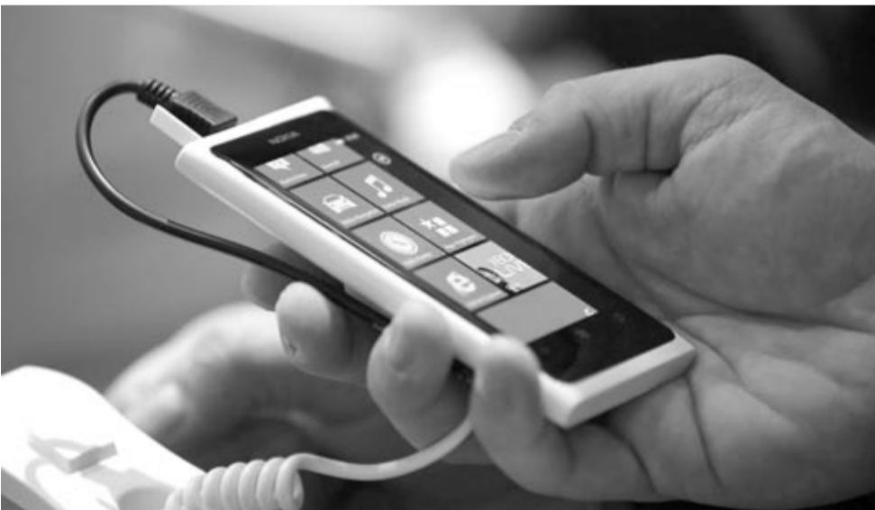
Nokia Lumia 800, egykoron ilyen készülékeket is gyártottak Magyarországon