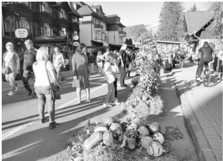
Ötletes, színes alkotások várják a vendéglátóegységekbe betérőket is

A tavalytól már arculatot is kapott a rendezvény, ezt próbálták az idén továbbfejleszteni – mondta el a városvezető, kiemelve, hogy mindvégig kulturált volt a színvonal, az italozás ellenére sem volt semmilyen rendbontás, este tíz óráig minden koncert lejárt, azt követően még a vendéglátóhelyek teraszán egy órát lehetett élvezni a zenés estet, ezt követően csend volt a fürdőtelepen. Ugyanakkor a vásári kínálatot is kulturált szintre emelték, csak hagyományos és kézműves termékek kapnak helyet, az áruhelyek licitálásával és a feltételekkel kizárják a bővít a fesztiválról, amivel más szintet biztosítanak a rendezvénynek, és talán egy mássabb, ezt igénylő, kulturáltabb vendégkör látogatja már a fesztivált. „Nekünk ez elég, ezzel elégedettek, sőt büszkék is vagyunk” – zárta a lapunknak tartott értékelőjét a polgármester.