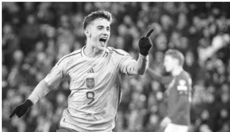
Gavi gólya nemcsak a spanyol, de a skót csapat kijutását is jelentette

* H csoport: Finnország – Kazahsztán (18.00 óra, DigiSport 1, Prima Sport 1), Észak-Írország – Szlovénia (21.45), San Marino – Dánia (21.45).