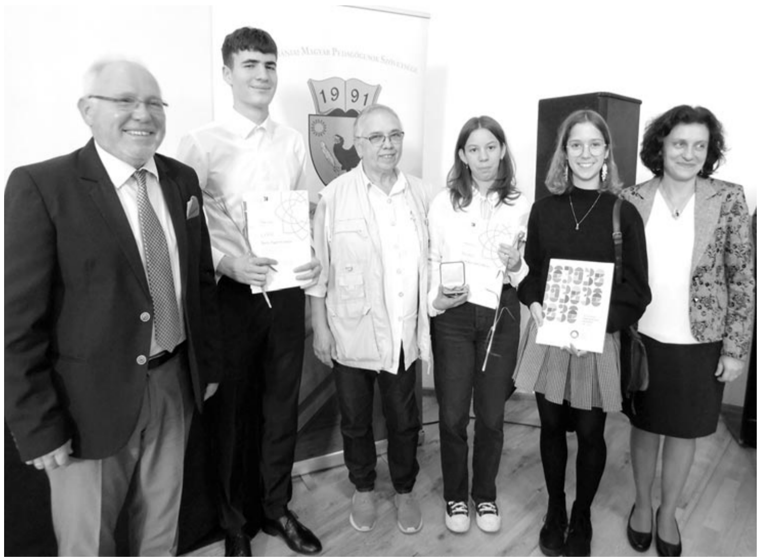
Ezüstgyopár 2023 – Maros megyei díjazottak és a diákokat kísérő tanárok

Az ünnepség a díjazottak rövid műsorával ért véget, a közönség búcsúzóul nemzeti imánkat énekelte.