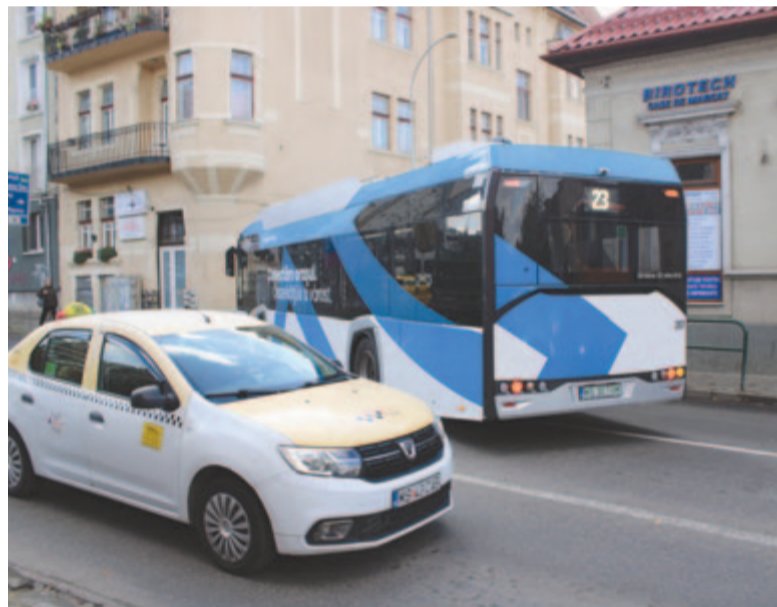
Nehezen kanyarodik be az autóbusz a Liviu Rebreanu utcába

A Dózsa György út felújítási szerződése szerint a kivitelezési idő 12 hónap, bár, ha az időjárás kedvező, az ígéretek szerint júniusra befejezhetik az 52,5 millió lejes munkálatot.