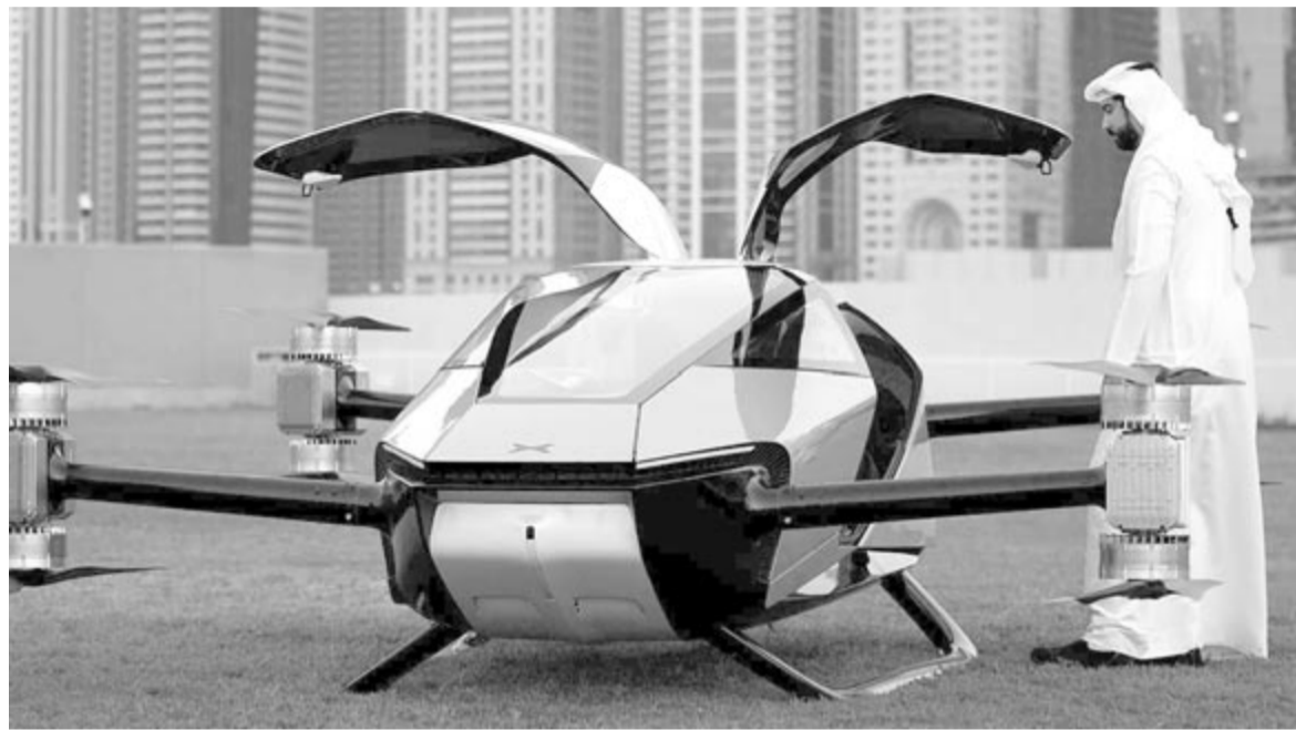
Dubaji dróntaxi, illusztráció

tatások, amelyek közül a leghíresebb az Uber és a Bolt. Ezek kapcsán már a Népújság hasábjain is beszámoltunk arról, hogy az ország