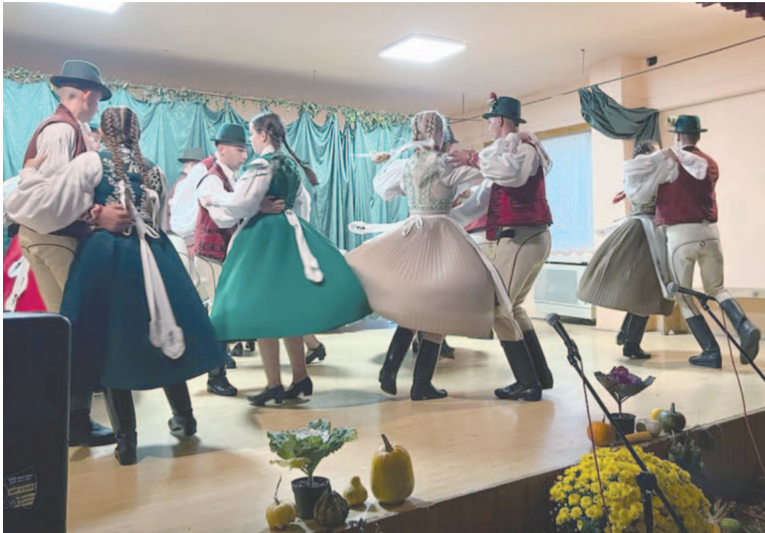
Az Aranyos együttes

Vasárnap első alkalommal ünnepelték az idősek napját Havad községben. A községközpont kultúrotthona megtelt időssel, fiatallal, a szemek örömkönyveivel, a szívek pedig hálával és szeretettel.