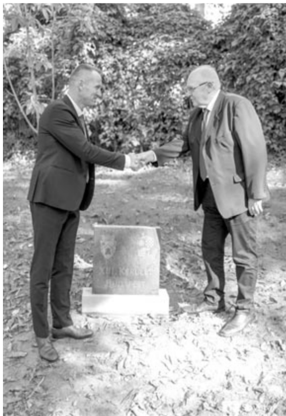
Minden testvértelepülés egy-egy címeres emlékkövet kapott

Szovátának nyolc testvértelepülése van: az anyaországi Budapest 13. kerülete, Tata, Csopak, Szikszó, Mezöberény, Százhalombatta és Sümeg, valamint a lengyelországi Brzesko. A legrégebbi kapcsolatot 1996-ban, a legfrissebbet 2002-ben kötötték, ezeket ápolni kell, fenn kell tartani, ami nem kis dolog. Múlt szombaton minden testvértelepüléssel lelepleztek egy címerrel és névvel ellátott követet, valamint a parkban egy-egy sétány viseli a helységek nevét. Minden vá-