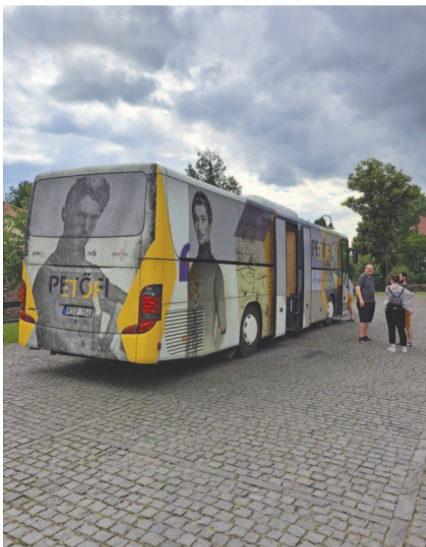
A Petőfi-busz Marosvásárhelyen 2023 májusában