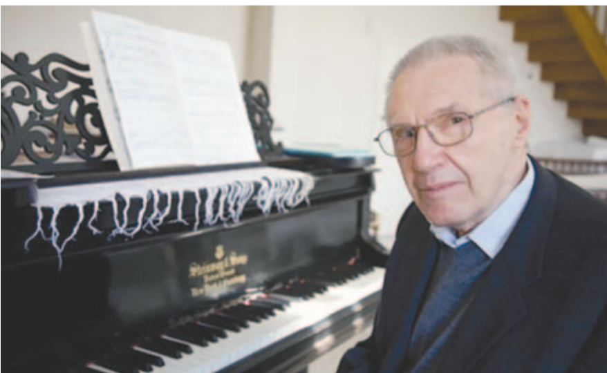
Kurtág György a zongoránál

Kurtág György Fin de partie című operáját szünet nélkül, egy részben, francia nyelven, magyar felirattal láthatja a közönség a Liszt Ünnepek keretében, az Elbphilharmonie Hamburg és a Kölner Philharmonie közreműködésével, a Műpa szervezésében. A produkció ezt követően Németországba utazik: Hamburgban, majd Kölnben is bemutatják.