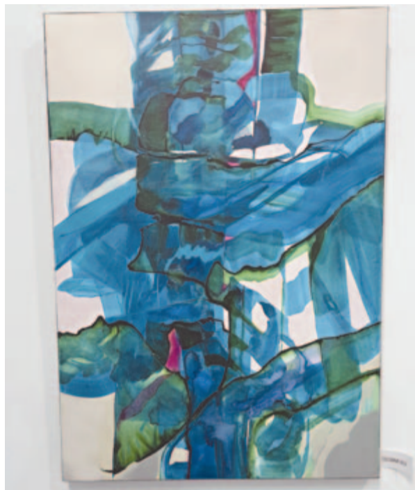
Crina Stănescu: Az oszlop XLV