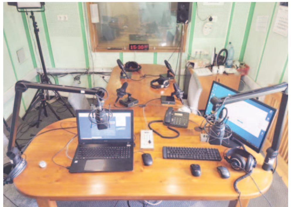
A Marosvásárhelyi Rádió négyes stúdiója, ahonnan a magyar nyelvű műsor szol

A Román Rádiótársaság 95 éves, de ez egyáltalán nem azt jelenti, hogy nyugdíjba készülné, éppen ellenkezőleg, fiatalodik, és továbbra is hitelesen tájékoztat, magyar nyelven is. A szerkesztőségek számára továbbra is eredményes munkát, a Román Rádiótársaság számára pedig boldog születésnapot kíván a Népszáság!