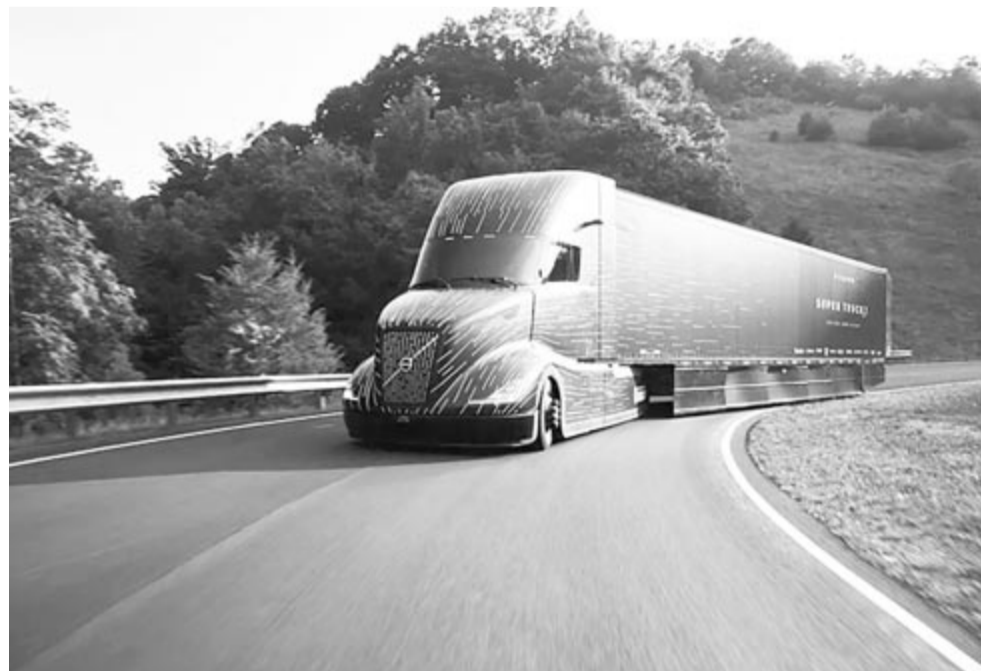
Volvo SuperTruck 2

A jelenlegi globális sajtó híreiből az látszik, hogy nemcsak a személyautók piacán, hanem a haszonjárművek, sőt a teherforgalmat lebonyolító járművek piacára is betört az elektromos hajtás, a verseny ezeken a területeken is éleződik. A gyártóknak az a céljuk, hogy megfogják a potenciális vásárlókat, akik számára az a kérdés, hogy ki kínál jobb ár-érték arányt?