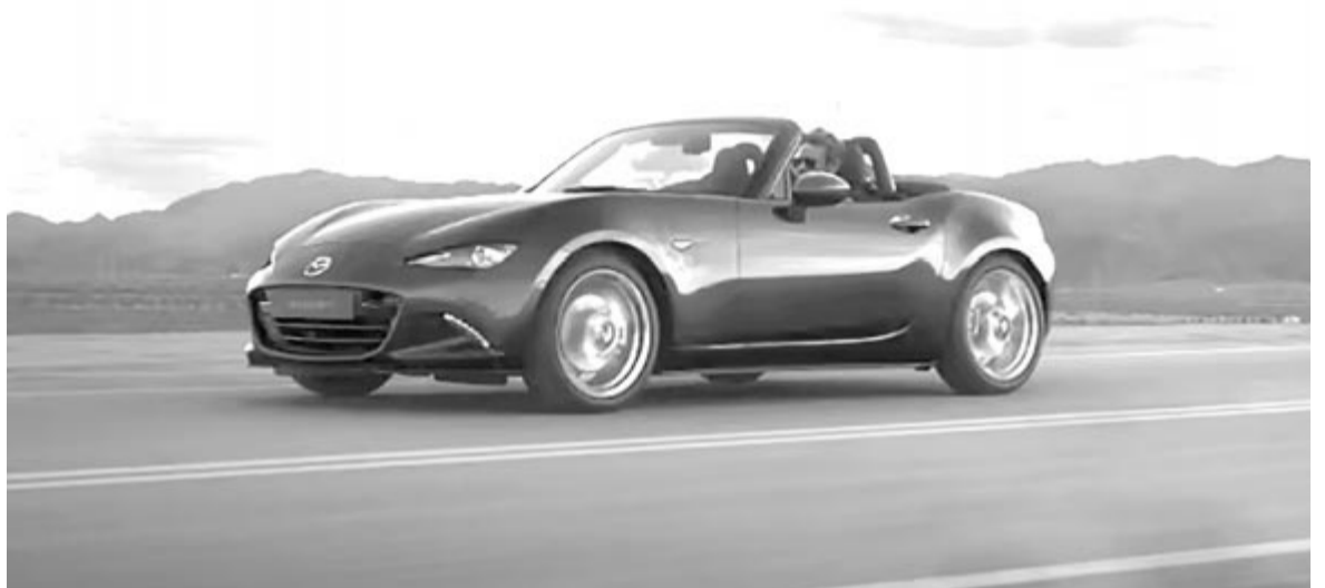
Mazda MX-5 ND

A hajtásláncokért felelős fejlesztési vezető a TopGearnek elmondta, nem számítanak arra, hogy 2030-ig kétszeresére vagy háromszorosára nő az akkumulátorok energiasűrűsége, viszont abban biztosak, hogy akkorra már lesz fejlődés a mostani állapothoz képest, ami segíthet abban, hogy az MX-5-ből is elektromos autót faragjanak. A típust nem a hangjáért szeretik az emberek, nincs is benne nagy hengerűrtartalmú motor, viszont pont azért, mert könnyű, rövid és jól kezelhető, kimagasló vezetési élményt ad, és ez az a tényező, ami miatt MX-5-kultuszról lehet beszélni. A mostani technológia mentén csak egy nagyon nehéz típust lehetne készíteni elektromos változatban, amit a Mazda nem szeretne, hiszen ezzel éppen a sajátos MX-5-élményt szüntetnék meg. Egyelőre tehát nem lesz elektromos Mazda kabrió, viszont a jövőre nézve komoly esély van rá!