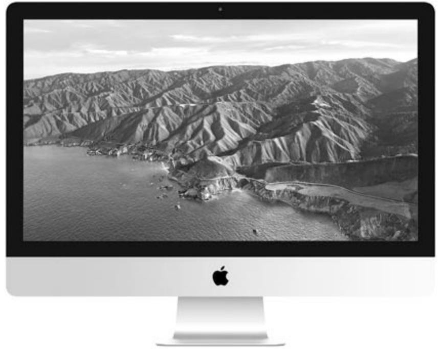
A még Intel processzorral szerelt 27 hüvelykes iMac

Vannak olyan felhasználók is, akiknek elég lenne a 24 hüvelykes, viszont más tényezők miatt nem váltanak az új iMacre. Elhangzottak olyan érvek, hogy az új iMac, bár megkapta a legújabb processzort, annak csak az alapváltozata került bele, azaz nem rendelhető M3 Pro vagy M3 Max chippel, egyeseknek pedig