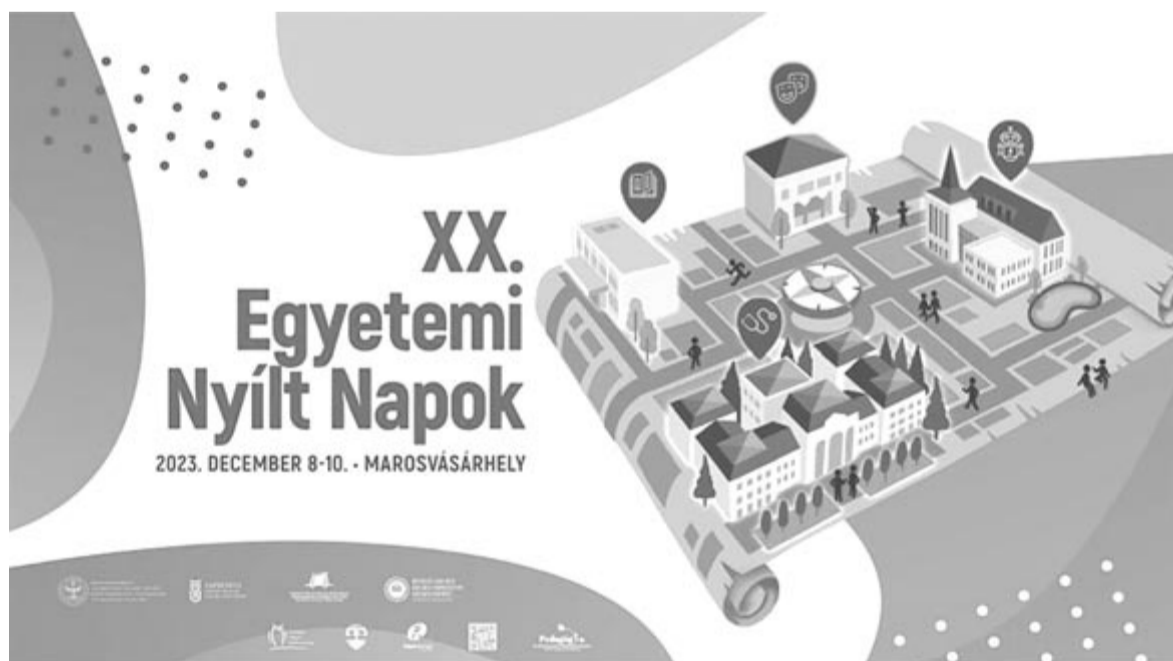
A XX. egyetemi nyílt napok plakátja