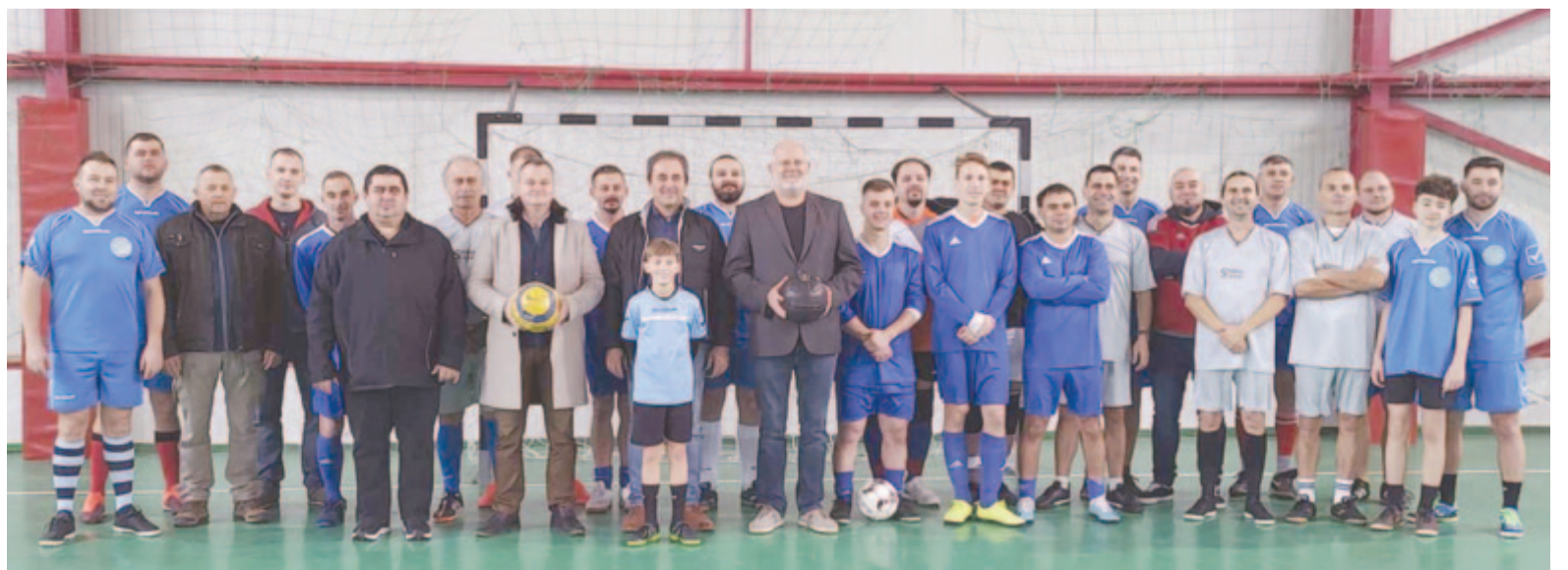
Ezúttal szűkebb körben, három csapat részvételével rendeztek emléktornát az Aranycsapat sikere 70. évfordulóján