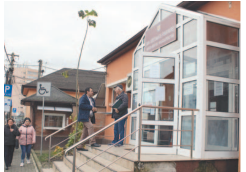
Hétfőtől sztrájkba léptek a munkaügyi dolgozók

Az érdekképviselőt azt írta nyílt levelében: a statisztikusok is megfognak feledkezni az infláció, a GDP, a külkereskedelmi mérleg és a természetes szaporulat adatainak összegyűjtéséről és feldolgozásáról, miként a kormány is megfeledkezett arról a július 13-án elfogadott memorandumról, amelyben a statisztikusok bérköveteléseinek rendezésére tett ígéretet. (MTI)