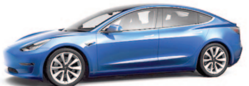
Tesla Model 3 és Model Y