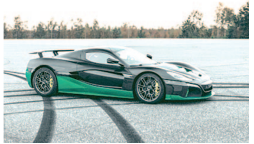
Rimac Nevera, az immár leggyorsabban tolató autó