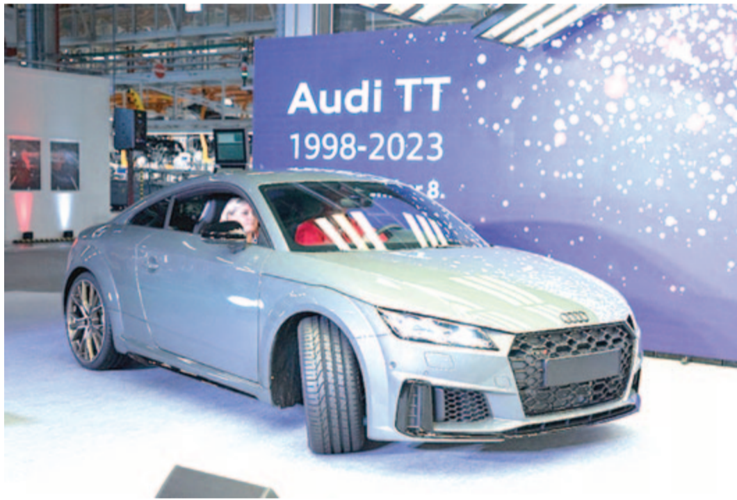
Az utolsó Audi TT

Természetesen nem az Audi TT a győri gyár egyetlen terméke, a tavaly mintegy 170.000 autó készült ott. Jelenleg az Audi Q3 és Q3 Sportback modelleket gyártják Gözserővel, emellett pedig készülnek az új modell, a CUPRA Terramar gyártására is, amely a tervek szerint jövőtől készülhet majd a győri üzemben.