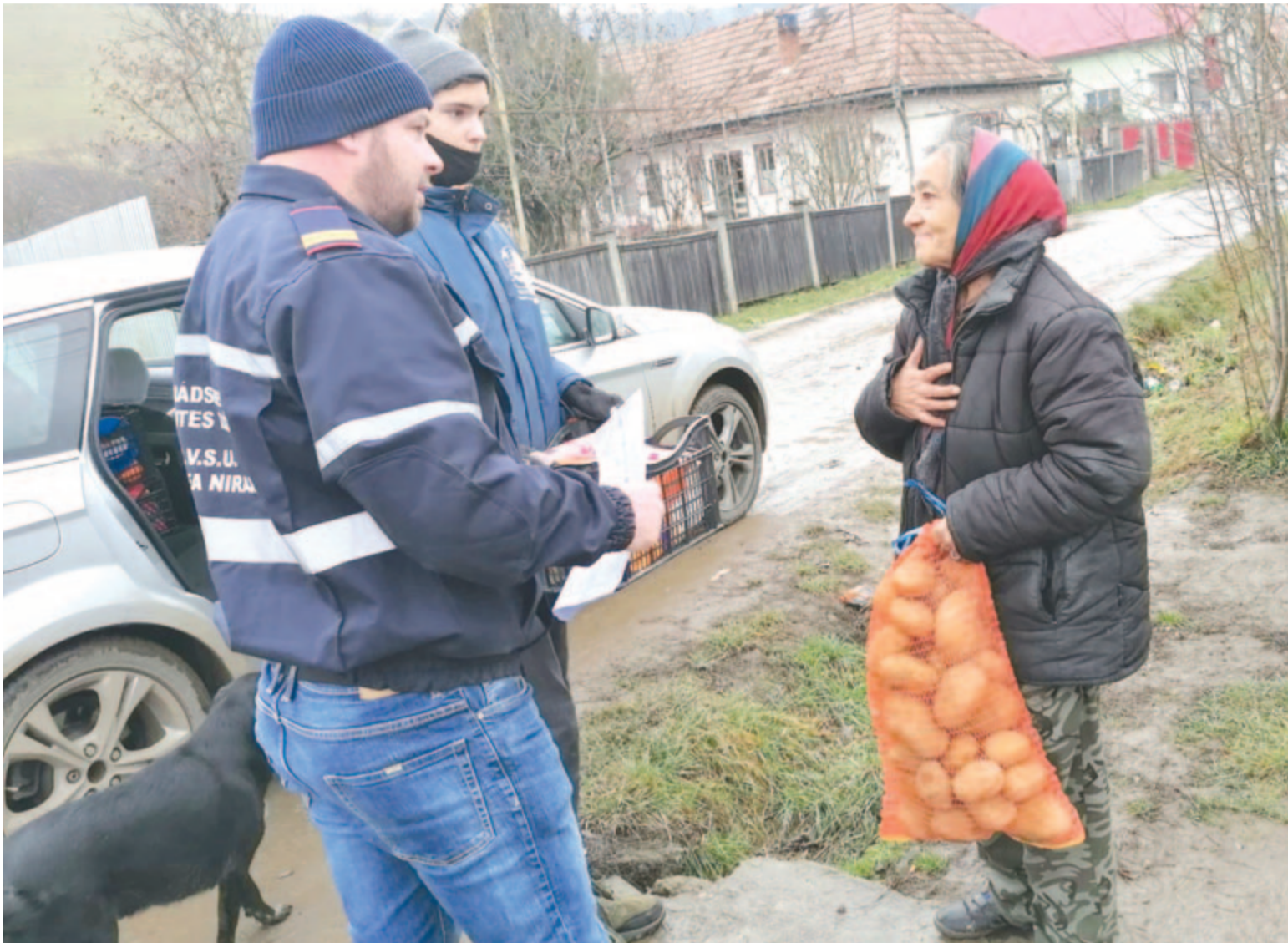
Hatodszor szeretnének adományozni rászoruló időseknek és betegeknek