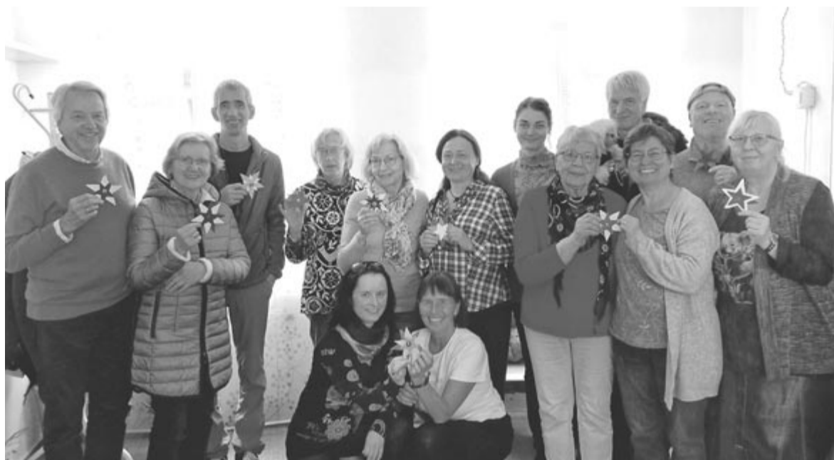
A németországi Orizont Egyesület tagjaival

December 8-án, pénteken gálaesten ünneplik az Outward Bound Romania 30., illetve a hOrizont program működésének 25. évfordulóját. Ezt megelőzően arra kértük a program irányítóit, foglalják össze röviden az általuk koordinált szociális program működését a kezdetektől napjainkig.