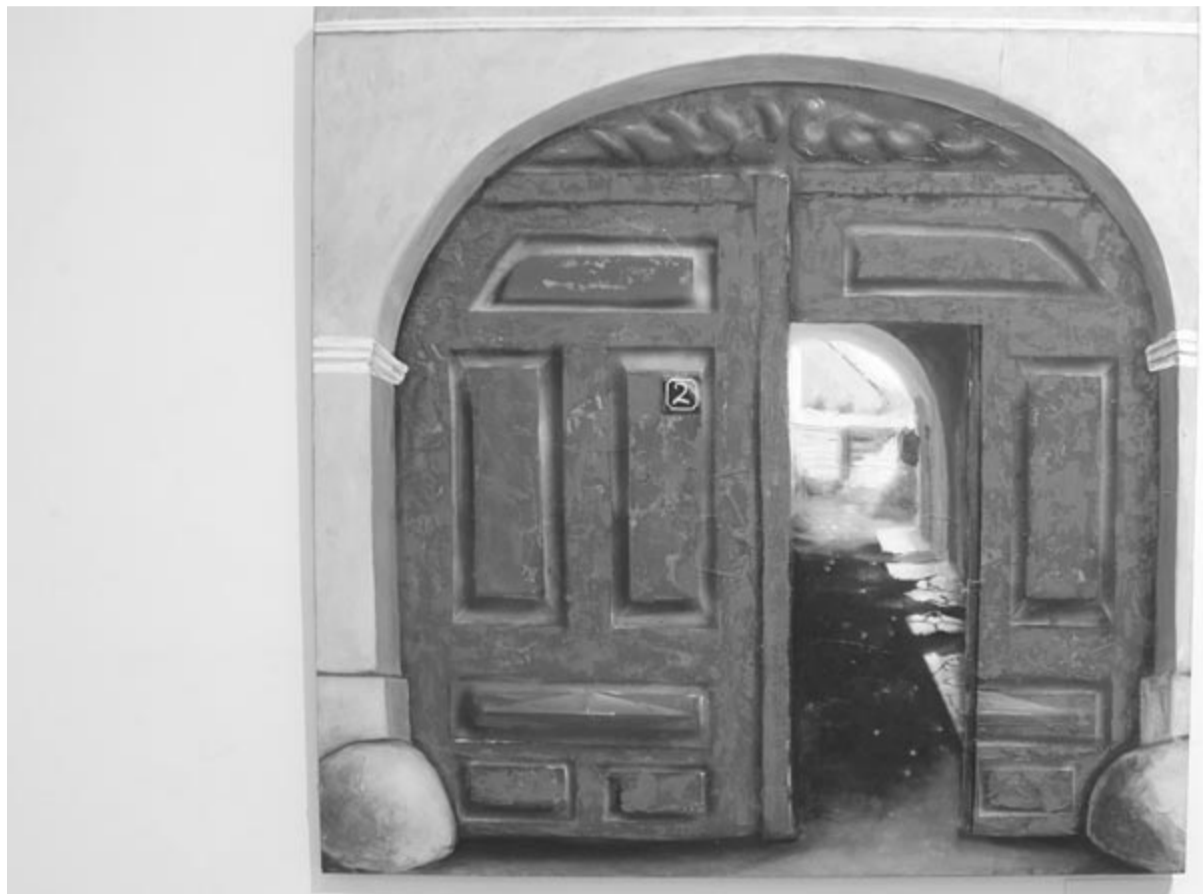
Lapszámunkat az idei Téli Festészeti Szalonon látható alkotásokkal illusztráltuk

117 éve, 1906. december 18-án született Érmihályfalván a Baumgarten-, József Attila- és Kossuth-díjas költő, prózaíró, 2012-től a Digitális Irodalmi Akadémia posztumusz tagja. Elhunyt 1981. április 23-án Budapesten.