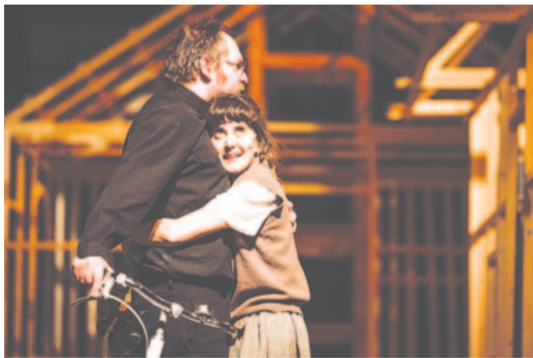
Az igazság gyertyái

Boris Vian: Piros fű . Tragikomikus emléktázas. Rendező: Fehér Balázs Benő. Kisterem. Az előadás 12 éven felülieknek ajánlott. Időtartama 1 óra 40 perc (egy szünettel).