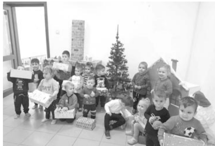
Erdőszentgyörgyön és Bözödön 430 gyerekek szereztek örömet a Rotary Téka cipősdobozai