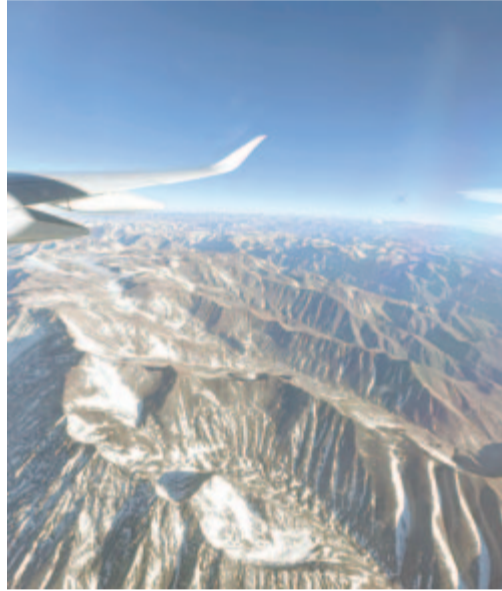
Az Andok a magasból

(Pablo Neruda: Egy himnusz az élethez, Somlyó György fordítása)