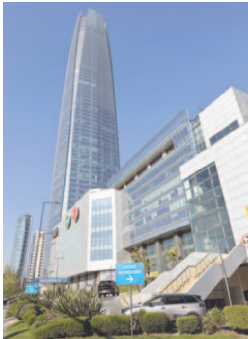
A Gran Torre de Santiago, Dél-Amerika legmagasabb épülete

Gyalogosan vágok neki a város meglátogatásának. Santiago határozottan kellemesen lep meg, tiszta, rendezett. A forgalom világvárosi ugyan, de a széles utakon mindenki elfér, az autósok, gyalogosok betartják a szabályokat. Az emberek egészen európai kinézetűek, jól öltözöttek, mintha nem is egy két-pólusú dél-amerikai fővárosban lennénk, hanem mondjuk Barcelonában, az Európai Unió egyik fellegvárá-