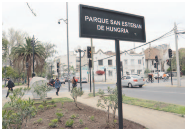
Magyarországi Szent István park, Santiago de Chile

Prekolumbián művészetek chilei múzeuma sötétebb figurákban potenciális zsi-ványt vélek felfedezni. Az elektronikai eszközeimet mégsem rakom táskám mélyére – hiszen akkor fényképek és tájékozódás nélkül maradok –, inkább úgy igyekszem megúsni a bajt, hogy szorosabban magamra tekerek mindent, s folyamatos helyváltoztatásban maradok. Az állandó mozgásra szükség is van, mert még bőven van látnivaló. A prekolumbián művészetek múzeumában Amerika 12000 esztendőitől illatozó történelmének időfolyosóján barangolok, majd bevágodom a központi piac tenger gyümölcseitől bűzlő útvesztőjébe, végül az üzleti negyed elegáns felhőkarcolói között ténfergek. A hangzatos Sanhattanben egy perc alatt emelkedem a város fölé, Dél-Amerika legmagasabb épületének tetéjére, a 300 méteres, 62 emeletes Gran Torre Santiago csupa acélból és üvegből készült, 360°-os kilátóteraszára. Odafönn csak tatom a szám, káprázik a szemem, figyelem a monumentális hegyek tövében élő milliónyi ember nyüzsgését. Azon ámulok, hogy micsoda szerdületes dolgokat tud teremteni az ember Isten árnyékában, és hogy mennyire vágyunk arra, hogy hasonlítsunk rá, hogy közelebb kerüljünk hozzá. Ezen a ponton méltóképpen búcsúzom a várostól, holnap irány Valparaíso.