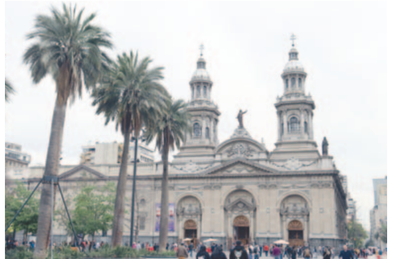
Katedrális a Plaza de Armason

Megjegyzem, hogy bár többnyire európai kinézetű minden és min-