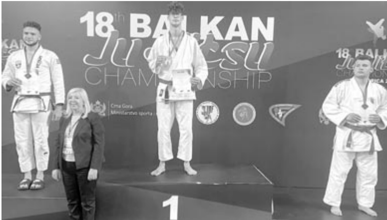
A dobogó legmagasabb fokán a Balkán-bajnokság díjkiosztó ünnepségén

„Mindig is ez egyéni sportágak, azon belül az önvédelmi sportágak érdekelték, ahol a saját erőmre és tudásomra számíthatok – mondja érdeklődésünkre. – A sport iránti szeretetet édesapámtól örököltem, aki fiatal korában nagypályás és teremlabdarúgó volt. Cselgáncsban országos szintig jutottam el, taekwondóban pedig 7 évesen már országos