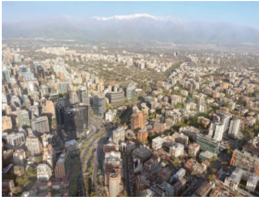
Kilátás Santiagóra a 62. emeletről

sem tűnik fel, hogy senki fiát nem látok az utcákon hasonló holmikkal szaladgálni. Mindenkinnek megköszönöm a jó tanácsot, és attól kezdve már óvatossabb vagyok, a