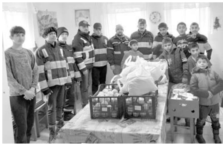
A vártnál több családnak, gyerekeknek tudtak csomagot szállítani a tűzoltók

„Nem az a gazdag, akinek sok van, a gazdag az, aki meg tudja osz-