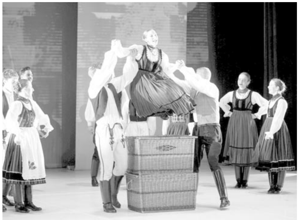
Jelenet a Kolozsvári piactéren produkcióból