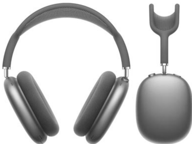
Apple AirPods Max,

Ami viszont egészen biztosan a legnagyobb port kavarja, az az Apple okosszemüvege, a Vision Pro, ami szintén márciusban érkezik meg az Egyesült Államokba. A kombináltvalóság-szemüveg sokak fantáziáját megmozgatja, hiszen sokkal többre lesz képes, mint a jelenleg kapható VR headsetek, ezzel együtt viszont az ára sem lesz alacsony. Kár lenne most találgatásokba bocsátkozni, érdemes megvárni a tavaszt, lássuk, mi sül ki ebből a projektből, és mire lesz használható a gyakorlatban az Apple Vision Pro.