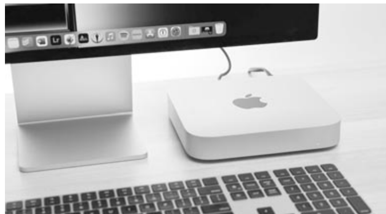
Mac Mini – a kialakítás aligha fog változni az M3-as processzor bevezetésével