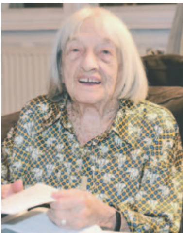
Keleti Ágnes 2021-ben, 100 évesen

Klein Ágnes néven született 1921. január 9-én Budapesten, a család később Keletire magyarosít- totta a nevét. Keleti Ágnes 1937-től a budapesti Vívó és Atlétikai Club- ban, 1938-tól a Nemzeti Torna Egy- letben sportolt. 1939-ben lett a válogatott tagja, első magyar baj- nokságát 1940-ben nyerte, de zsidó származása miatt még abban az évben eltiltották mindennemű sporttevékenységtől. A második vilá- gháború végét, a Magyarország 1944. március 19-i német megszá- lása utáni időszakot álnévre szóló hamis papírokkal Szalkszentmár- tonban sikerült átvészelnie, ahol fu- tással tartotta fenn állóképességét. Édesapja és több családtagja az auschwitz koncentrációs táborban halt meg, édesanyját és testvérét a svéd diplomata, Raoul Wallenberg mentette ki Budapestről.