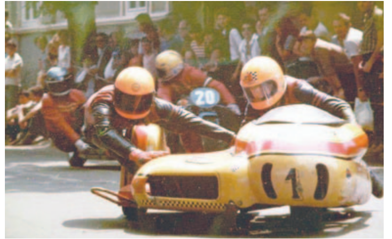
Marosvásárhelyen nagy népszerűségnek örvendtek a gyorsasági motorversenyek