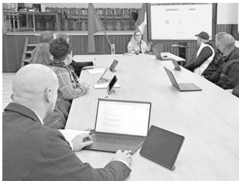
November végére beüzemelték a rendszert, január 3-ától használják is

A rendszerre tavalyelőtt nyújtott be pályázatot a község háza, tavaly kaptak rá támogatást, így megvásárolhatták a szükséges digitális eszközöket és a rendszert működtető programokat. A