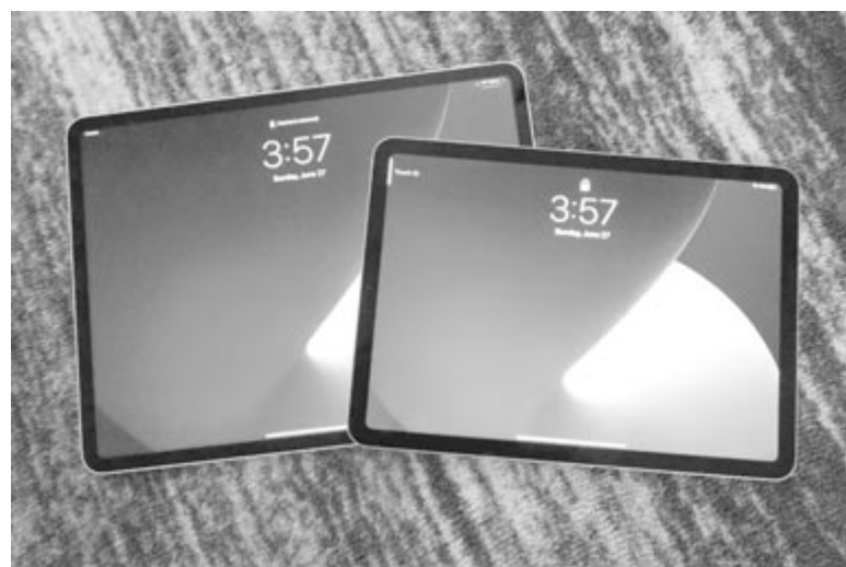
A 11 és a 12,9 hüvelykes iPad Pro

Van viszont olyan termék, amely a híresztelések szerint idén megkapja az OLED-kijelzőt, még hozzá az iPad Pro 11 és 12,9 hüvelykes változata. Elméletileg ennek sincs már messze a piaci bevezetése, a