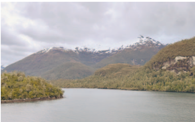
Az English Narrows-tengerszoros

S ha addig csak csellengtem, attól kezdve igazi tengerjáró Szindbádnak érezhetem magam. De hősködésem nem sokáig tart, mert amint a hajó kifut a védett öbölből a nyílt tengerre, bebizonyosodik az, amitől már otthon is tartottam: a Csendes nem is csendes, ellenkezőleg, nagyon is viharos. A hajót egész éjjel méretes hullámok dobálják, a büszke és elszánt világjáróból sápadt, ágyban fekvő tengeribeteg lesz. Ide-oda gurulok az ágyban, már izomlázam van a sok kapasz-