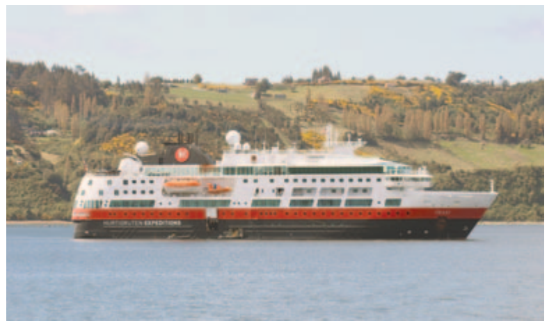
A Fram expedíciós hajó

A továbbiakban a chilei partok csak a legnagyobb hozzáértéssel és navigációs eszközökkel kiismerhető szigetvilágában hajóznunk délre. Látványosan vad szorosokon evickélünk keresztül. Ha felmegyek a fedélzetre, azt sem tudom, hogy a hajó melyik oldalára szaladjak hamarabb. Ha keletre tekintek, akkor a havas Andok fenséges bércei, hófödte vulkánjai integetnek jég hidegen felém, ha átmegyek a jobb oldalra, akkor vérnarancs naplementével merülhetnek a Csendes-óceán mélyére. Még szerencse,