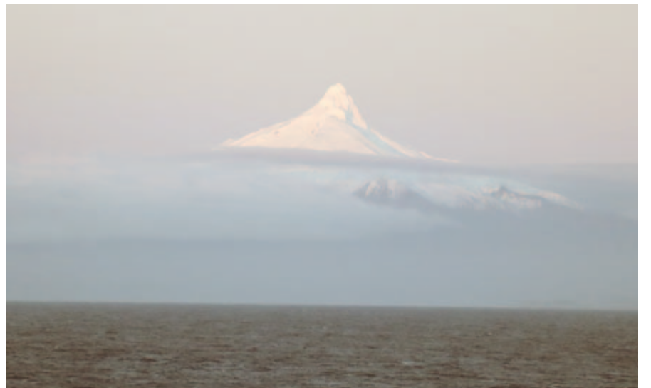
A havas Corcovado-vulkán Chile partjánál

miak. Ez a világ egyik legcsapadékosabb helye, ezért utak sincsenek, a házakat deszkákból és facölöpökből összetakolt gyalogösvények kötik össze. A kizárólag vízi úton megközelíthető települést a parti örség és a hetente egyszer-kétszer megforduló kompjáratok látják el élelmiszerekkel és a legszükségesebbekkel. Kihaltnak tűnik, helyi idegenvezetőnk elmondja, hogy sokan elköltöztek már, a gyermeklétszám is alaposan megcsappant. Délelőtt van, a gyermekek takaros kis iskolájuk ablakából integetnek mosolyogva. Velünk egyszerre egy forgatócsoport is érkezik, amely a világ egyik legdélebbi emberpopulációjának maradványáról, a kawésqar nép utolsó tagjairól készít felvételt. Szomorú, hiszen akaratlanul is a beolvadással és elvándorlással fenyegetett, zsugorodó erdélyi ma-