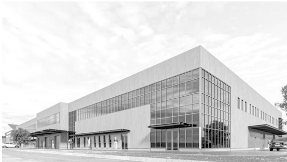
Az új utasterminál látványtervei