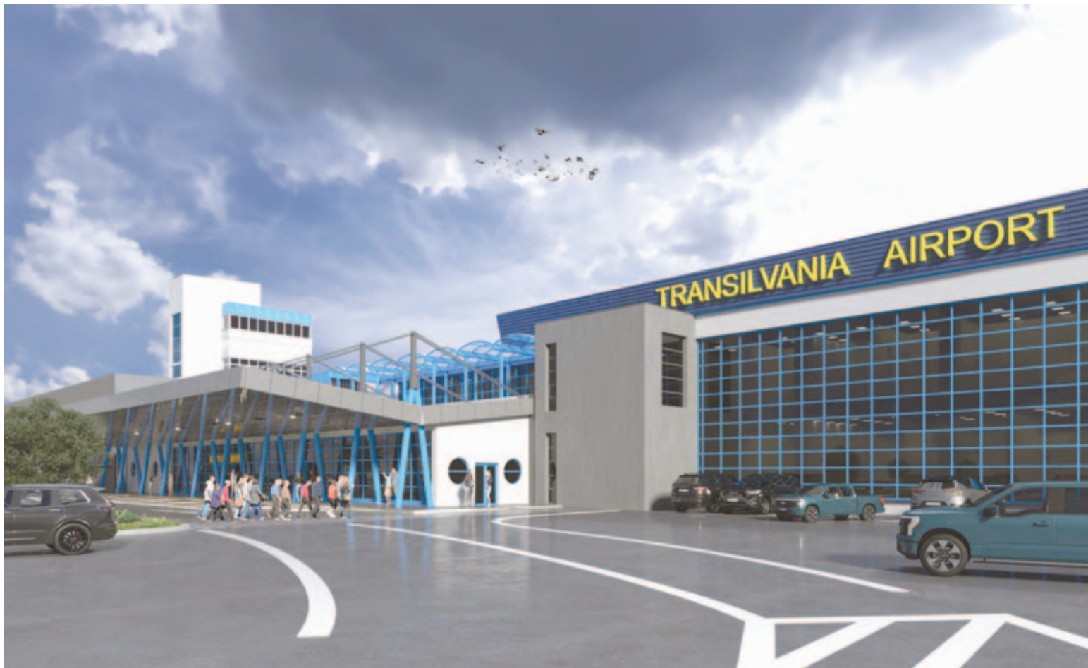
Az új utasterminál látványterve