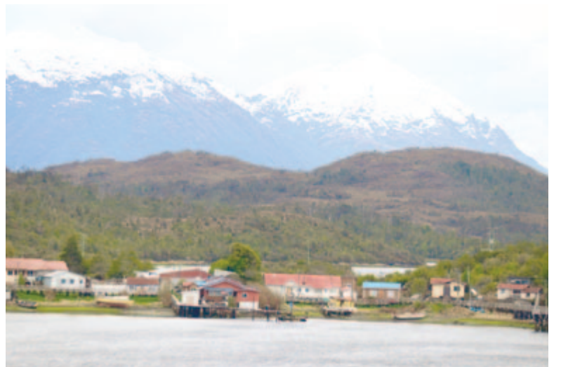
Puerto Edén, Chile egyik legeldugottabb települése

Borús gondolataimat fekete fellegek váltják, a szubpoláris óceáni éghajlat megmutatja igazi arcát, ködös, nedves idő ereszkedik a tájra, amitől a tengerszorosok még sejtelmesebbé válnak. A hegyeket borító őserdőkre nyúlós felhők tapadnak, a sötét fák mögött gnómok settenkednek, a sziklázatonyok süllyedő szellemhajókként locsognak a hullámverésben. Beleborzongok a látványba, és inkább viszsztatérek a fedélzetről a panorámaablakos társalgó meleg biztonságába.