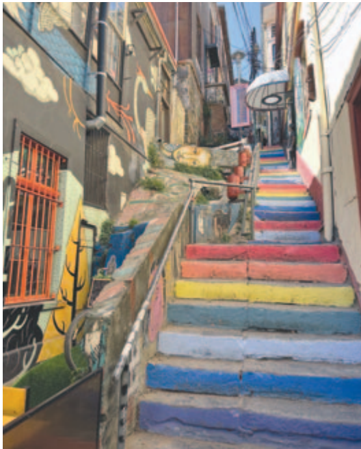
Színes, meredek lépcsősor Valparaisóban

kötő- és kereskedővárosának, amit sehol máshol nem tapasztaltam korábban. Macskaköves síkatorok labirintusában bolyongok napestig, s közben mindig valami érdekesre találok, egyebek mellett egy indián piacra, ahol az őslakók tradicionális gyógyíreit tanulmányozhatom. Ez a város számomra azonban nem csupán utazásom egyik állomása, hanem fő úti célom kiindulópontja. Itt ülök fel az MS Framra, arra az expedíciós hajóra, amellyel megkezdődik az út legizgalmasabb szakasza, elindulok a chilei partok mentén délre, az áhított Antarktiszra.