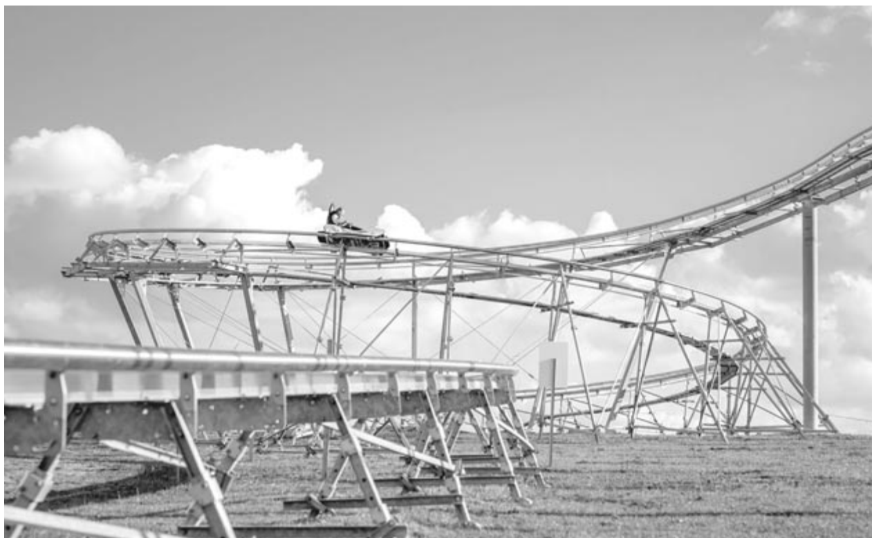
Hargita megyében már több pálya is van, nálunk most tervezik az elsőt

A beruházást a Kápolna-oldalnak nevezett határrész déli részén valósítják meg. Ezzel az építkezéssel Szováta nem szeretne senkivel versenybe szállni, arra sem törekszik, hogy a megyében ez legyen az első ilyen beruházás, csupán azt szeretné, hogy a megyébe és a fürdővárosba érkező turistáknak többletet, egy újabb szolgáltatást és szórakozási lehetőséget biztosítson – szögezte le a városvezető. (GRL)