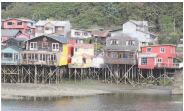
Castro cölöpökre épített házai

Ekkor már merek és tudok is tükörbe nézni, nevetek saját nyomorúságomon, gyorsan pontra teszem magam, meggyógyulok. Boldog va-